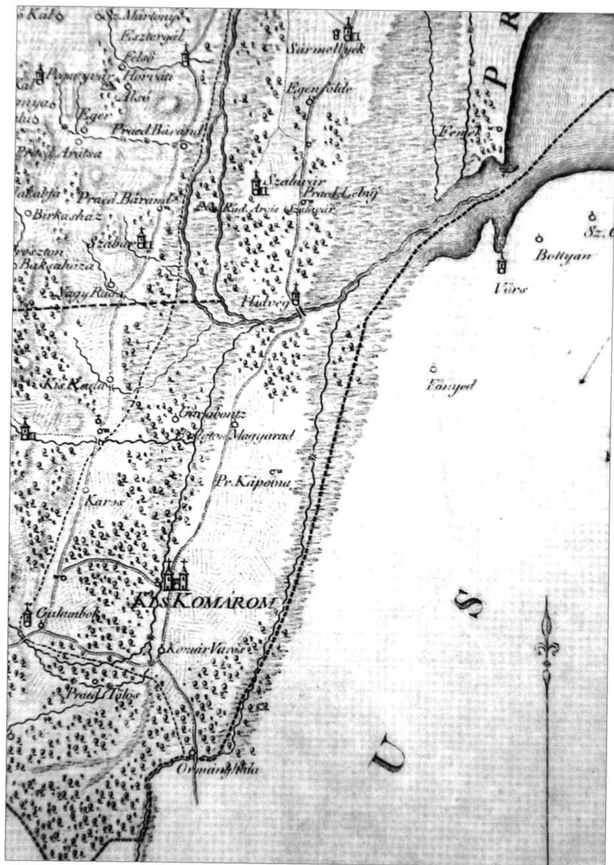
1. kép: Az ormándi-berek rekonstruált térképe a II. József-féle katonai felvétel alapján 31