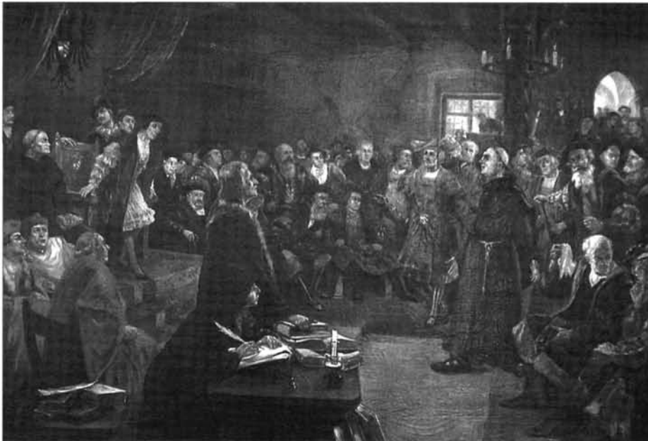
15. kép: Kaszaházi (Lacher) Antal: Luther a birodalmi gyűlés előtt, 1935, olaj, vászon, a Zalaegerszegi Evangélikus Egyházközség tulajdona