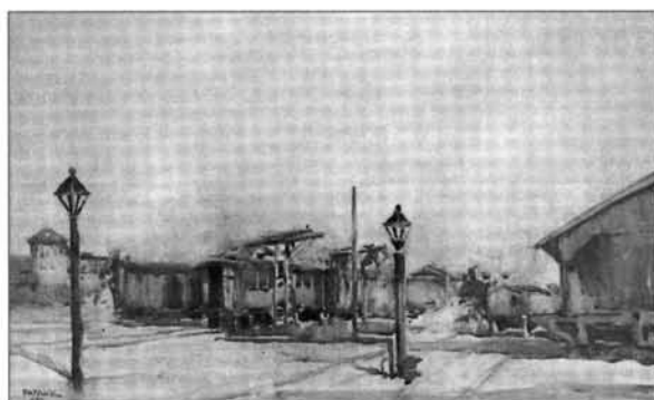
6. kép: Pataky Andor: Vasútállomás, 1920, papír, akvarell, magántulajdon

kiállításra volt az Iparművészeti Múzeumban és a Nemzeti Szalonban. 34 A korabeli (helyi) sajtó az ország jelentős művészei között emlegeti. Tevékeny részese volt a művészeti közéletnek, egyik szervezője 1925-ben a zalaegerszegi kiállítás művészeti szekciójának. Itt bemutatott alkotásait a Zalamegyei Újság tudósítja a tárlat legértékesebb részének tartotta. 35 Ugyancsak lelkesedve (s ami talán fontosabb: mély intuícióval) írt Fára József levéltár-igazgató Patakynak három másik művésszel közösen, 1926-ban rendezett zalaegerszegi kiállításáról: „Pataky a falu szobrása. Csak a falu művésze teremthette meg a fővárosban is feltűnést keltett Hegybíró. Pompás alak, amelyre azt mondta az egyik látogató „Hisz ez a szobor be van csípve“... Pataky általában a falusi élet derűsebbik oldalát látja műveiben... Állatszobrai... kitűnő megfigyelő képességéről tanúskodnak... Szobrai és keramikai tárgyai mellett komoly figyelmet érdemelnek akvarelljei, amik közül több tájképe, de különösen figurális tárgyú képei igen sikerültek” 36