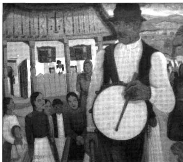
1. kép: Muhoray Mihály: Göcseji dobos, 1930, olaj, vászon, ltsz. GM.54.2.

folklorisztikus jellegzetességei) mégis megengedik, hogy így tekintünk rájuk. A csoportból Muhoray és Némethy dolgozott talán a legtöbbet a Göcsejben, előbbi 1937-ben már a negyedik kiállítását rendezte Zalaegerszegen. 20