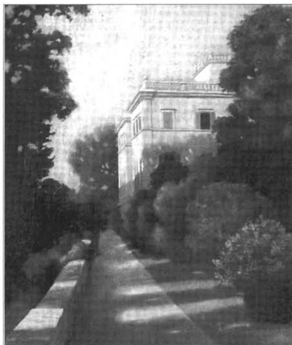
8. kép: Göbel Árpád: Római palota, 1931, olaj, farost, ltsz. GM.81.4.

A rajztanárok közül a művészeti közéletben a zalaegerszegi reálgimnázium tanára, Göbel Árpád (1886-1931) volt a legaktívabb. A jelek szerint igazi misszióként élte meg hivatását, tanított, szervezett, kiállított. Oltárokat tervezett (a zalaszentiváni templomba, a válickapusztai kápolnába, az egerszegi katolikus házba), 41 városi megbízásból portrét festett a városháza közgyűlési termébe, 42 tankönyvet illusztrált, 43 máskor Nagykanizsán tartott előadásáról olvashatunk. 44 Képein többnyire városát és környezetét örökítette meg ( Zalaegerszeg látképe a csácsi hegyről , 45 Zalaistvándi látkép, Zalapartján, A Balaton Révfülöp mellett stb.), azok igazi krónikásának bizonyult. A helyi újság igen nagyra tartotta alkotásait. 46 Az 1925. évi zalaegerszegi nagy kiállításon – melyen a művészeti szekció szervezője és az itteni (rész)kiállítás rendezője is volt 47 – Pataky mellett ő kapta a másik arany érmet. 48 1930-ban egyéves ösztöndíjat kapott a Kultuszminisztériumtól a római Collegium Hungaricumba. Ebben az időben művészete a római magyar kultúrintézet támogatottjai által kialakított új irányzat, az olaszországi novocentoval rokonságot mutató római iskolához tartozott. Itáliából az Örök Város részleteit megörökítő, reneszánsz ihletésű vásznakat küldött haza. Részt vett a csoport 1931-es Nemzeti Szalon-beli kiállításán is, 49 röviddel hazatérése előtt azonban tragikus hirtelenséggel elhunyt. 50