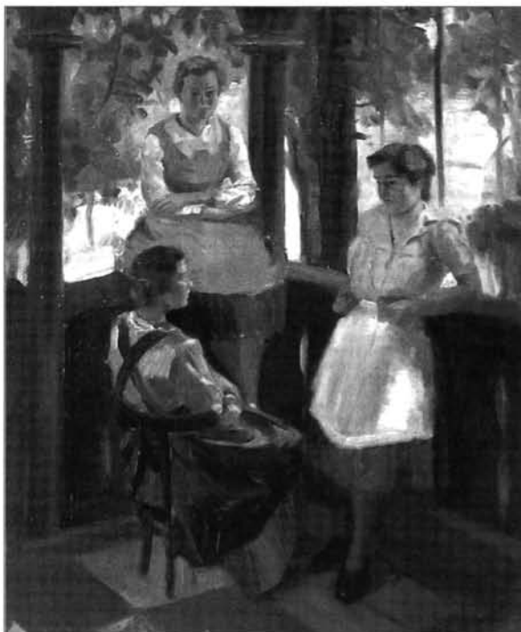
10. kép: Károly Gyula: Zalavári lányok, 1930-as évek, olaj, vászon, magántulajdon

Ugyancsak a Balaton-parti város festője volt Károly Gyula (1910-1989). Kandó László és Nagy Sándor tanítványaként, 1939-ben fejezte be a főiskolát. Művészetét az akadémikus stílus mellett mély valóságossága határozta meg. Alapvetően egyházi megbízásra dolgozott a veszprémi egyházmegye területén, freskókat és oltárképeket festett, a templomok korábbi berendezését restaurálta. 1935-ben készítette a balatonakali, 1936-ban (a főiskolán kihagyta az 1936/37-es tanévet) és 1939-ben a dörgicsei templom fal- és mennyezetképeit. E korai műveit historizáló hajlam és visszafogott kolorit jellemzi. Különösen jól sikerült balatonakali Szent Család -képe, ahol a kis Jézust tartó Szent József és a rokkája mellett ülő Szűzanya antikizáló épületrom előtt jelenik meg, derűs, arkádiai békességet sugárzó táji környezetben. A reneszánsz ihletésű kompozíció az akkor még főiskolás Károly mély elhivatottságáról és tehetségéről tanúskodik. Művészetének legtermékenyebb időszaka az 1960-as és 70-es évekre esett, vallásos indíttatása miatt azonban méltatlanul kevés megbecsülést kapott. 71