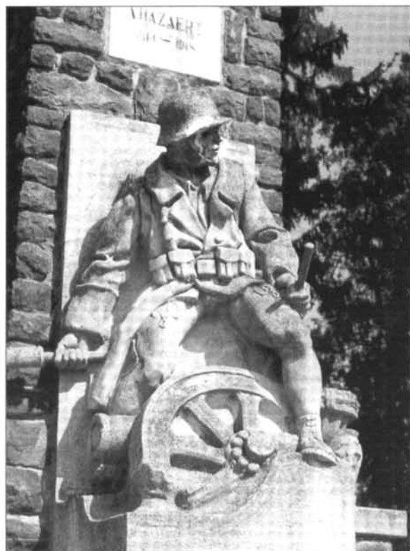
7. kép: Pataky Andor: Az I. világháborús emlékmű részlete Mihályfán, 1934.

A korszak legfontosabb feladatát a köztéri szobrászat terén a hősi emlékművek állítása jelentette. Zala megye falvaiban e megbízások oroszlánrésze Pataky Andornak jutott. 40 Emlékművei a szobrász keresettségére ellenére nem mutatnak kiemelkedő kvalitást, s egyben elárulják képességeinek határait is. E szobrok egyik vonulata trófeákat markoló turulmadarat, a másik akció közben lévő katonákat ábrázol. Hiányosságai elsősorban a felnagyított csavarodó testek és a mozgás ábrázolásakor ütköznek ki, azonban a vidéki körülmények között nem különösebben igényes műfaj mesterségbeli átlagát feltétlenül meghaladják.