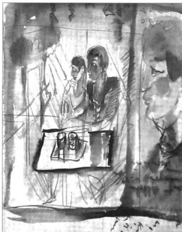
3. kép: Egry József: Kávéházban, 1930-as évek, papír, akvarell és tus, ltsz. BM.58.305.

A zalai születésű Egry 1918-ban, házasságkötését követően költözött Keszthelyre. Itt és Badacsonytomajon bontakozott ki balatoni ihletésű, a természeti jelenségeket mint médiumot felhasználó, fénytől izzó, zseniálisan egyéni piktúrája. Magányos óriásként élt, barátai voltak, követői azonban nem. 22 Konzervatív ízlésű környezete nem volt elég érett pantheisztikus, a napfény és az atmoszféra vibrálását, a pillanat lényegét megragadó s azt a belső líra kifejezésének szolgálatába állító képeihez. „Egry József a modern magyar festőművészet egyik legértékesebb, élenjáró mestere... csodálatra méltó képeinek nagyrészen a Balaton fényei dominálnak. És ezeket a képeket Egry külföldi nagy sikerének színhelyén: Berlinben, Párizsban szeretik legjobban. Itt nálunk még mindig nem értik meg eléggé.” – írta a Zalai Hírlap a festő 1936-ban, a budapesti Mária Valéria utcában rendezett kiállítása kapcsán. 23 Valóban Egry gondolatvilága, művészi elvei, elvonatkoztató hajlama, sommázó figura-felfogása az 1920-as évek első felében párhuzamban álltak az Európa vezető galériáiban látható legújabb törekvések egy részével, de a zalai embereket még másfél évtizeddel később sem érintették meg. Igaz, legalább a sajtó felfigyelt tárlatára, de a megyében élő művészekre gyakorolt hatása csak jóval később, már a mester halála (1951) után mutatható ki.