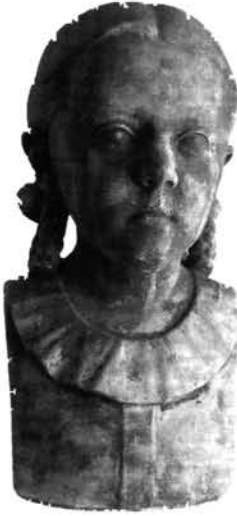
14. kép: Vörös János: Kislány mellszobra, 1939, gipsz, ltsz. TGyM.99.34.

vállalt – a szobrászattól távol álló – munkát. 1943. december 20-án a zalaegerszegi városházán megalakuló Deák Ferenc Irodalmi és Művészeti Kör örökös tagjává, és a képzőművészeti szakosztály elnökévé választotta. Az akkor veszprémi püspök Mindszenty Józsefről készített, kisméretű portréja igen jó jellemábrázoló készségéről tanúskodik. 1946-ban készítette el a zalaegerszegi munkás-mártírok emlékművének rendkívül igényes plasztikájú dombor-művét. 82