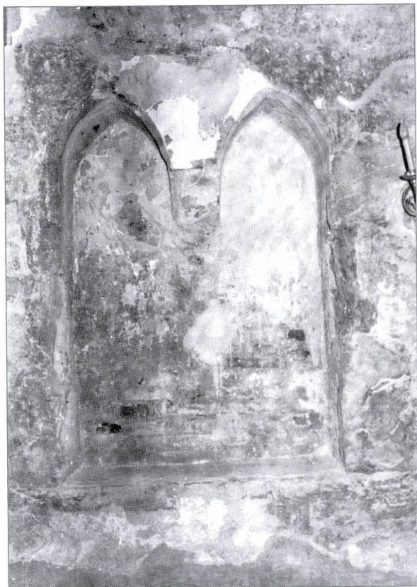
4. kép: A szentélyben lévő papi ülőfülke kutatás közben