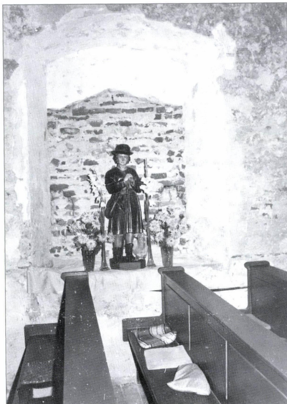
5. kép: A déli hajófalban feltárt kapu