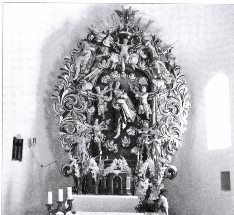
3. kép: A 18. század eleji Mária oltár a szentélyben