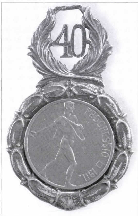
1. kép: Kisfaludi Strobl Zsigmond: A Progressio páholy érme, 1911, bronz és ezüst, átm. 38 mm, foglalata: 86 x 53 mm, ltsz. GM.K.76.3.111.