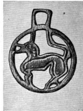
4. kép. Honfoglaláskori áttört bronzkorong. Magyar Nemzeti Múzeum

virágzásának kora a X. sz. közepe és a XI. sz. közepe közötti száz év. Szent István kaphatta azt az ezüst enkolpiont (zománcos aranylemezekkel), amely mint öreg, elrongálódott Kettlach-stílusú darab III. Béla király sírjából került napvilágra. 20 Ennek bronzban készült, olcsó, zománcos, kisméretű utánzatát az aquileiai múzeum őrzi.