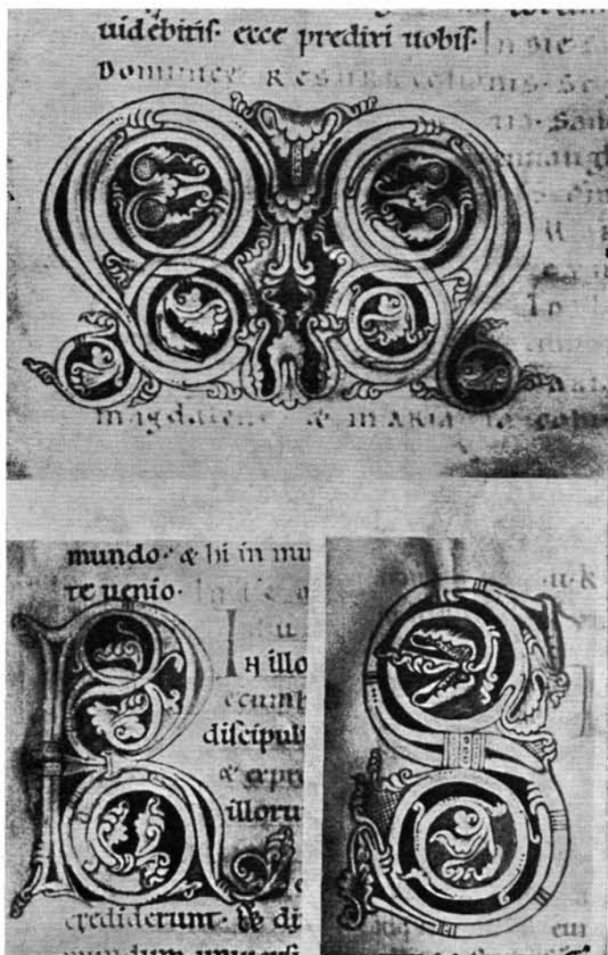
8. kép. Az esztergomi Evangelistarium kez- dőbetűi.

A visszahajló levelű pécsi növénykompozíciókról már volt szó. Az oroszlán alakját Esztergomban a XIII. század elején a királyi kápolna szentélyének falára festették hétszer egymás mellé (VII. t.). Ott is részben balra, részben jobbra menő oroszlánalakok szerepelnek. Az esztergomi oroszlánokon is van pontsoros keresztkötés, akárcsak az aspensorium egyik oroszlánalakján is. Minden hasonlóság ellenére is azonban a genetikai összefüggésekre kell figyelniük, és a külső hasonlóságot nem szabad középpontnak tekintenünk. A freskó színei, a stilizálás módja és egyes részletek, például az oroszlánalak kontúrozása, textiliákra mutatnak, mint közvetlen mintaképre. A chartres-i székesegyház kriptájának falán ugyanilyen elrendezésű oroszlánalakok vannak, ugyanilyen palmettás keretben. Mintha ugyanannak a mesternek műve