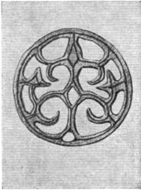
3. kép. Honfoglaláskori áttört bronzkorong. Magyar Nemzeti Múzeum