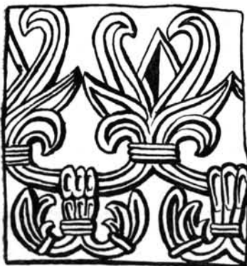
5. kép. Részlet a veszprémi kőfaragványokról (XII. sz.)