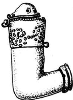
11. kép. A debreceni kis veres pipa

akadt szegény ember, aki 50—60 kilométernyi utat is megtett gyalogszerrel egy-egy vásáros helyre, hogy a keservesen összerakosgatott pénzceskjéből ezt a pipát megvegye magának. 9