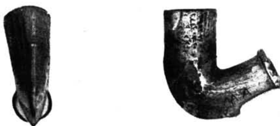
13. kép. Berceli sarkantyús pipa elő- és oldalnézete

Kétségtelen azonban az, hogy a nyíregyházi pipásság a Blau-család bekapcsolódásával indult virágzásnak. Annyira, hogy messze földön — az ország határán kívül — Romániában is — ismeretessé vált.