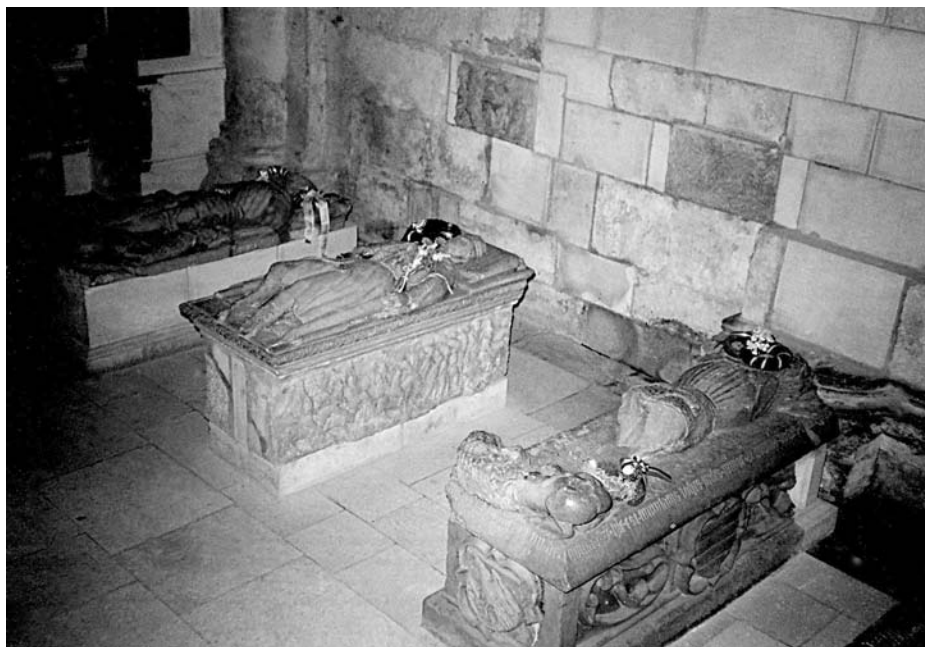
3. A Hunyadi-síremlékek jelenlegi elhelyezése a székesegyház déli mellékhajójában