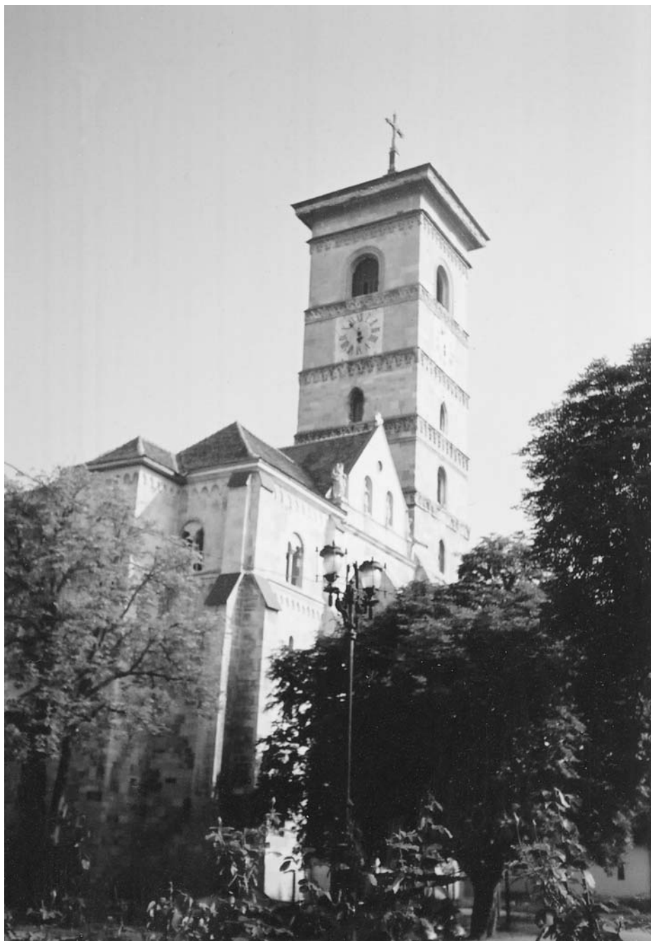
1. A gyulafehérvári székesegyház külső homlokzata