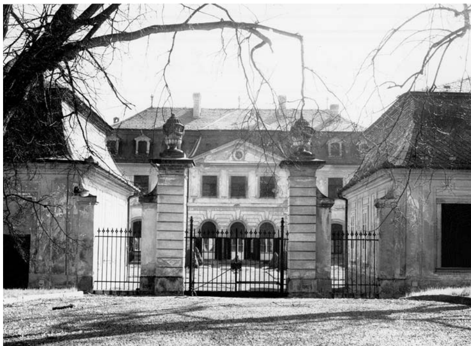
1. A heusenstammi kapuépítmény

A havas Boldogasszonynak szentelt, nem túl nagy méretű, de falusi templomként is rendkívül monumentális Wiener Neudorf-i plébániatemplom – felirata szerint – 1777–1780 között készült, Migazzi bécsi érsek (és váci püspök) megbízásából, aki Ganneval első és legfontosabb mecénásainak egyike volt (1762-ben ő kérte fel az alig másfél éve Bécsbe érkezett fiatal francia mestert a váci székesegyház építésének folytatásához új terv készítésére). A művészileg önmagában is értékes neudorfi templom művészettörténeti jelentőségét az adja, hogy Bécsben, illetve Bécs környékén a tiszta, egyértelmű klasszicizmusnak legelső példája, ugyanúgy, ahogy a váci székesegyház Magyarországon. A székesegyház azonban az 1760-as évek Magyarországra még „túl korán érkezett”, és ezért építésének idejében és közvetlenül elkészülte után környezetének építészetére alig gyakorolt hatást; a másfél évtizeddel későbbi wiener-neudorfi templom viszont – kisebb léptéke ellenére – mint minta és példa azonnal magára vonta a kortársi művészeti közvélemény figyelmét. Három arisztokrátáról is tudunk, akik lerajzoltatták (ketten rögtön a fölszentelés utáni évben, 1781-ben), mert saját építkezéseikhez mintaként kívánták felhasználni, 11 s viszonylag bőven említik az egykorú, illetve alig későbbi nyomtatott források is. 12