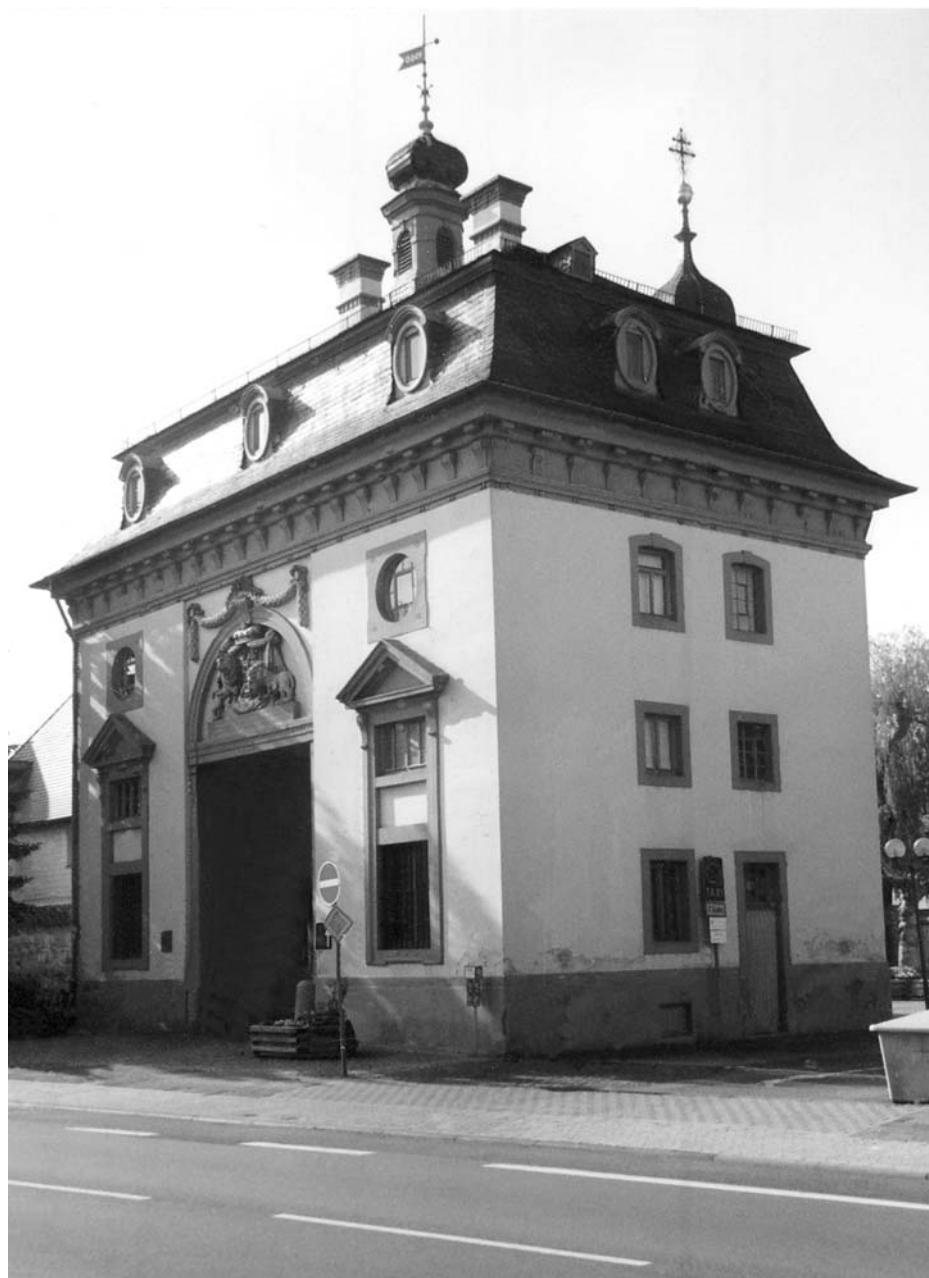
2. Náměst na Hané, Harrach-kastély