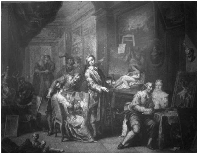
4. Franz Christoph Janneck: Festőműterem. Angol magántulajdonban