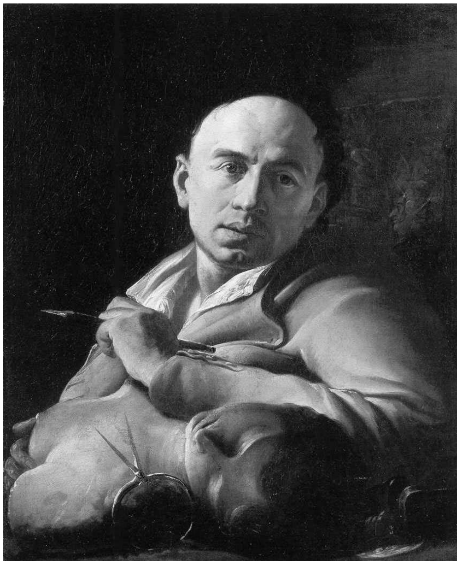
7. Paul Troger: Georg Raphael Donner, 1728 körül. Bratislava, Galéria Mesta Bratislavy