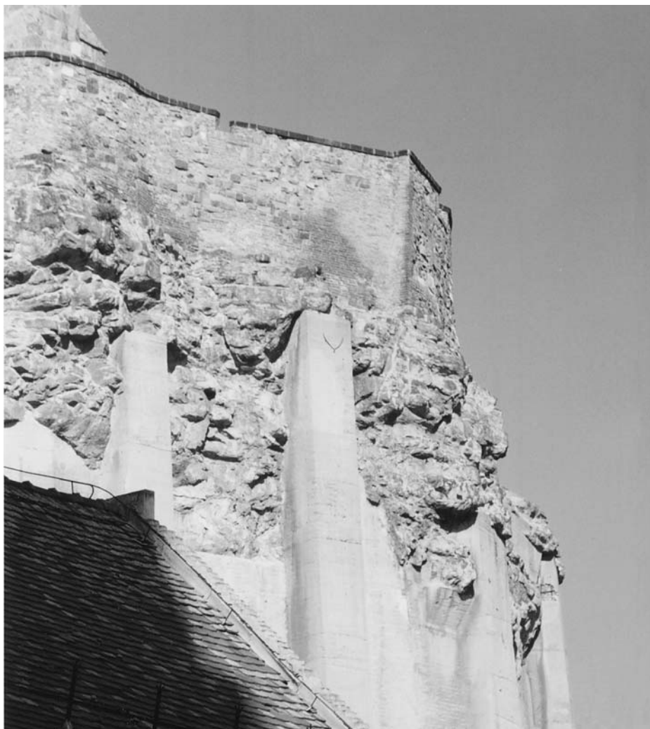
1. Esztergom, a Várhegy sziklái délnyugatról

nevezetes – s más összefüggésben Leonardo által is követett – helye a fantáziáról, amelyet ő a horatiusi ut pictura poesis értelmében tekintett a festő és a költő egyenrangúságát bizonyító tényezőnek. A természettanulmányok és a fantázia összefüggésére vonatkozó, nehezen lefordítható kifejezése mint ha egyenesen tárgyunkra vonatkoznék: azt tanácsolja a festőnek, hogy vadásson, kutasson modelljeinek (itt a nehéz naturali szerepel) árnyékában. 11 Cennini azonban – előlegezve a manierizmus fogalmának egyik lehetséges