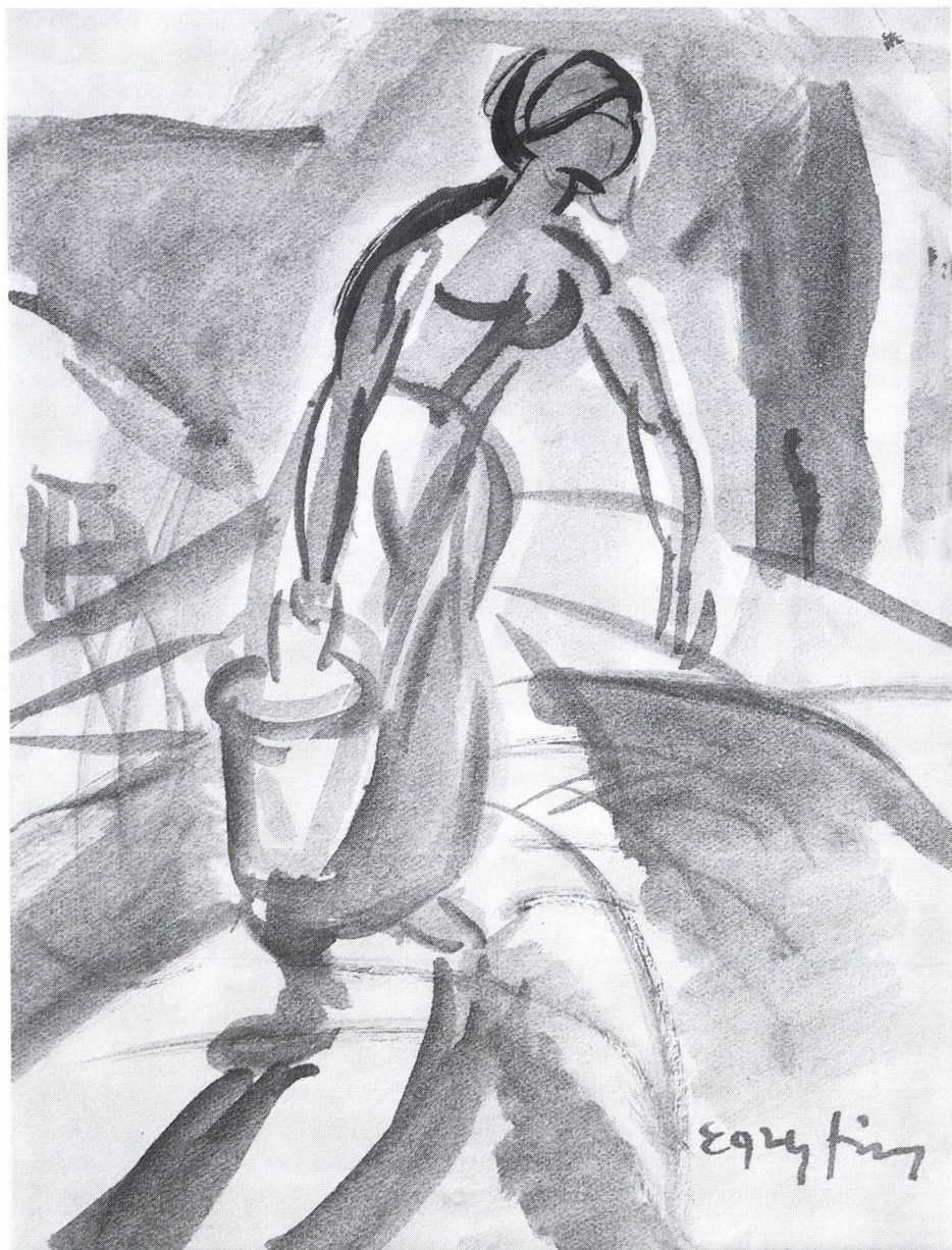
Egry József: Vizhordó nő, 1920-as évek (MNG, korábban Genthon István gyűjteményében)