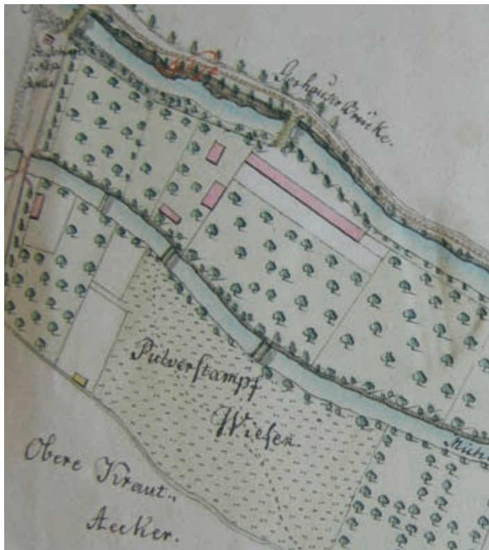
8. kép. A Gyöngyös patak partját ábrázoló térkép részlete, Karl Schubert, 1826.

saját kert is tartozott. Ez a külvárosi 120. számot viselő telek nem azonos a későbbi Bogyay-ház általunk vizsgált telkével; attól kettővel arrébb, északra helyezkedik el. A rajta álló, még a 20. század elején is virágzó, akkor Újfürdőnek nevezett létesítményt feliratával együtt ábrázolja az 1838–1839. évi telekkönyvi térkép 15 . (7. kép) Arra, hogy öt év alatt a fürdő mellé Gerhauser egy egész kis szóra-