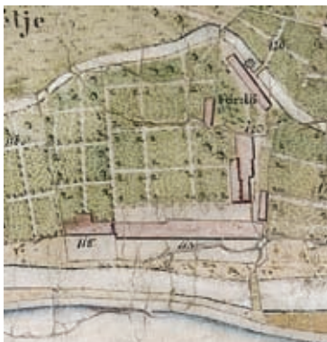
7. kép. Az 1838-1839.évi telekkönyvi térkép részlete az épületegyüttessel (Városi Múzeum, Kőszeg)