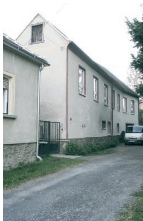
4. kép. A Gyöngyös patak felőli homlokzat délről.

középrészén, alul a két széles, kosáríves záródású nyílás fölött kerek oszlopokkal tagolt, egykor nyitott tornác húzódott. A kezdetben szabadon álló oszlopokat ma már nem létező árkádívek kötötték össze, a homlokzatot pedig háromszögű timpanon koronázta. 9 Lebontásuk miatt a homlokzat emeleti része csökkent és értelmetlennek hat, a tornác fölötti kontyolt tetőszakasz pedig furcsán és