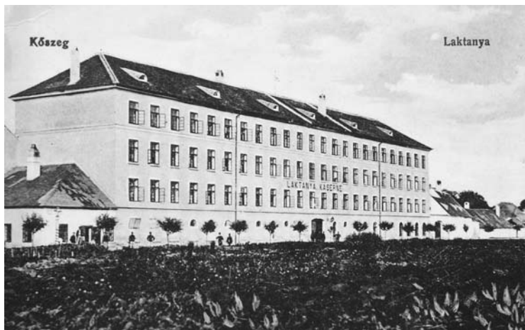
1. kép. A gőzmalom kaszárnya a 19. század végén. BOROVSKY (1898) nyomán.

Eleinte tartós letelepedésre gondolhattak, erre utal a nem csekély, 15 ezer koronás vételár, amit valószínűleg Katica anyai (Lenhossék Georgina † 1894. augusztus 30.) örökségéből fizettek ki. Az emeletes házhoz „melléklak”, gazdasági épület, továbbá több mint 800 négyszögöl nagyságú, zárt belső kert, illetve udvar tartozott. 2 A Gyöngyös partján, a pataknak háttal épült ház akkoriban a Kaszárnya utca 12. számot viselte. Nevét az utca onnan kapta, hogy a városi telken létesült első kőszegi