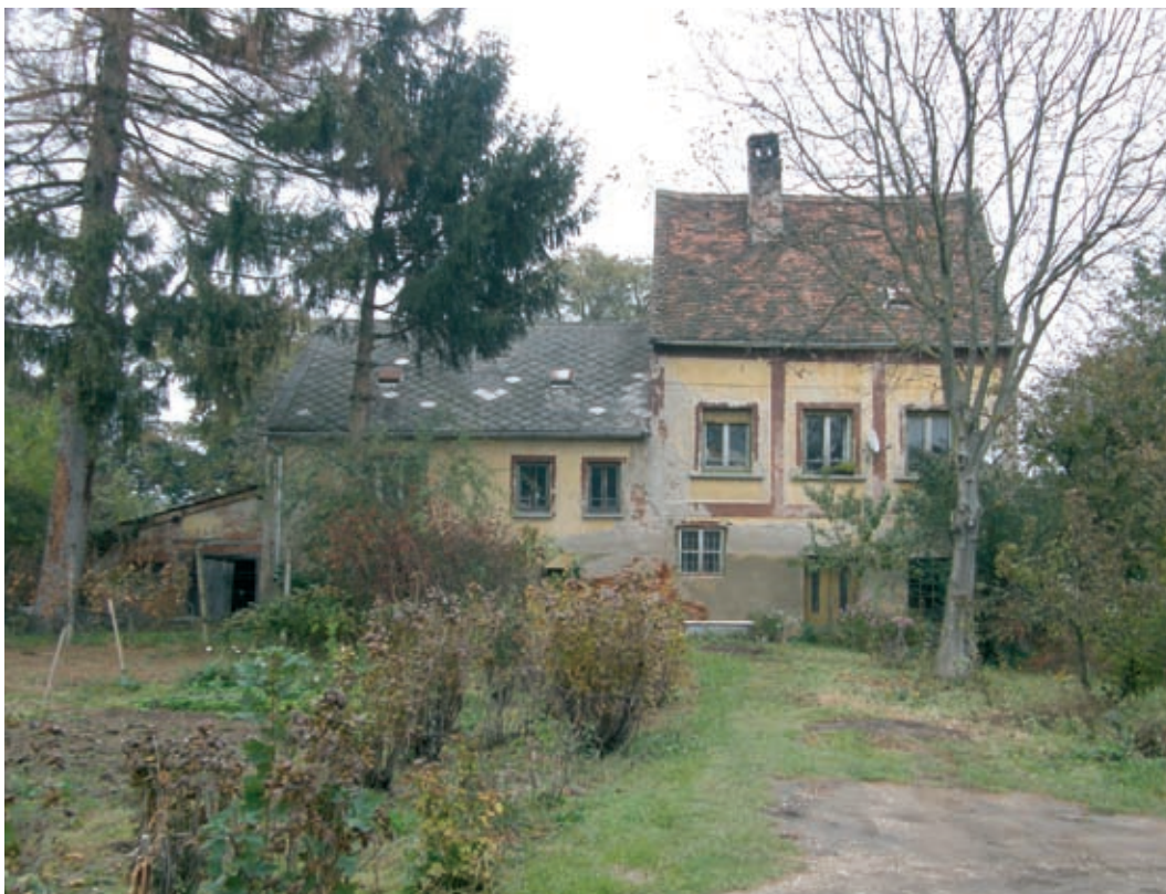
11. kép. Az egykori part menti fogadó átépített maradványa