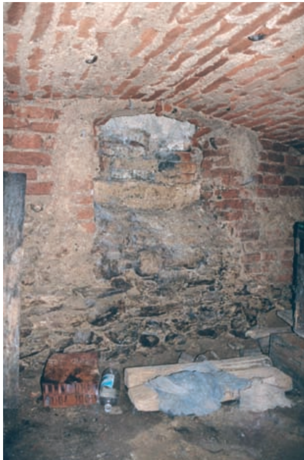
2. kép. A pincében megfigyelhető terméskő falak.