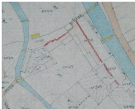
10. kép. Az épületegyüttes az 1882. évi térképen, részlet