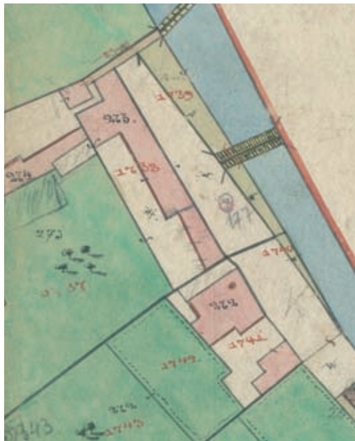
9. kép. Az 1857. évi kataszteri térkép részlete.

Ami a szabadon álló, modern „villát”, a fürdőt és a közöttük elhelyezkedő, nagy telket illeti, több térképpel is rendelkezünk a 19. század első feléből, illetve közepéről. Feltűnő, hogy a lakóépületet még sem az 1819. évi úgynevezett postakocsitérkép, sem az 1826-ból fennmaradt, Karl Schubert városi rajztanár által a Gyöngyös patak partjáról készített, színezett térkép (8. kép) nem ábrázolja. Annak ellenére, hogy, mint láttuk, éppen 1819-ből már biztos forrással rendelkezünk Gerhauser saját házáról, amely először csak a házszámozást rögzítő 1838/39. évi telekkönyvi, később az 1857. évi kataszteri (9. kép), majd az ezen alapuló 1882. évi térképen (10. kép) jelenik meg, tegyük hozzá, egymástól némiképp eltérő alaprajzzal. Mindenesetre a 19. század elején, az emelettel párhuzamosan már felépül a tulajdonos saját használatú istállója és vele együtt a kocsiszín a ház északi oldalán. A telek alsó, déli végén mindhárom alkalommal feltűntetik az egyelőre ismeretlen funkciójú, eredeti formájában ma már nem létező, földszintes „melléklakot”. 17