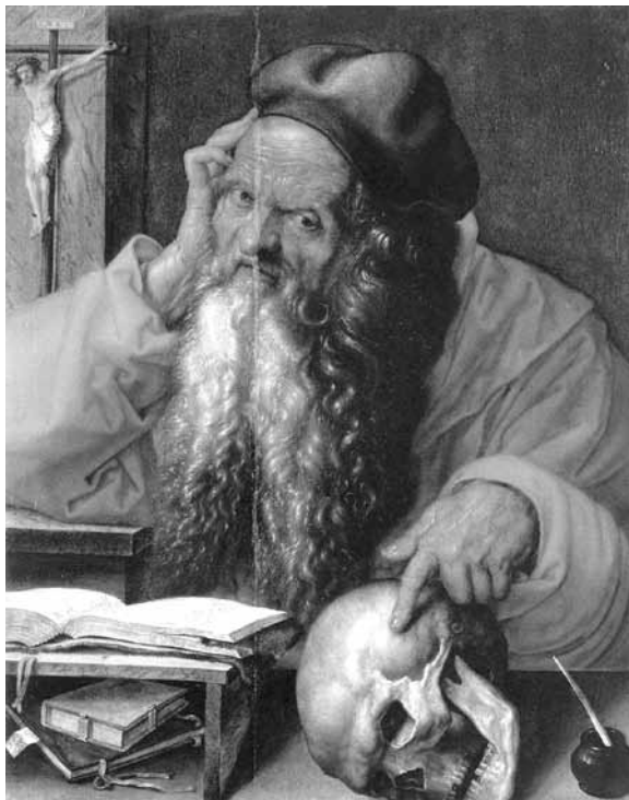
6. kép. Albrecht Dürer: Szent Jeromos , 1521. Lisboa, Museu Nacional de Arte Antiga

Összefoglalva: a Mindenszenteknek dedikált templom kórusának homlokzatán Ghirlandaio Szent Jeromosa már a Mennyből tudósít a szentek földöntúli boldogságáról és arról, hogy a szellemi munka üdvözít. Botticelli elragadtatott Szent Ágostonja veszi üzenetét; itt az ideje, hogy mi is olvassunk beszédes tekintetéből.