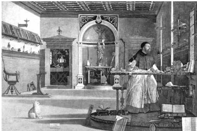
3. kép. Vittore Carpaccio: Szent Ágoston első látomása, 1502–1508. Velence, Scuola di San Giorgio degli Schiavoni

ját nem látja, de hallja a fényvel érkező hangját. Ghirlandaio nem neki, hanem a nézőnek mutatja meg e fény és hang forrását. Jeromos mivelünk keresi a szemkontaktust. A mi megvilágosodásunkért fohászodik a feje fölé vésett fohász. A mi megváltásunkra utal a mögötte levő felső polcon