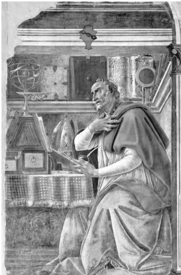
2. kép. Sandro Botticelli: Szent Ágoston első látomása, 1480. Firenze, Chiesa di Ognissanti

Vajon hogyan függ össze Ghirlandaio műve az adott témával? Mi az oka annak, hogy a történet szerint éppen meghalt Jeromost a hívőre néző tudósként ábrázolta a festő? Mit sugall a szent tekintete? Ezeket a kérdéseket meglepő módon soha senki nem tette fel, pedig a kardinális legalább olyan fontos szereplője a történetnek, mint a hippói püspök, és a freskók kompozicionális szempontból teljességgel egyenértékűek. Ennek ellenére Ghirlandaio Jeromosát általában