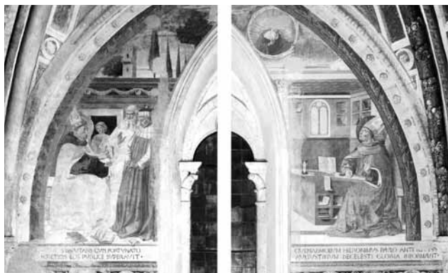
4. kép. Benozzo Gozzoli: Szent Ágoston vitája Fortunatusszal és első látomása, 1464–1465. San Gimignano, San Agostino

Mindezek alapján megállapíthatjuk: Ghirlandaio bravúros megoldása a Szent Ágoston első látomása téma egyetlen olyan ábrázolása, amelyen Jeromos helytállóan és méltóképpen szerepel. Carpaccio – amúgy a történethez híven – a halott kardinálist egyáltalán nem ábrázolja (3. kép). 15 Más esetekben az érthetőség kedvéért (de „hibásan”) Jeromos is jelen van: kisgyermek formájában, azaz lélekként, 16 vagy egész alakosan, de kisebb léptékben, angyalglóriában lebegve, 17