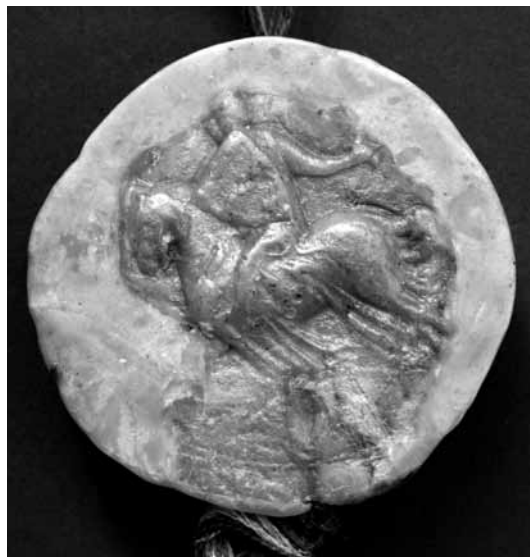
1. kép. III. András pecsétje. Österreichisches Staatsarchiv, Haus-, Hof- und Staatsarchiv, Allgemeine Urkundenreihe, 1286.VI. 6.

A kérdést tovább árnyalja András hercegnek, a későbbi III. András királynak 1286-ból fennmaradt pecsétje (1. kép). 9 Ezen egy lovaszt látunk, aki hétszer vágott pajzsot visel. Bár a lenyomat erősen rongált és kopott, de a vágásközökben látható kitüremkedésekben talán az oroszlánokat fedezhetjük fel. A pecsétet elsőként ismertető Döry Ferenc szerint ez azt bizonyítja, hogy az Imre király által felvett címer az Árpád-ház címerévé vált. 10 Megkoronázása után András ezt a pecsétet nem használta, és a IV. Béla óta használatos királyi kettőspecsétek mintájára új pecsétet vésetett, melynek hátlapján a kettős kereszt látható. Így valóban úgy tűnhet, mintha a hercegi pecsét csak a családhoz való kötődést fejezné ki.