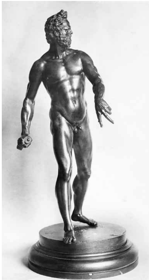
6. kép. Giambologna: Mars , 1565–1570 k., aranyozott bronzszobor, l. B. jelzéssel, M: 39,4 cm. The Collection of the Power Corporation of Canada, Montréal.