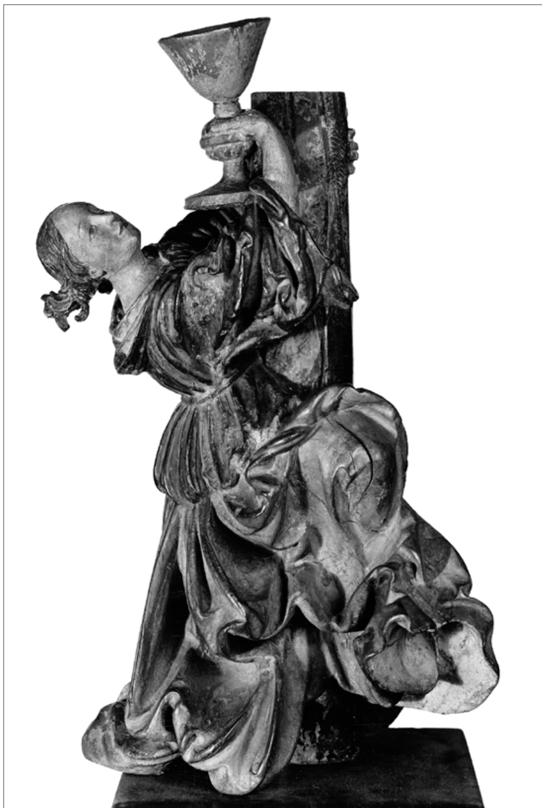
5. kép. Német művész (Hans Leinberger?): Térdelő angyal (Madonna) kehellyel , 16. század eleje, színes festett hársfa szobor, M: 46 cm