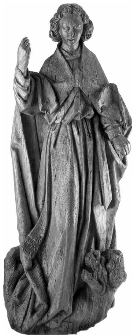
4. kép. Lille-i szobrász: Szent Mihály arkangyal , 1450–1475, tölgyfa szobor, M: 108 cm. Szépművészeti Múzeum, Régi Szobor Gyűjtemény, ltsz.50.25.

Wittmann töredékére csökkent gyűjteménye ellenére sem tett le kiállítási tervéről, mely végül 1943-ban az Art Institute of Chicago épületében valósult meg. A kamarakiállítás 43 mind a tizenegy műtárgy bemutatásra került a New York-i galériatulajdonos, Raphael Stora 44 közvetítésével, akit még párizsi műkereskedőként ismert meg a gyűjtő. A tárlatról katalógus nem készült, de Stora és a múzeum levelezésében 45 pontos leírás található a kiállított tárgyakról.