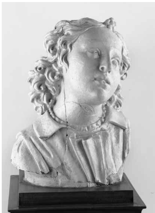
3. kép. Giovanni della Robbia (műhelye): Angyalfej , 15. század vége, mázas terrakottaszobor, M: 24 cm, Szépművészeti Múzeum, Régi Szobor Gyűjtemény, ltsz. 7374.