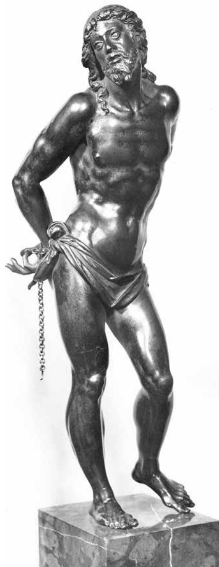
2. kép. Giambologna: Oszlophoz kötött Krisztus , 1600 k., bronzszobor, barna patina, M: 35,5 cm

„Miként már közöltem, sohasem gondoltam arra, hogy műtárgyaimat valaha is értékesíteni leszek kénytelen, – de ma, midőn