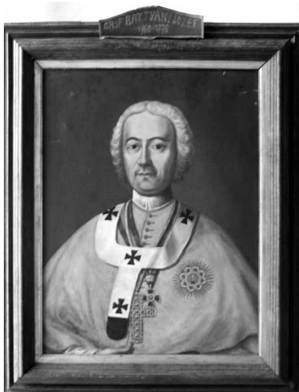
15. Batthyány József kalocsai érsek (1760–1776), Bács-Bodrog vármegye főispánja. Vászon, olaj. Daberto Félix, 1894. A zombori (Sombor, Szerbia) vármegyeháza főispáni fogadótermét díszítő főispáni portrészorozat egyik darabja. Zombori Városi Múzeum