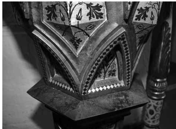
6. Daberto Félix szignója a szepeshelyi (Spišská Kapitula, Szlovákia) Szent Márton-székesegyház keresztelőkútján

hogy átalakított oltárarchitektúráikba beilleszthetők legyenek. 29 Divald Kornél szerint a székesegyház középkori szárnyasoltárai megsínylették Daberto restaurálását. 30 (5–6. kép) A szepeshelyi székesegyház felújítási munkálatainak utolsó vonásai Császká György kalocsai érseki kinevezése után utódjára maradtak.