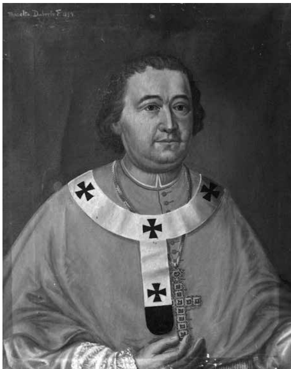
13. Csáky Miklós kalocsai érsek (1747–1751), Bács-Bodrog vármegye főispánja. Vásson, olaj. Daberto Félix, 1894. A zombori (Sombor, Szerbia) vármegyeháza főispáni fogadótermét díszítő főispáni portrészorozat egyik darabja. Zombori Városi Múzeum