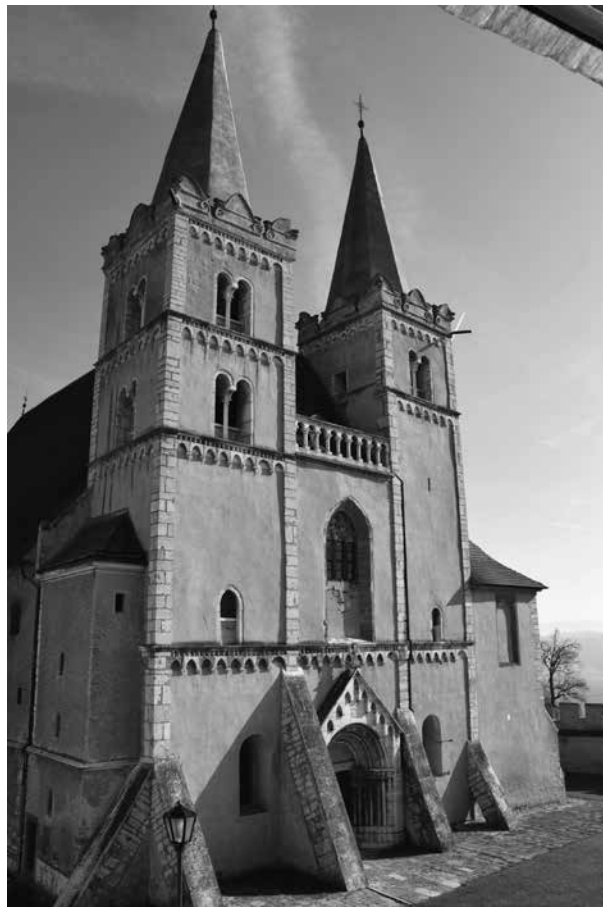
2. A szepeshelyi (Spišská Kapitula, Szlovákia) Szent Márton-székesegyház