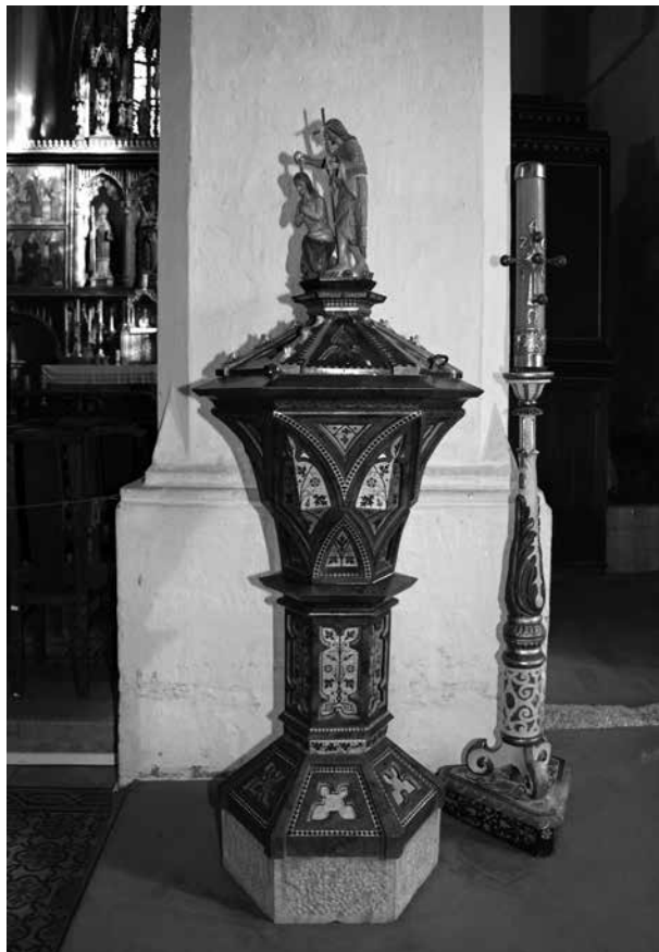
5. Keresztelőkút a szepeshelyi (Spišská Kapitula, Szlovákia) Szent Márton-székesegyházban. Díszítőfestését Daberto Félix készítette 1879-ben

északi sekrestyét. A székesegyház, valamint az északi előterem új, szőnyegmintázatos kerámiaburkolatot kapott. A belső berendezés restaurálása során 1888 áprilisában szétbontották a főoltárt. Az új, gotizáló főoltár-architektúrát Ruprich Károly budapesti asztalos készítette. A főoltár és a többi mellékoltár képeinek, illetve szárnyképeinek a restaurálását Daberto végezte. (4. kép) Mivel nemcsak a főoltár, de a mellékoltárok építményeihez is hozzányúltak, a megtisztított és átfestett szárnyképeket át is kellett méretezni (egész egyszerűen a megfelelő méretűre fűrészelték ezeket),