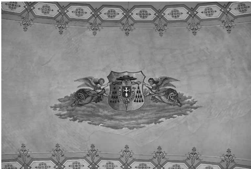
9. A zombori Szent István- (karmelita) templom mennyezeti freskójának egy részlete, melyen Császka György kalocsai érsek címere látható. A Daberto Félix festette díszítőfestés részlete

költségelőirányzat készítés céljából 2 darabot mutatványul felküldöttünk, azokat átfestésre alkalmasoknak nem találta” – írta a plébános indoklásul, hogy miért is van szükség teljesen új stációképek festetésére. 54