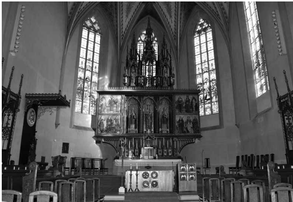
4. A szepeshelyi (Spišská Kapitula, Szlovákia) Szent Márton-székesegyház főoltára. A jelenleg is látható oltárarchitektúrát Ruprich Károly asztalos készítette, az oltárképeket Daberto Félix restaurálta

arkangyal templom egyik mellékoltárát Daberto festette Szepőlőtelen Fogantatott Mária-kép díszíti.