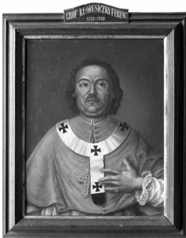
14. Klobusiczky Ferenc kalocsai érsek (1751–1760), Bács-Bodrog vármegye főispánja. Vásson, olaj. Daberto Félix, 1894. A zombori (Sombor, Szerbia) vármegyeháza főispáni fogadótermét díszítő főispáni portrészorozat egyik darabja. Zombori Városi Múzeum

kalocsai érsekek portréi. Ezek a képek a szintén ezt a címet viselő, világiakról készült darabokkal együtt a főispánokat megörökítő portrészorozat részét képezték. (11–15. kép)