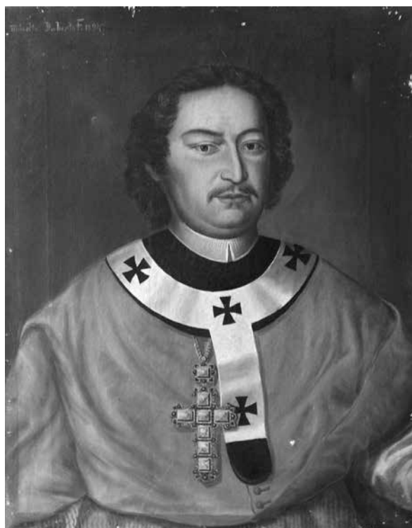
12. Patachich Gábor kalocsai érsek (1732–1745), Bács-Bodrog vármegye főispánja. Vásson, olaj. Daberto Félix, 1894. A zombori (Sombor, Szerbia) vármegyeháza főispáni fogadótermét díszítő főispáni portrészorozat egyik darabja. Zombori Városi Múzeum

mi lett a sorsa Császká György Szalai Imrétől kapott másolatának. Az sem ismeretes, hogyan juthatott a Daberto készítette akvarell a Magyar Nemzeti Múzeum tulajdonába. Feltételezhető, hogy erre Császká érsek halála után, a hagyatékházhoz tartozó ingóságok 1905. június 5–7. közötti árverésekor kerülhetett sor. 77 A Daberto-féle másolat szerepelt az Iparművészeti Múzeum 1938-as kiállításán. 78 (10. kép)