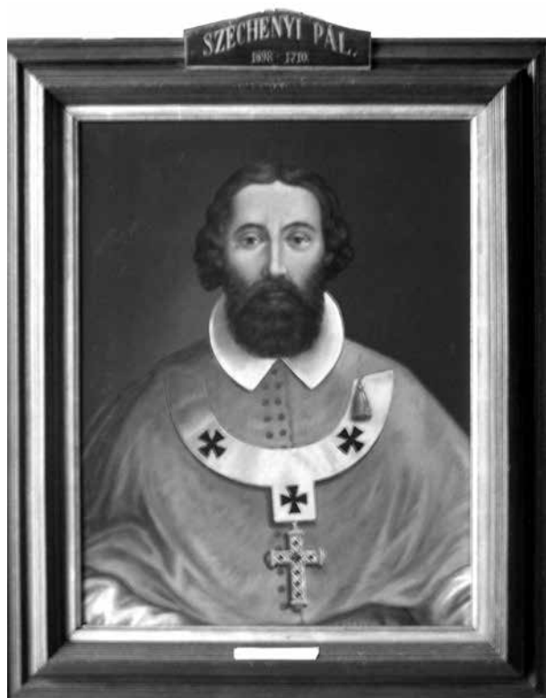
11. Széchényi Pál kalocsai érsek (1698–1710), Bács-Bodrog vármegye főispánja. Vásson, olaj. Daberto Félix, 1894. A zombori (Sombor, Szerbia) vármegyeháza főispáni fogadótermét díszítő főispáni portrészorozat egyik darabja. Zombori Városi Múzeum