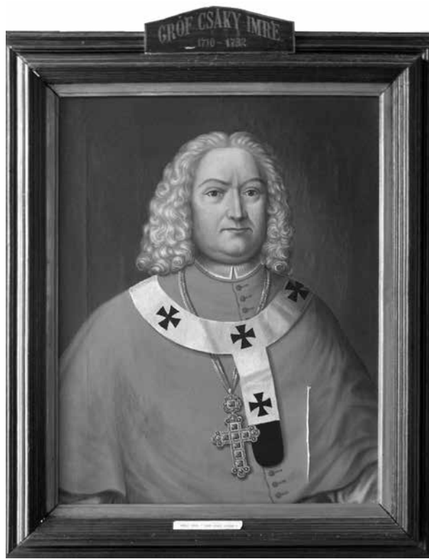
16. Csáky Imre kalocsai érsek (1710–1732), Bács-Bodrog vármegye főispánja. Vászon, olaj. Daberto Félix, 1894. A zombori (Sombor, Szerbia) vármegyeháza főispáni fogadótermét díszítő főispáni portrészorozat egyik darabja. Zombori Városi Múzeum

gyűjtésének igényét tovább erősítette a Magyarország ezeréves fennállását középpontba helyező, 1896-ra tervezett ünnepségek lázas szervezőmunkája is.