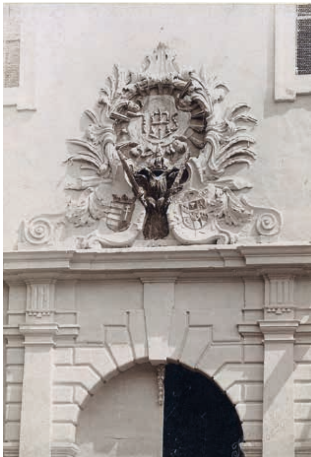
4. A pozsonyi jezsuita templom kapuoromzata. Körper Károly felvétele, 1900 körül Pozsony, Múzeum mesta Bratislavy, Fényképtár, Itsz. 200

gátásával az orsolyiták kapták meg a másik evangélikus templomot, amelyet 1672-ben szintén katolizáltak. Ugyancsak 1676-ban, I. Lipót támogatásával a kapucinus rend is megtelepedett Pozsonyban, s a Mihálykapu utcai Szent Katalin-kápolnát vették használatba.