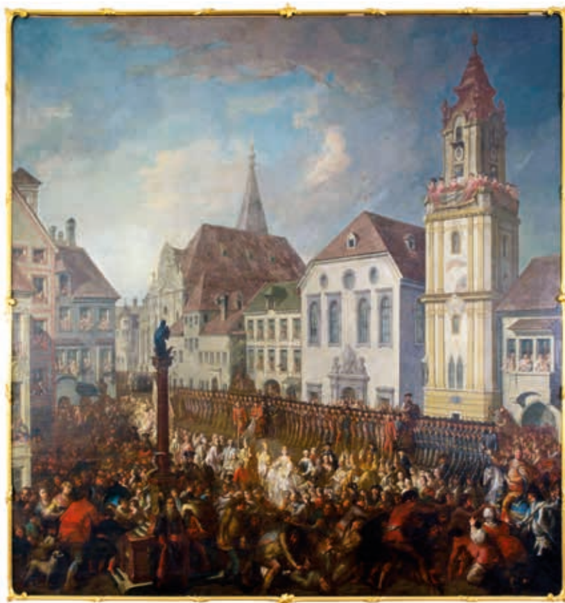
6. Franz Messmer–Wenzel Pohl: Mária Terézia koronázási menete , 1768 Bécs, Magyar Köztársaság Nagykövetsége (részlet)