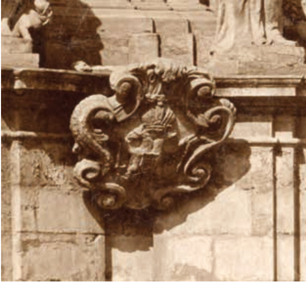
8. Kétféjű császári sasos kartus a budai Szentháromság-oszlop talapzatán. Klósz György felvétele, 1890 körül (részlet) Budapest, Budapesti Történeti Múzeum, Kiscelli Múzeum, Fényképtár, ltsz. 26625

város egységét is. A Szeplőtelen Szűz szobrának jelenléte tehát jelképesen (re)katolizálta és mintegy szakralizálta a teret és a várost. Az 1675. évi Litterae Annuae a Mária-oszlopot a hittérítés hatékony eszközeként mutatja be: a forrás szerint az evangélikusok kezdetben gúnyolódtak a Mária-szobron, később azonban egyre inkább tisztelni kezdték azt. 41