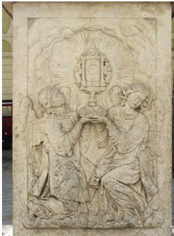
3. Monstranciát tartó angyalok az oszlop talapatán

gainak 1672. januári jegyzékében ugyanis szerepel egy közel 25 kg súlyú, 1260 forintra becsült oltár. 4 Ugyanez az oltár egy 1669-es sárvári inventáriumban is szerepel: eszerint a relief a Pietät -t ábrázolta, fölötté az Atyával és a Szentlélek galambjával, körben az Arma Christit tartó angyalokkal. 5 Az ezüstoltár ikonográfiája tehát jól illeszkedett a templom Szent Szalvátor patrocíniumához, s ez lehetett az oka annak, hogy az uralkodó a pozsonyi jezsuitáknak adományozta azt.