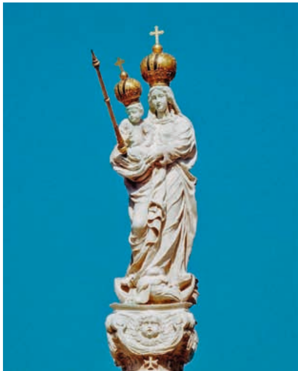
5. A Szeplőtelen Szűz szobra a győri Mária-oszlopon, 1687

Mária-oszlop donátoraként. 12 A talapzat hátsó oldalán látható magyar címer ugyancsak I. Lipót magyar királyi címét hangsúlyozza.