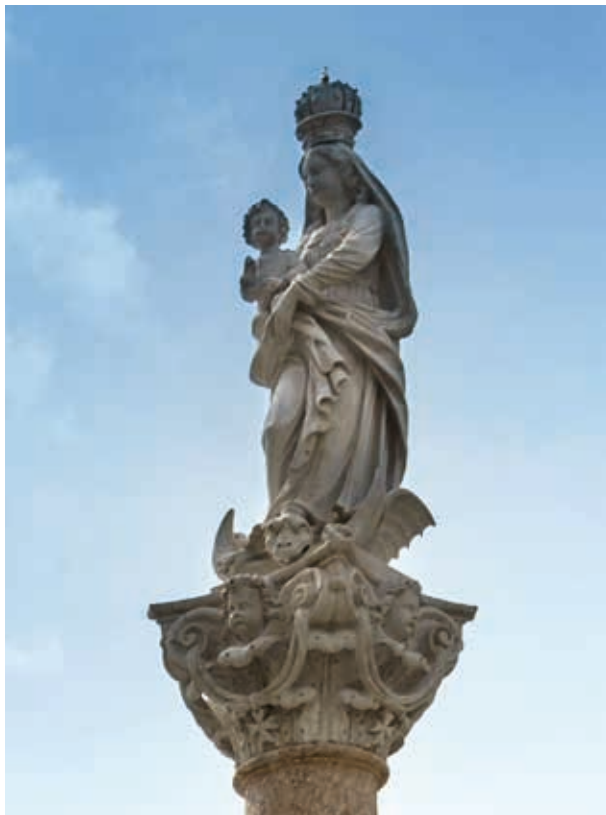
2. A Szeplőtelen Szűz (Győzedelmes Immaculata) szobra, 1675