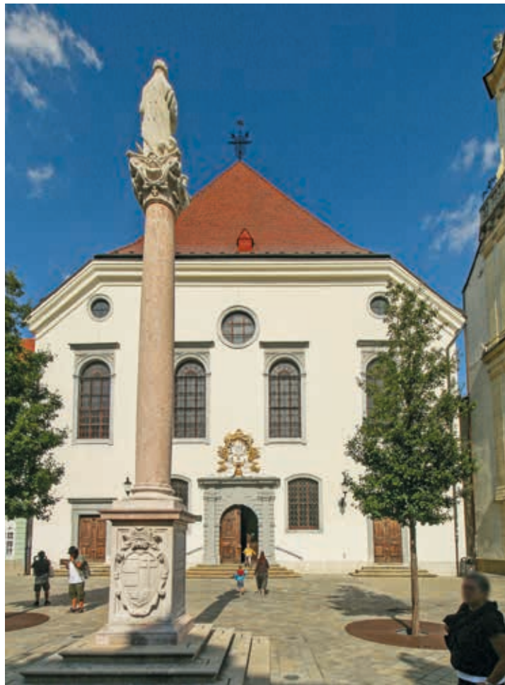
1. A pozsonyi főtéren (ma Františkánske námestie) álló Mária-oszlop, 1675

A Wesselényi-féle összeesküvés leleplezése (1670) után kialakult belpolitikai helyzetet kihasználva a bécsi udvar és a magyar katolikus egyház rendkívül intenzív rekatolizációba kezdett Pozsonyban, ami a város szakrális térstruktúrájának átalakulásában is megnyilvánult. Ennek első lépése az volt, hogy a városban már 1608-ban letelepített, ám önálló templommal nem rendelkező jezsuita rend 1672-ben megkapta a főtéri evangélikus templomot, amelyet a császári katonaság erőszakkal vett el az evangélikus gyülekezetétől.