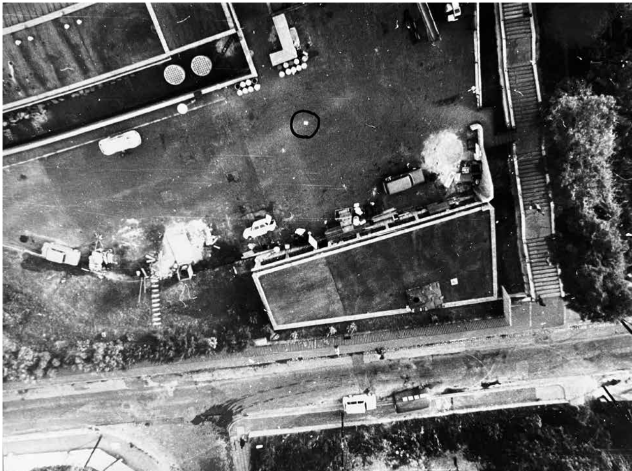
7. Szentjóby Tamás: Budapesti légifelvétel egy New York-i légifelvételről , 1973 Fotó, 18,3 × 23,9 cm. A művész tulajdona

aki egy „Fényképezni tilos!” tábla fotóját (1974) készíti el, és tekinti műalkotásnak (8. kép). 36 A leírás azonban ezekben a konceptuális művészeti esetekben lényegében már esztétikai értelmezés, a közlés, azaz a publikálás pedig pozitív etikai állásfoglalás Szentjóby és Erdély demokratikus és antitotalitárius politikai „filozófiája” mellett.