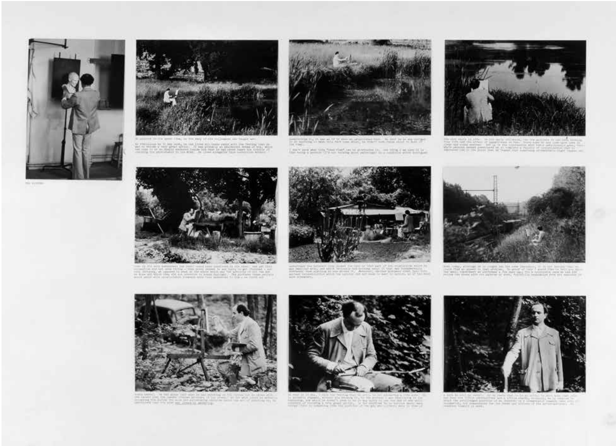
5. Jean Le Gac: A festő , 1974 Fényképek, gépirat, egyenként 21 × 29 cm Magántulajdon

és módszereik ellenére mind a négy új művészetben kitüntetett szerepet játszik a fotográfia, hiszen különféle időbeli és térbeli folyamatokat és tevékenységeket képeznek le, melyeket fotografikusan dokumentálnak. Beke azonban a fotográfiai leképezés komplex jellegének is fontos, jelentésalkotó szerepet tulajdonított. Ezért is különbözteti meg tanulmányában a fotográfia különféle „funkcióit”: dokumentatív, mágikus, reprodukív, metaforikus, melyek – a struktúraanalízis felől nézve – egyaránt rendelkeznek szó szerinti, allegorikus és spirituális jelentéstartományokkal.