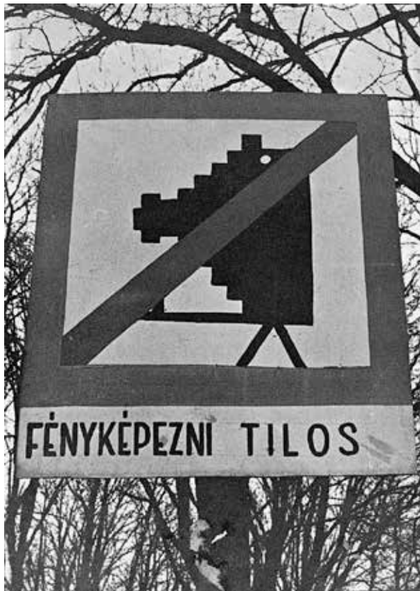
8. Erdély Miklós: Fényképezni tilos! 1974 Erdély Miklós hagyatéka, Fom 33/b

ettől eltérő (legyen az akár hivatalos, akár ellenkulturális) interpretációnak sem hagy teret. A félreérthetetlen, tökéletesen precíz értelmezés paradox fikciója is egy művészfilozófustól, Erdély Miklóstól ered, aki a szemiotika égisze alatt a spirituális telepátiát modernizálta az állapotkommunikáció 38 fogalmával. Az általa definiált állapotkommunikáció folyamata során a művész politikai és ismeretelméleti értelemben is „forradalmi” tudata a műalkotás közvetítésével, a művészet csatornáján keresztül érinti meg és alakítja át a befogadó, a néző és a hallgató elméjét.