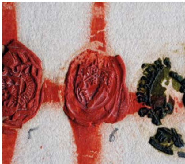
2. Györgyi Bodó Miklós prépost gyűrűspecstjének lenyomata Mátyás király Erdőháti László részére kibocsátott, 1462. május 6-án kelt kegyelemlevelén Budapest, Magyar Nemzeti Levéltár, Országos Levéltár, DL. 15719.

Az említett 1462. évi oklevelen persze Bodó Miklós nem elsősorban fehérvári prépostsága, sokkal inkább titkoskancellári méltósága miatt szerepelt. Miután 1459 februárjában a még apja életében asztalnokmesterré kinevezett Bodó Gáspárral egyetemben – utóbbi 1461-ben lett lovászmester – hűséget esküdött Mátyás királynak,