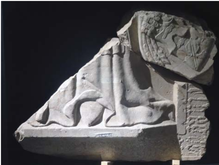
1. Györgyi Bodó Miklós prépost (†1474) sírkövének töredéke Székesfehérvár, Szent István Király Múzeum.