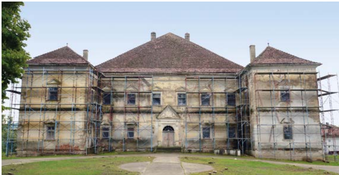
5. A kastély északi főhomlokzata