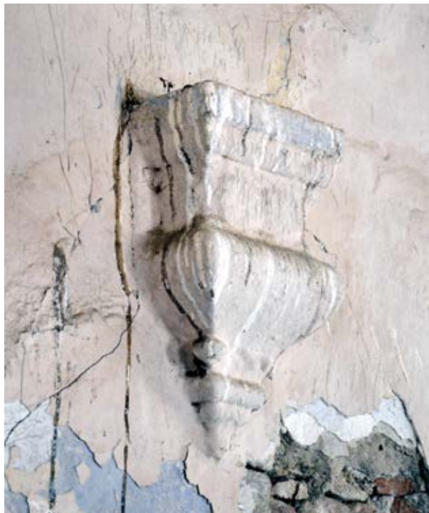
16. Konzol a kastély egyik emeleti helyiségében