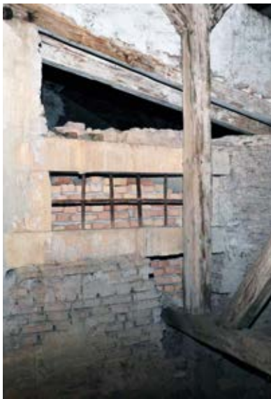
12. Kőkeretes szellőzőablak a kastély padlasterében