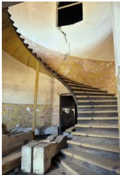
11. A kastély főlépcsője