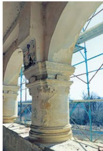
13. A kastély földszinti loggiájának tartóoszlopa

eredetileg, ahova váratlan támadás esetén az értékeket bemenekíthették. 54