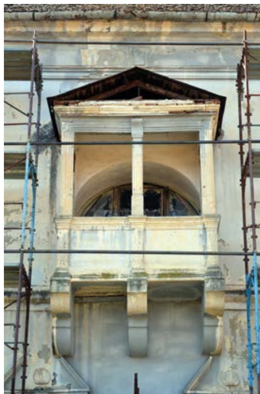
7. Zárterkély a keleti homlokzaton