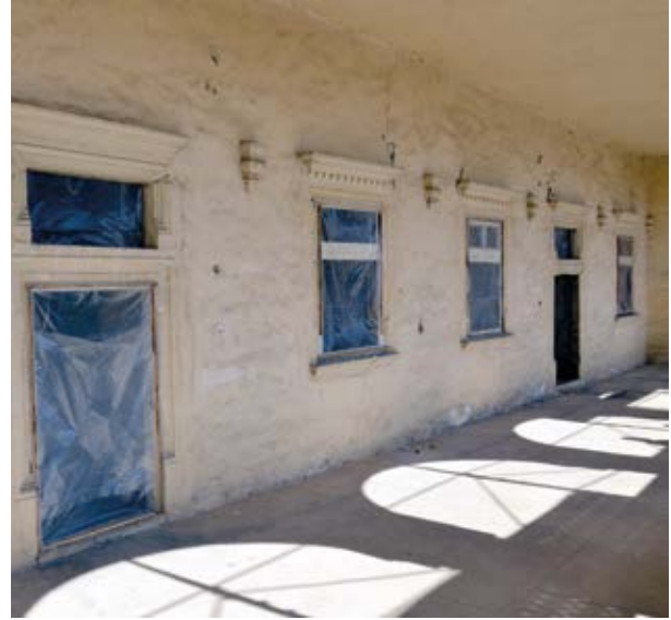
15. A kastély emeleti loggiájának belső fala