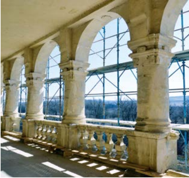
14. A kastély emeleti loggiája