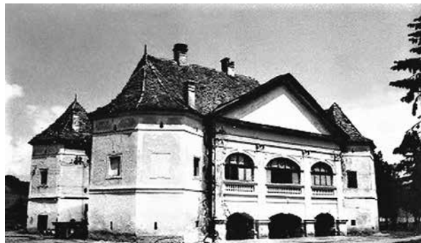
17. A kisbúni Bethlen-kastély