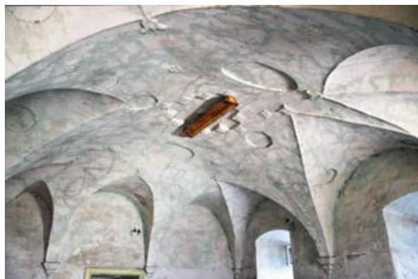
9. Stukkódíszes, boltozott helyiség a kastély földszintjén

A keleti homlokzat legszebb részlete a három kő-konzolra támaszkodó, reneszánsz zárterkély (7. kép). A lábazat fölött a nyílások felé beforduló, reneszánsz profílozású kőkeretekbe foglalt ablakok üvegszemei hiányzanak. Mellvédjét tulipános-indás faragott díszű pilaszterek keretezik. Két mellvédtábláját Bethlen Miklós és második felesége, Rhédey Júlia címere díszítette egykor. Az erkélyt eredetileg háromszögű oromzat