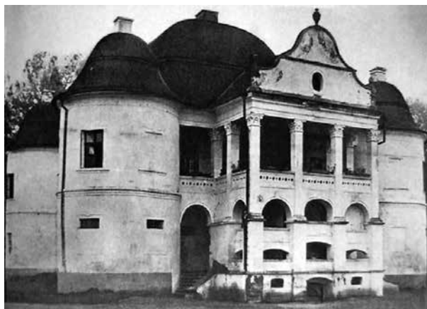
19. A bonyhai kisebbik Bethlen-kastély SAs 2011. II. 322.