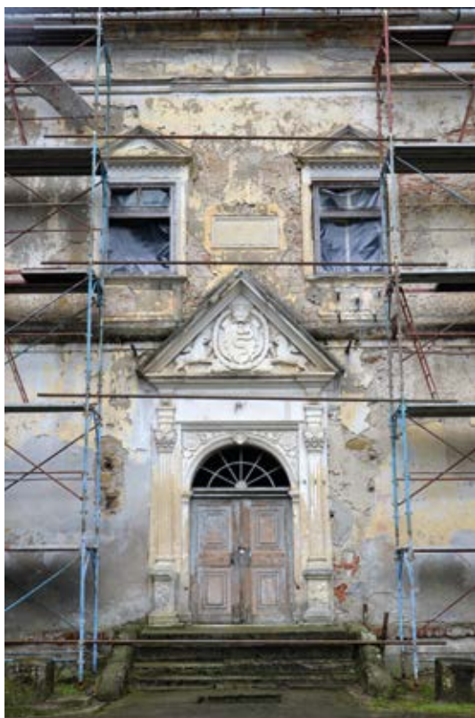
6. A kastély főbejárata az északi homlokzaton Fotó © Pakó László, 2022