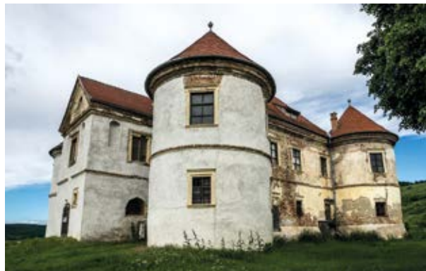
18. A magyarózdai Pekry–Radák-kastély

(1622 után), a magyarózdai Pekry–Radák-kastély (1626 és 1694 között valamikor, 18. kép) és talán a bethlenszentmiklósi kisebbik kastély is (1679 előtt?). Hasonló elrendezésű lehetett, mint a Bethlen János kancellár által 1675-ben építtetett és a két világháború között lebontott bonyhai kis kastély (19. kép). A szakirodalom az Észak-Magyarországon már a 16. század utolsó évtizedeitől elterjedt kastélytípussal szokta összefüggésbe hozni, amelynek leglátványosabb példái a vajai, pácini, kékeddi, golopi, alsómicinyei, márkusfalvi, osztrolukai rezidenciák. 65