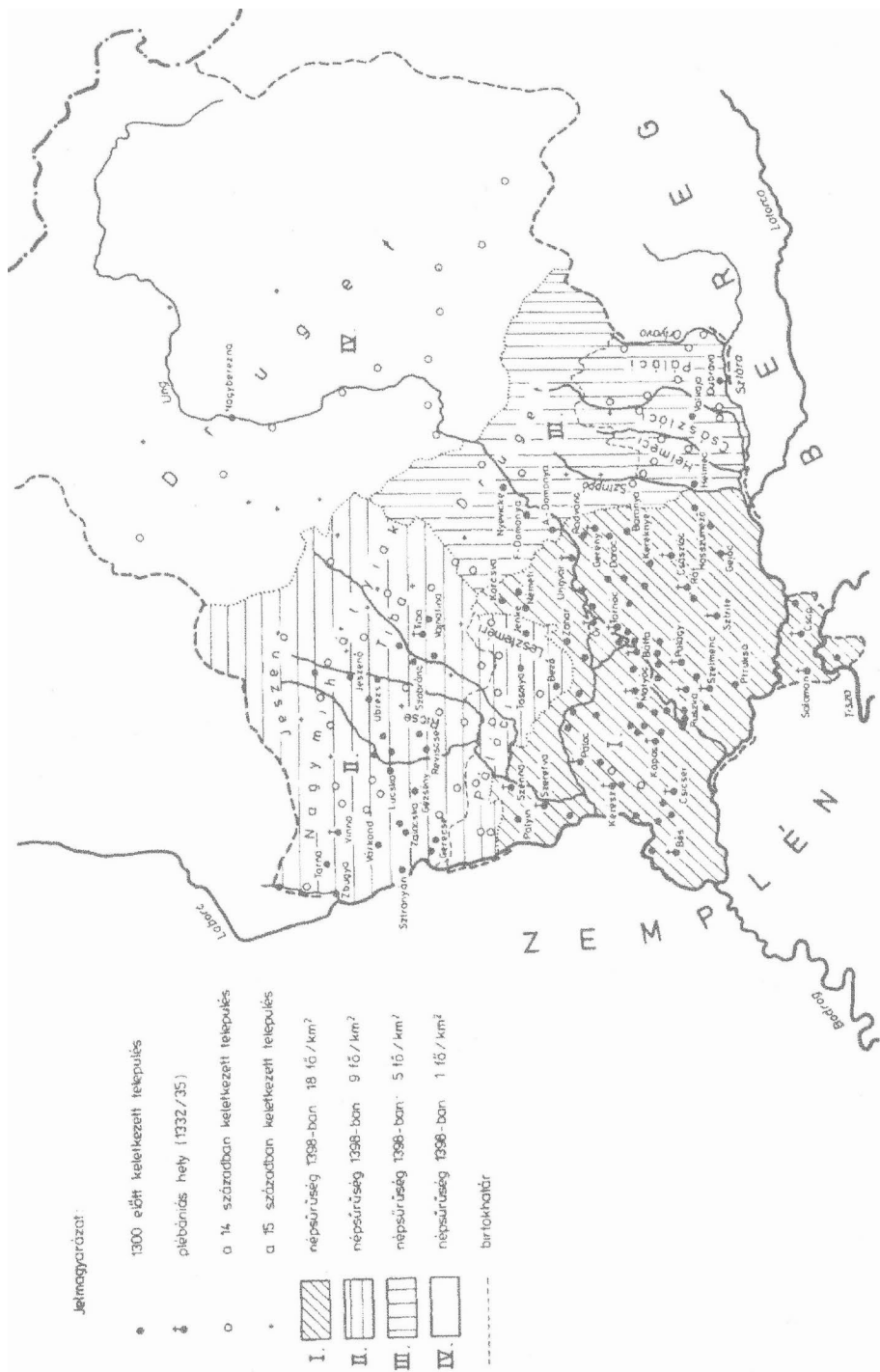
2. ábra. Ung megye települési és népességi viszonyai a XIII–XV. században (Engel, 1985/4).