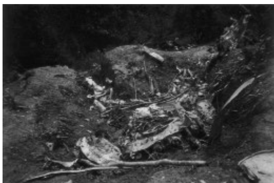
7. kép. Domby Kálmán lezuhanásának helyszíne, a becsapódás krátere a repülőgép roncsainak egy részével. A 14 hengeres, kétsoros csillagmotor és a légszűrő maradványai jól láthatóak.