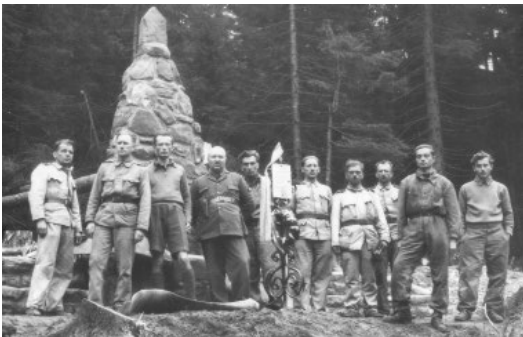
13. kép. Az Északkeleti-Kárpátokban lezuhant magyar repülőkatona emlékműve a Kökörscines (Brebenezskul)-hegyen néhány repülőkatonaival 1942. október 4-én.