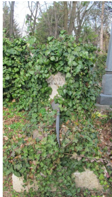
14. kép. A Domby család borostyánnal befutott sírja jelenlegi állapotában a Farkasréti temetőben (készült 2017. március 23-án).