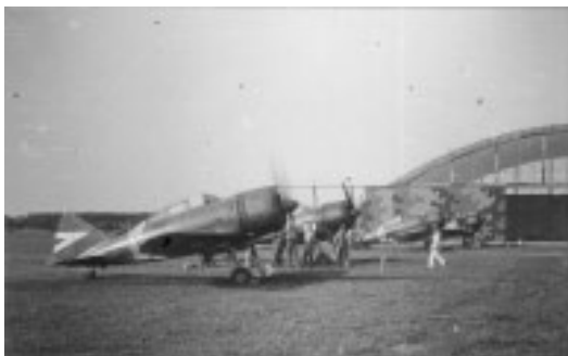
5. kép. Frissen érkezett Re.2000 Héják a szolnoki reptéren a hét gépes Re.2000 kötelék hadműveleti területre történő indulása előtt 1941 nyarán (a szerző gyűjteményéből).