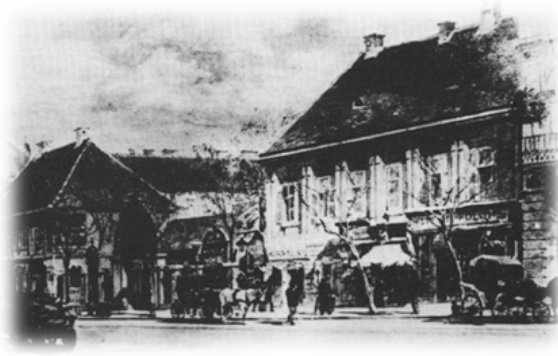
2. melléklet: Belezna-kert Kerepesi útra néző épületei