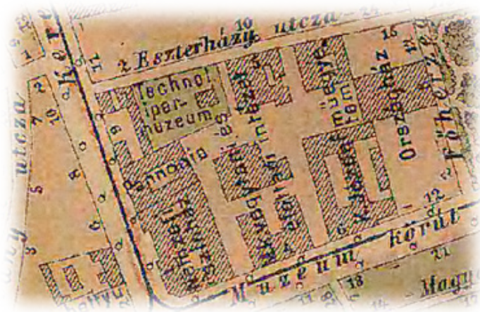
3. melléklet: Budapest belterületének várostérképe, 1885.