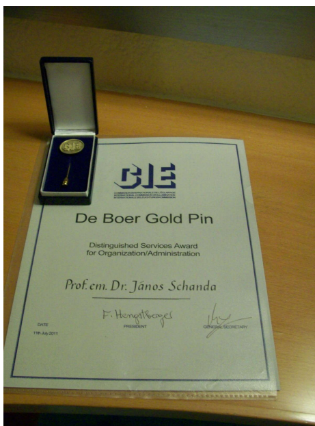
A De Boer-kitüntetés

A kitüntetettnek és az új divízió elnöknek gratulálunk és további jó egészséget, jó munkát kívánunk.