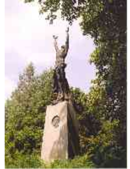
„Ember küzdj és bizva bízzál!” Madách síremléke Alsósztrégován

Ezer éve, hogy e nemzet Itt magának hazát szerzett, És ha jőne most halála A jövőd mit találna, Mi neki arról beszélne, Hogy itt hajdan magyar éle? S a világtörténet könyve? Ott sem lennének följegyezve! És ha lennének, jaj minékünk, Ezt olvasnák csak felőlünk: „Élt egy nép a Tisza táján, Századokig lomhán, gyáván.” – Oh, hazám mikor fogsz ismét Tenni egy sugárt, egy kis fényt Megrozsdásodott nevedre? Mikor ébredsz önérzetedre?