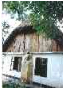
Ady szülőháza Érindszenten