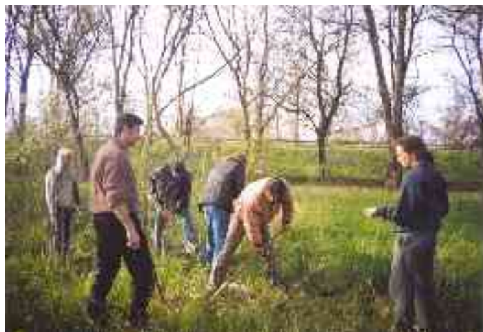
Munkában a motorosok. Köszönjük fiúk!