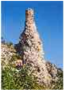
„Szabad-e Dévénynél betörnöm új idők- nek új dalaival?”