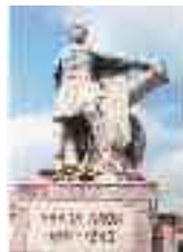
Édes rózsám a hazáért el kell válnom tőled Gábor Áron szobra Kézdivásárhelyen