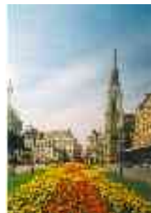
Újvidéken és Eszéken soha ne kérdezd kiért szól a harang!