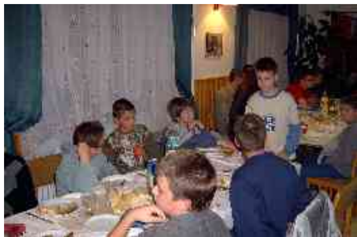
Az utánpótlás