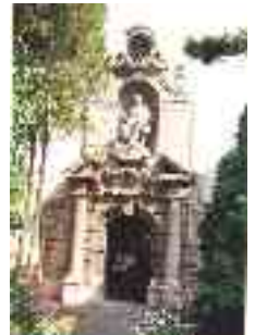
„Nagyszalonta nevezetes város” Arany Já- nos Emlékmúzeum