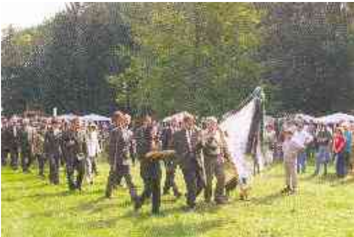
A fenti képen egy részlet látható a rendezvényről.