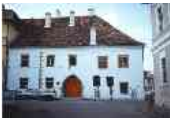
„S történetkönyv ez a város” Kolozsvár, Mátyás király szülőháza