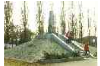
Arad, a magyar golgota. Az aradi tizenhá- rom emlékoszlopa