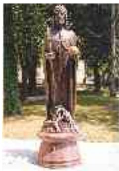
Szent István szobra Lendván

Isten segíts! népeknek Istene! Tedd jóra, munkássá e nemzetet, Hogy amihez fog óriás keze, Végére hajtson minden kezdetet. Add, hogy mit emberész és kéz kivívhat, Ne várja mástól, mint szerencsedíjat. Vörösmarty Mihály