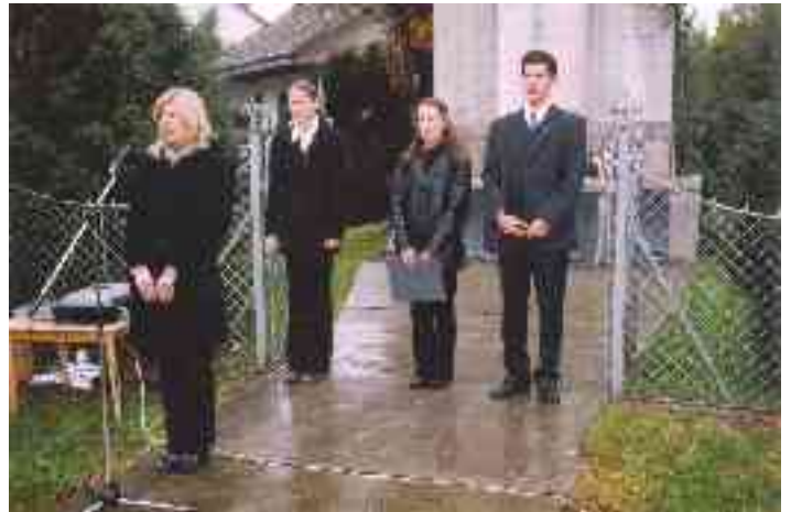
Az ünnepi műsor szereplői