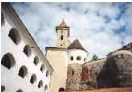
„Hol fejedelmi terem fogadott fejedelmi lakókat S küzde nemes harcot Zrínyi leánya soká: Bércedet, ó Munkács, keserű gond üli.”