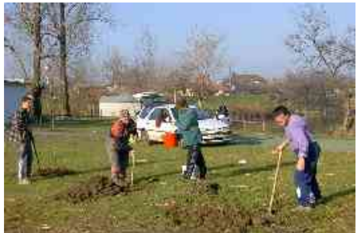
Munkában a brigád