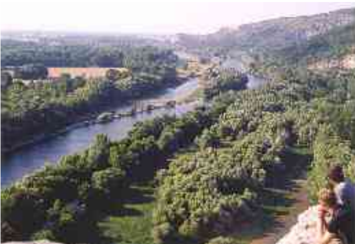
A Morva, az 1000 éves határnál

Dévény közel 2000 éves múltra tekint vissza. Fontos állomása volt a Baltikumból Rómába vezető Borostyánkő útnak. Az akkor épült őrtornyot a népvándorlás idején palánkvárrá bővítették. Kalandozó őseink búcsúpillantásait őrzik a kövek, ugyanis Dévényt tekintették az ország nyugati kapujának, Európa felől nézve ez volt a Porta Hungariae. Az erősség a századok során gyakran cserélt gazdát, volt idő amikor osztrák vagy cseh zászlót lobogtatott a szél. Nádoraink közül Garai Miklós szép reneszánsz részekkel gazdagította a várat, majd az egy évszázaddal későbbi utóda, esesedi Báthory István – aki II. Lajos nevelője volt – az 1530-ban bekövetkezett haláláig itt tölti élete utolsó éveit. 1683-ban a Bécs ellen vonuló törökök hiába ostromolták, számukra bevehetetlen maradt a sásfészek, amely ekkor már a Pálffyak kezén volt, akik közel 300 évig birtokolták.