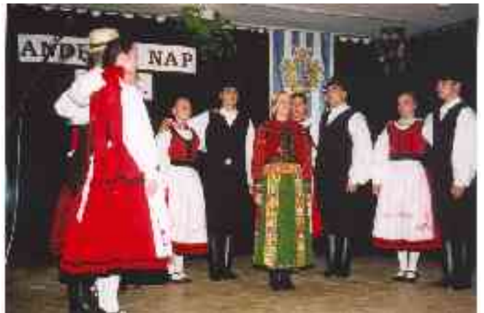
Kishegyesi Táncegyüttes műsora