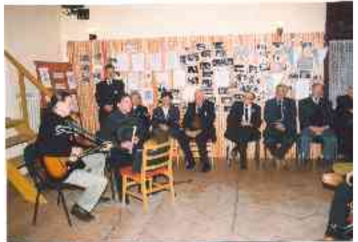
A kishegyesi megemlékezés és kiállítás

A 35 év alatt két nagy találkozó volt: az elsőt 1969-ben Kishegyesen tartották meg, amelyről a legtöbb írásos és fényképes anyag van birtokunkban.