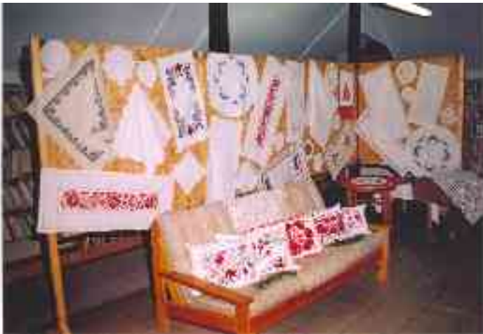
A hímző kör tagjainak munkái