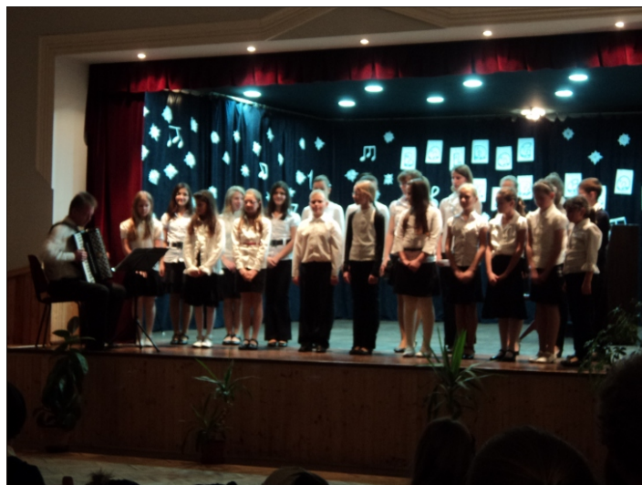
„Legyen boldog, víg a karácsony”