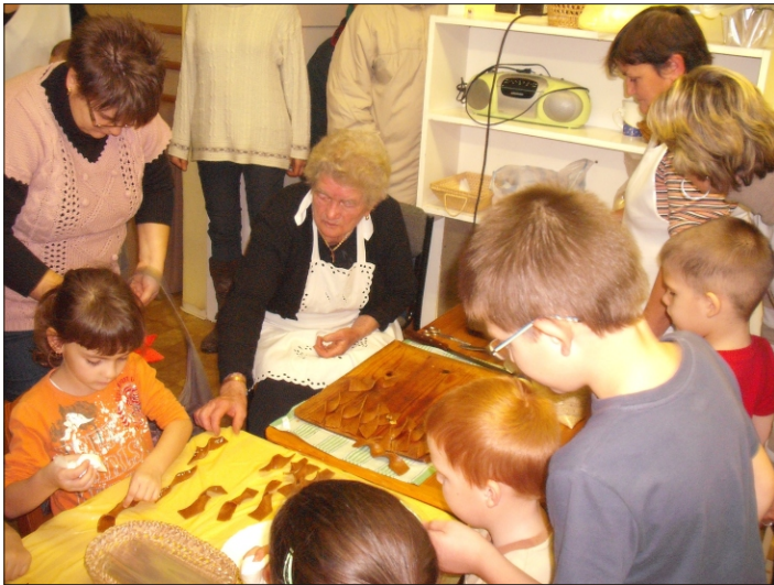
Készül a pirított dióscukor

Minden csoportban a gyermekek meglepetéssel is készülnek, amit haza vihetnek a családjuknak.