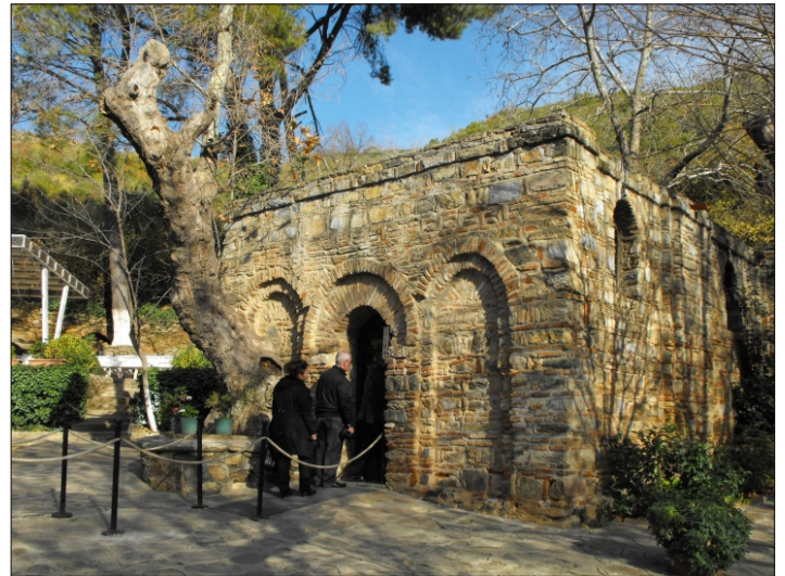
Szűz Mária szülőházánál Törökországban

Tegyünk hát egy fogadalmat, S tartsuk is be szépen - Köszöntsük az új esztendőt: Éljen, éljen, éljen!