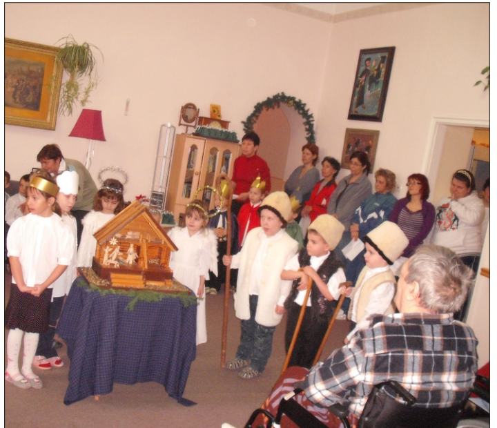
A Süni csoport az időseknél