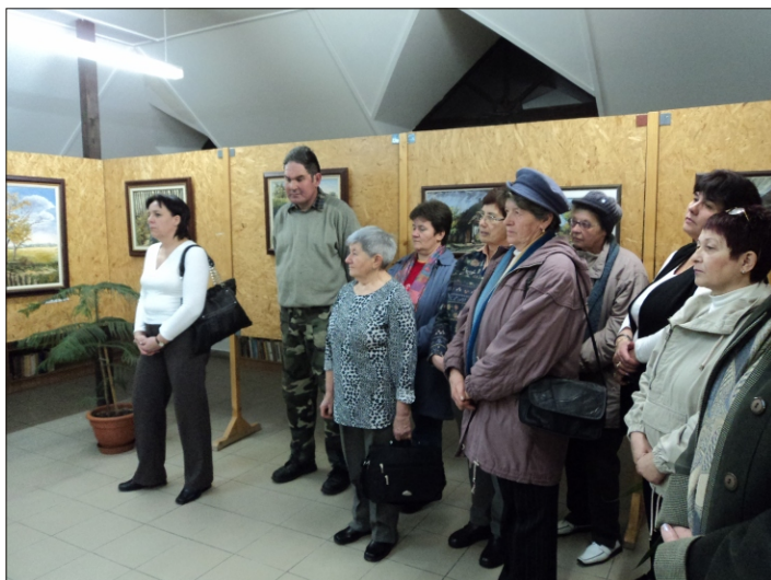
Az érdeklődő közönség