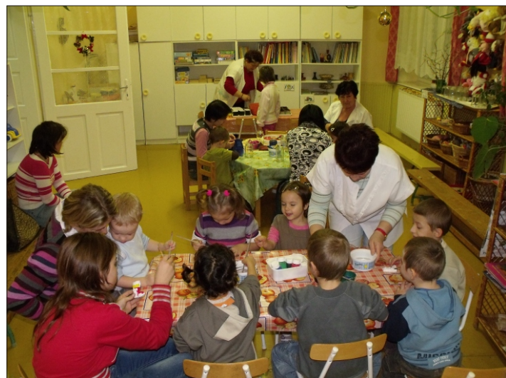
A karácsonyi játszóházban

Óvodánk hagyományaihoz híven dec. 13-án ismét megrendeztük a „karácsonyi játszóházunkat”, melyre szeretettel meghívtuk a szülőket és a testvéreket is. Az est folyamán többféle tevékenységet kipróbálhattak (Luca-búza ültetés, mézeskalács sütés-díszítés, üvegfestés, gipszfestés, ujjbáb készítés), de mégis a mézeskalács készítésnek volt a legnagyobb sikere.