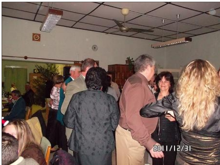
Tele a táncparkett

tombolatárgyakat, valamint a jegyvásárlást és mindazoknak, akik a rendezvény elő- és utómunkáiban társadalmi munkáikkal hozzájárultak.