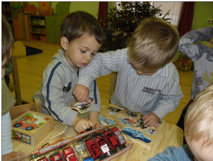
A várva várt játékok