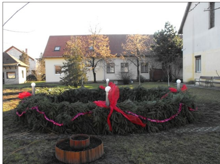
A hatalmas adventi koszorú