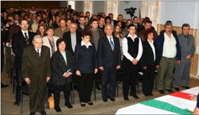
Kishegyesiek és kárpátaljaiak tették le a magyar állampolgársági esküt

„Én, ... esküszöm, hogy Magyarországot hazámnak tekintem. Magyarországnak hű állampolgára leszek. Az Alaptörvényt és a jogszabályokat tiszteletben tartom és megtartom. Hazámat erőmhöz mértén megvédem, és képességeimnek megfelelően szolgálom. Isten engem úgy segítjen.”