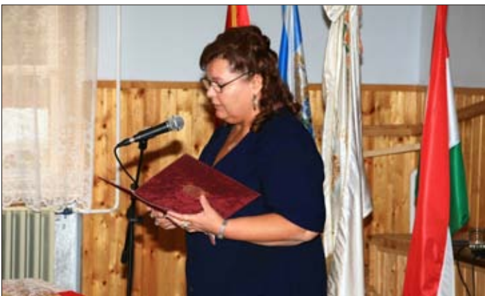
Bagi Erika, a Polgármesteri Hivatal anyakönyvvezetője vezette le az ünnepélyes eskütételt, és az alábbi Balázs Béla idézettel köszöntötte a vendégeket:

„Mert messzi út az: hazulról hazáig. Nagyobb út nincs is és egy emberélet Talán kevés, hogy megjárjad és megérkezz: Hazád álmából – álmod hazájába, Szülőföldről a szülőted földre.”