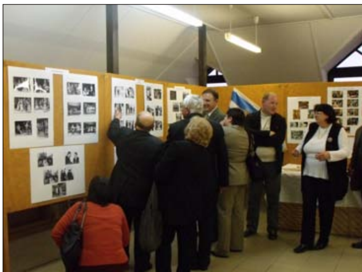
Nagy érdeklődéssel tekintették meg a jelenlévők a kiállítást