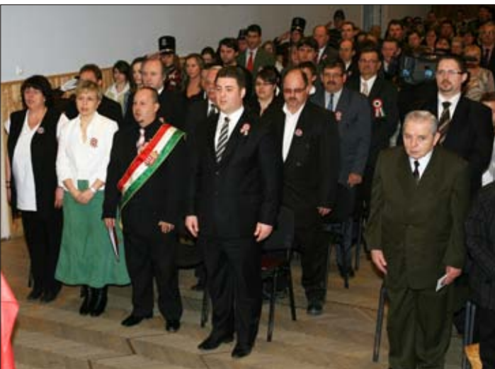
Az eskütétel előtt közösen elénekeltük a magyar Himnuszt

„Mert messzi út az: hazulról hazáig. Nagyobb út nincs is és egy emberélet Talán kevés, hogy megjárjad és megérkezz: Hazád álmából – álmod hazájába, Szülőföldről a szülőted földre.”