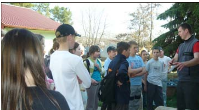
Amit a halakról tudni kell