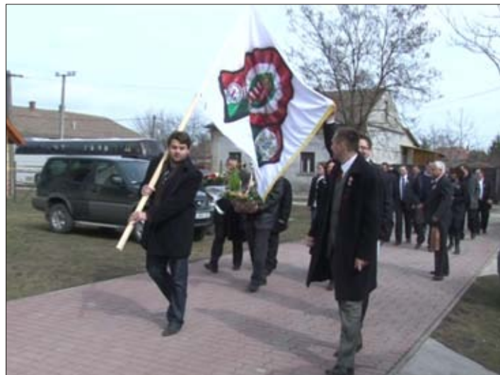
Megérkezett a kishegyesi delegáció