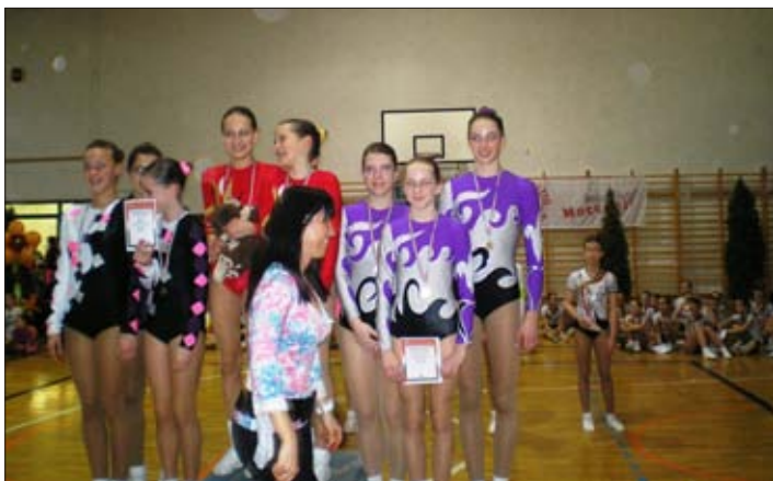
A bronzérmes trió