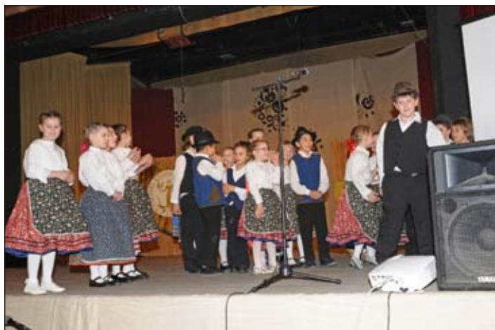
A legkisebb néptáncosok

A nap legfontosabb és legfelelőbb eseménye természetesen a koraesti órákban kezdődő ünnepi műsor volt, melyen a kitüntetett díjak átadásának a Petőfi Sándor Művelődési Egyesület néptáncosai adtak keretet a legkisebbektől a legnagyobbakig.