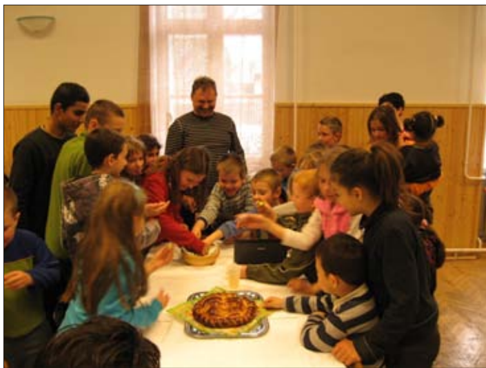
Jó válaszáért csokitojás járt