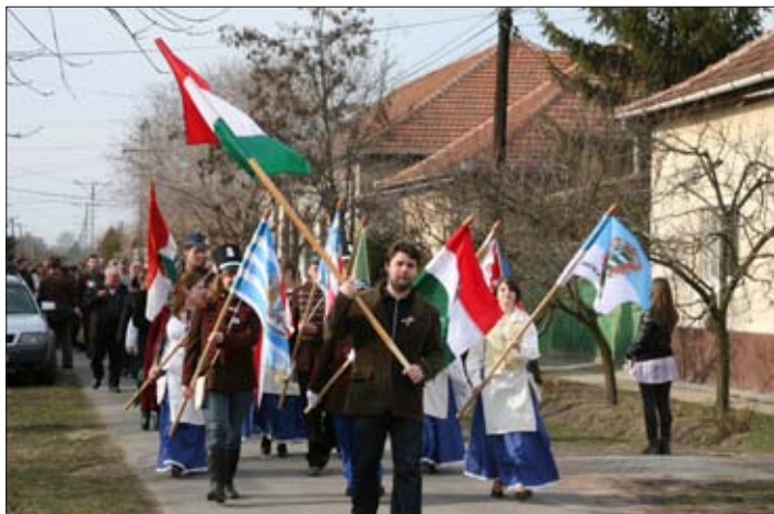
Az ünneplők sokasága vonult az utcákon