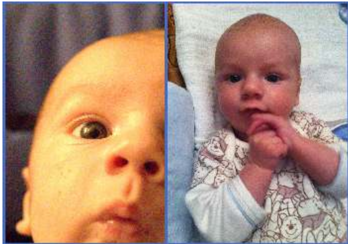
II. "A szeretet képessé tesz rácsodálkozni a másikban rejtőző végtelen szépségre és mélységre."