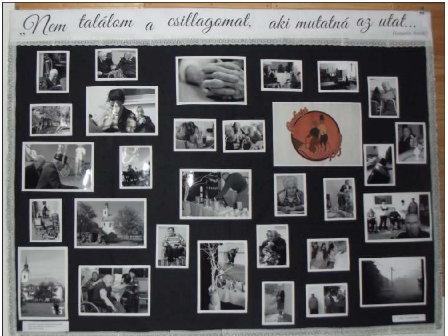
A XV. Tél-fény Fotókiállítás győztes képe