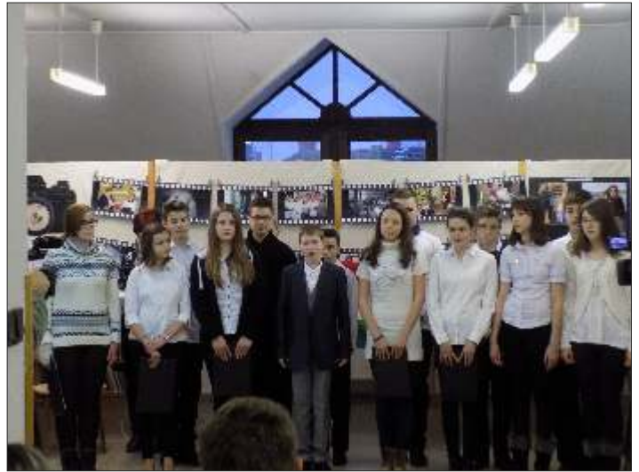
A 8. osztály ünnepi műsora

mindenkit magával ragadott és a jelenlévők együtt szavalták el Himnuszunkat, mely szintén megható pillanatot jelentett.