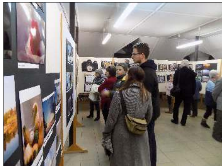
A látogatók nagy érdeklődéssel tekintették meg a szebbnél szebb fotókat

A kiállítás megnyitó a megvendégléssel, a beszélgetésekkel és a szavazással ért véget.