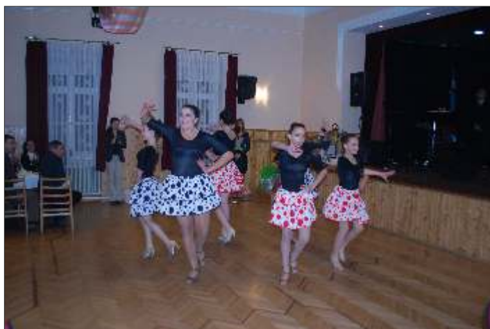
A Vértessy Tánc-Sport Egyesület latin formáció bemutatója

Az ízletes birkavacsorát a hajnalig tartó mulatozás követte.