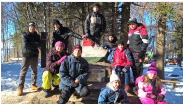
Hittanos zarándokok a Kékestetőn

2017. január és február havában két egynapos kirándulásra mehettek református hittanosaik barátokkal, családtagokkal. Köszönjük mindazok segítségét, -Isten áldja meg őket- akik ezt a szép élményt lehetővé tették! Zarándok utunk bőséges volt testi-lelki javakban. A nagy havas túra után a Mátraházi Református Üdülőben kaptunk finom ebédet, és itt került sor a „bibliai csendespihenőre” Jónás prófeta történetével. Útközben is jó bibliai beszélgetéseink voltak. A nap bibliai idézete ez volt: „Engedelmeskedjete az Istennek” (Jakab 4:7)