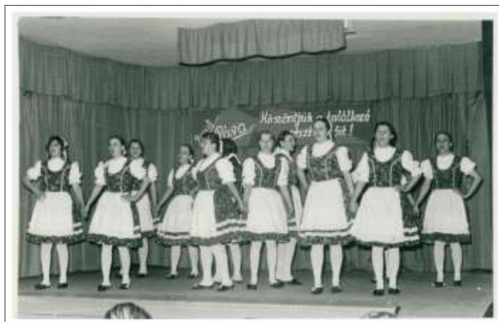
A Pávakör fellépése egy helyi rendezvényen

Tisztelettel gondolunk a pávakör és a citerazenekar elhunyt tagjaira, jó egészséget kívánunk az emlékezőknek. G.Cs.J.