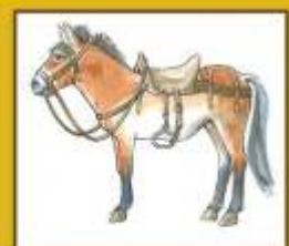
A restaurált farhám felőn Megtárt lószerszámveret rajzon Lószerszám használata rajzon