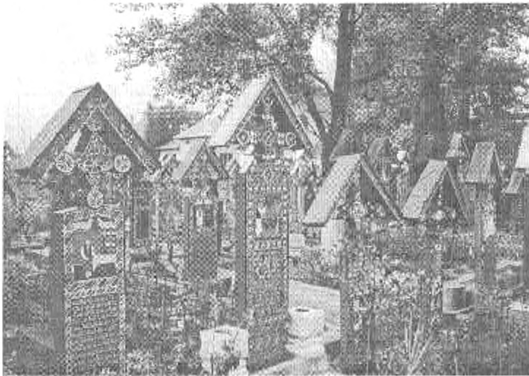
A vidám temető