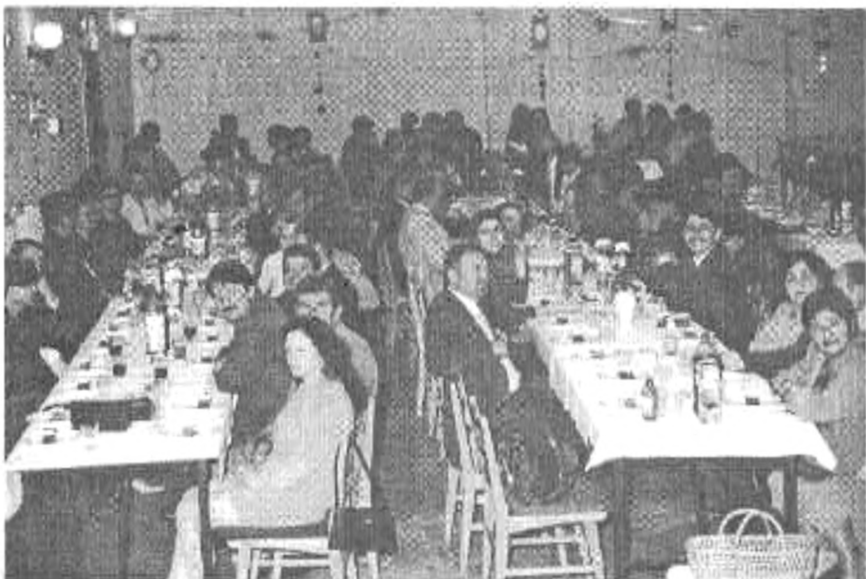
...akik meg is érkeztek, ...

A tombolasorsolást az idén is nagy várakozás előzte meg, hiszen a rendezők, mindig kínosan ügyelnek arra, hogy ér-