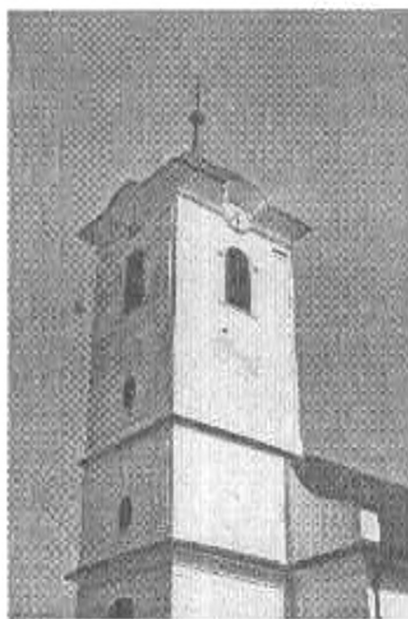
Balassi Bálint nyughelye Híbbén

Ha időnk engedi, érdemes kirán- dulni a közeli Dobogókőre. Utunk a szép Szent Anna kör- templomnál visz el. A mellette lévő ferences rendházhoz kap- csolódik a millenniumi díszud-