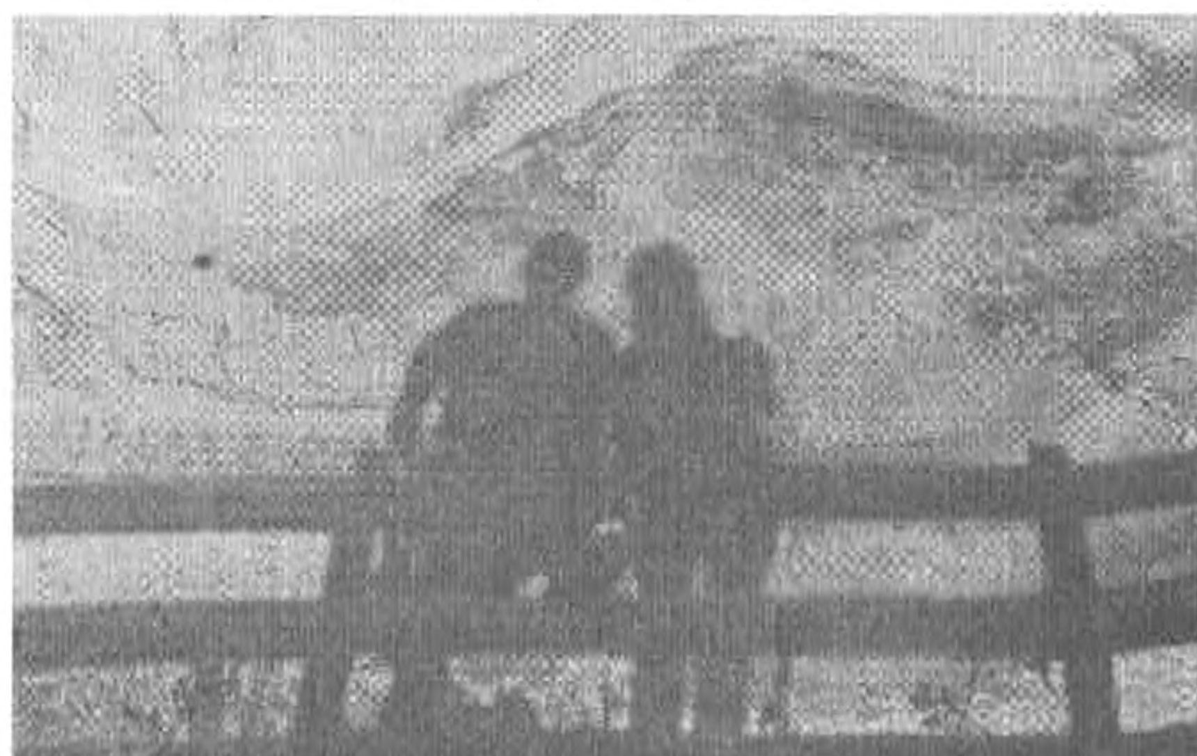
Árny pár - pár árny...