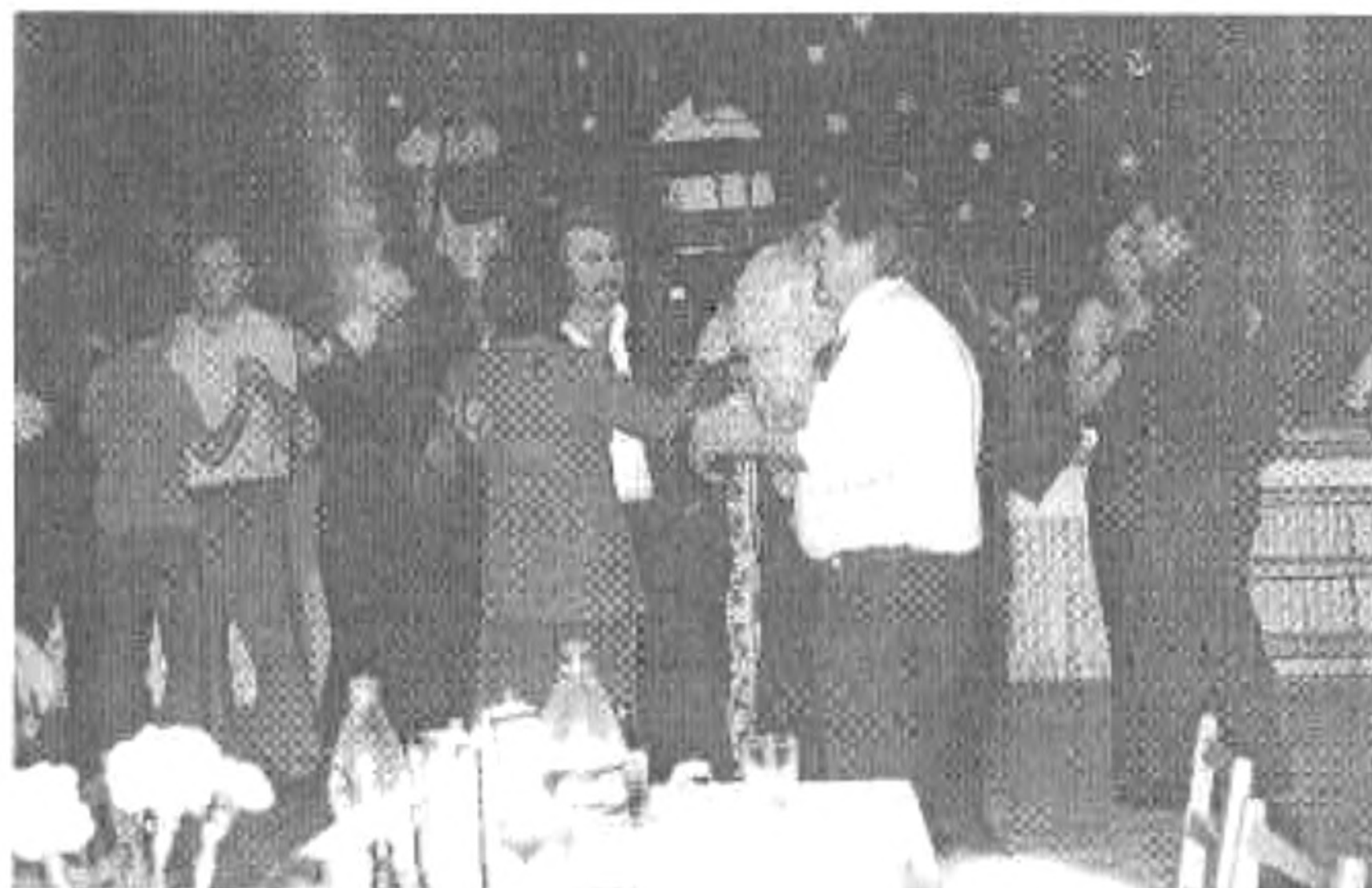
... és jól érezték magukat