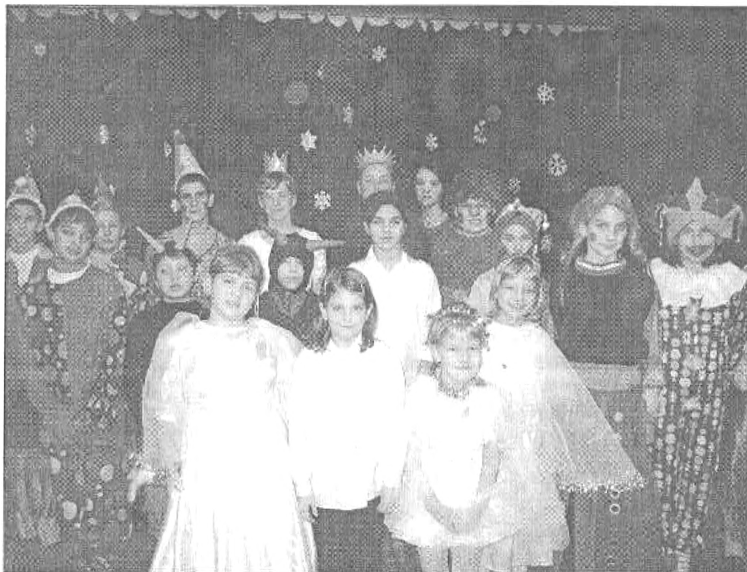
Itt a farsang, áll a bál...