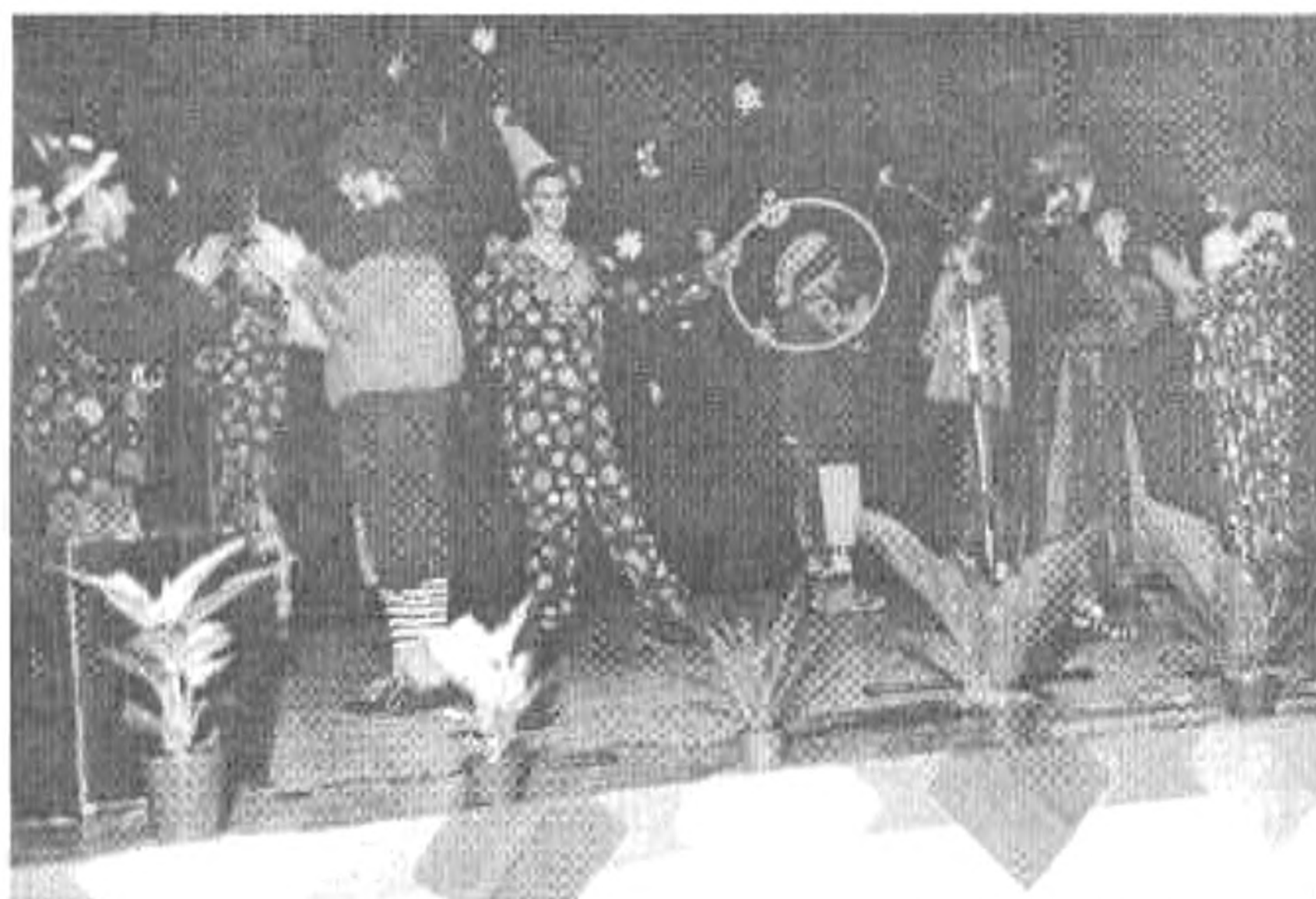
Részlet a műsorból