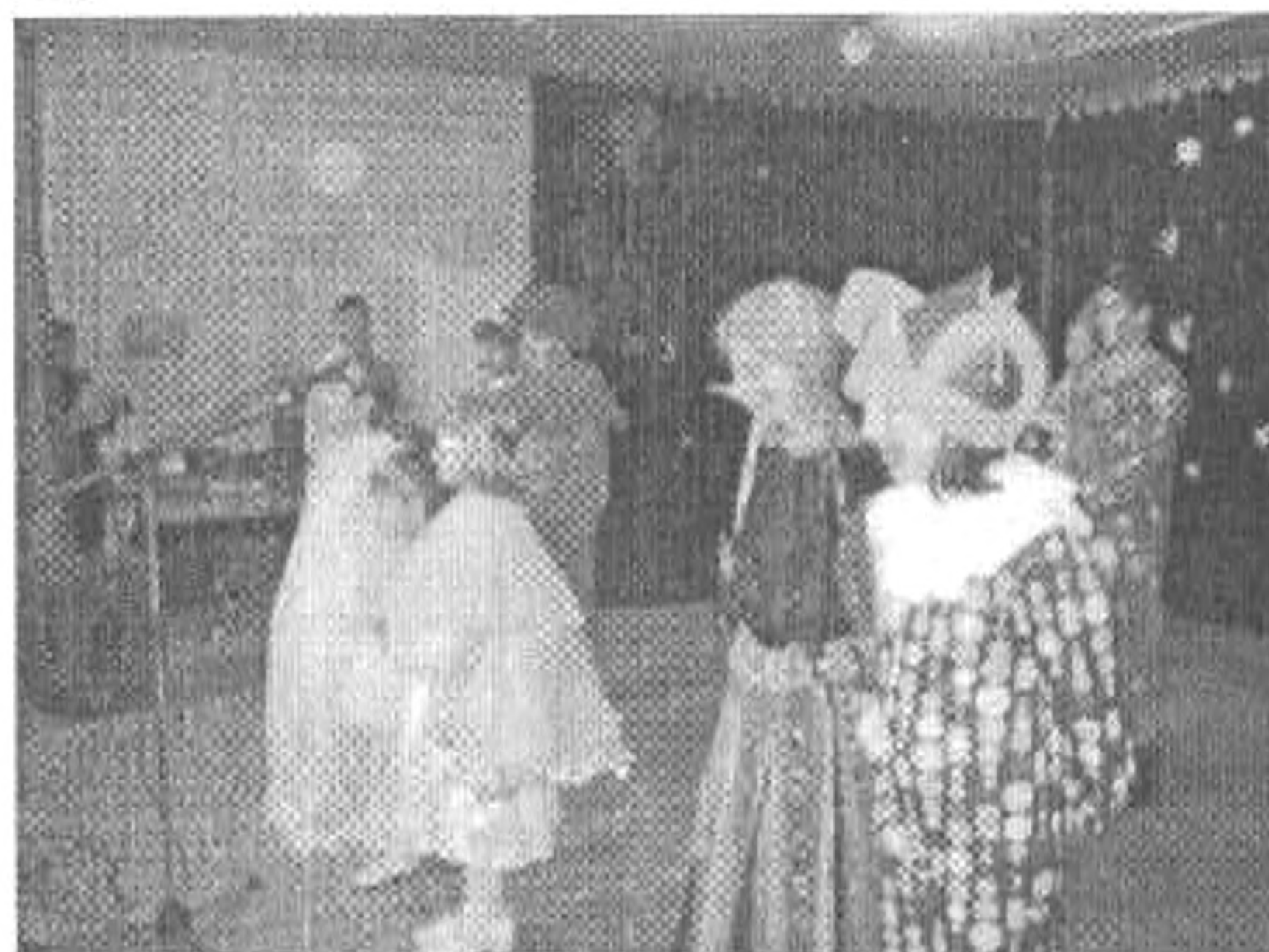
Részlet a műorból