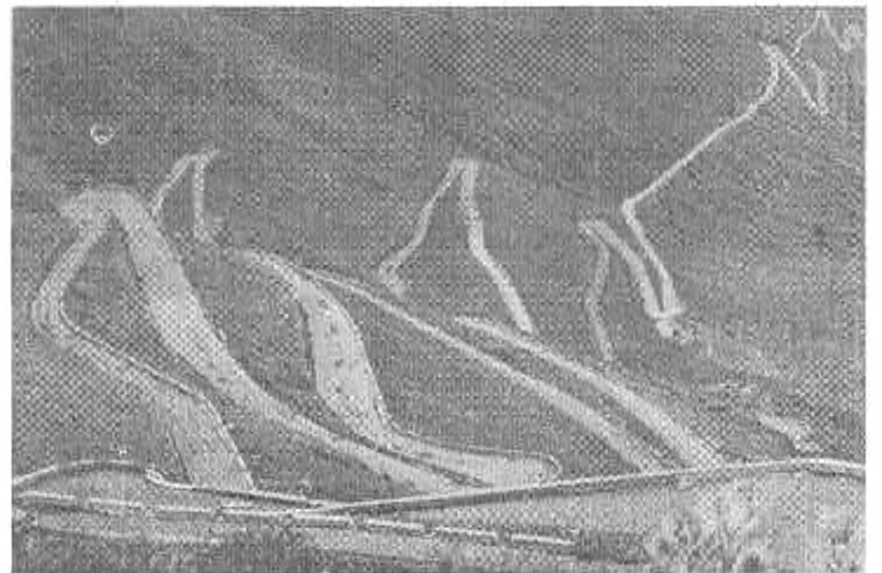
Embent próbáló kanyarok

A Tél-Fény című fotókiállítás már hagyomány településünkön. Mi így köszöntjük a Magyar Kultúra Napját. A ki-