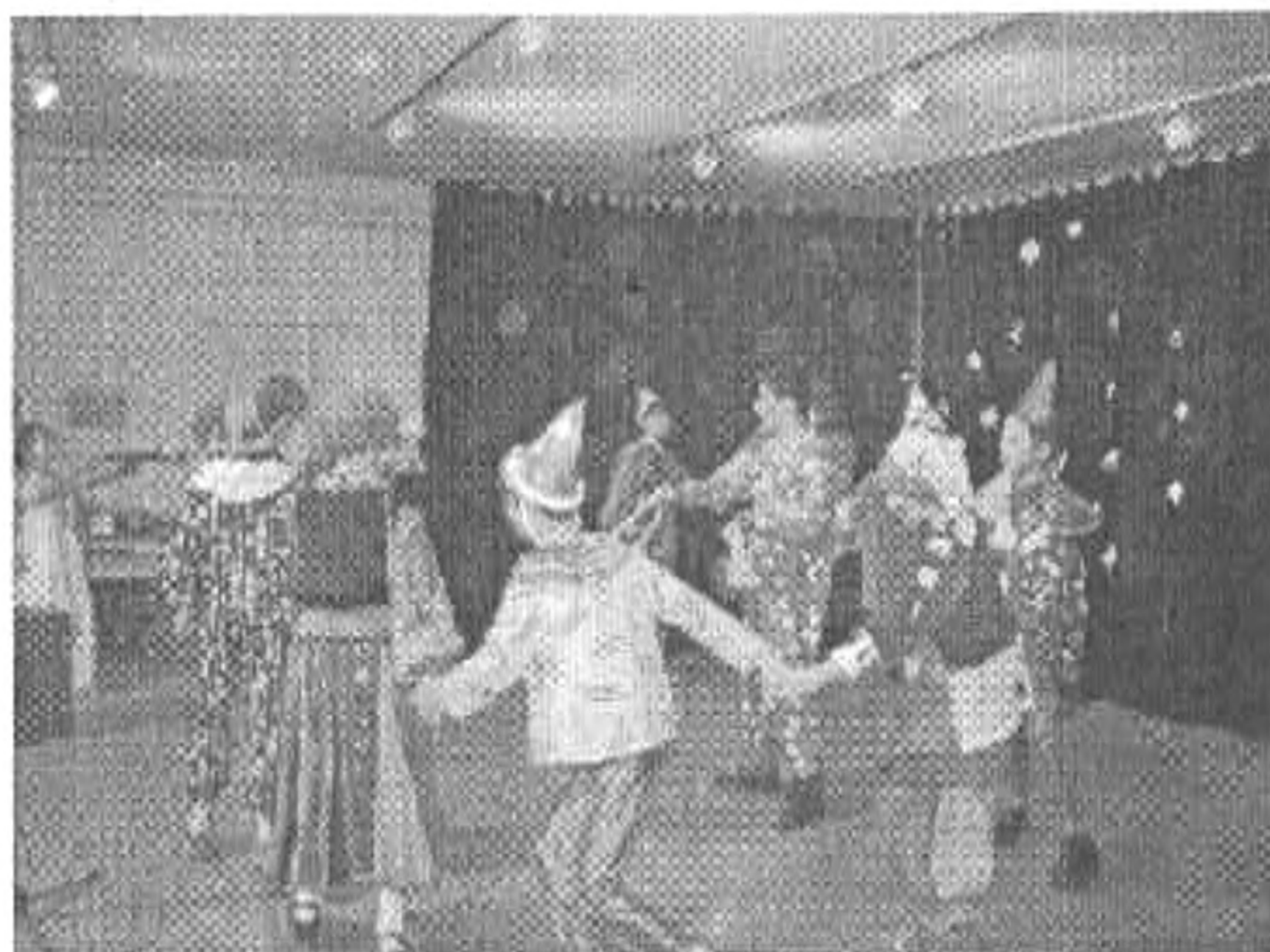
Részlet a műorból