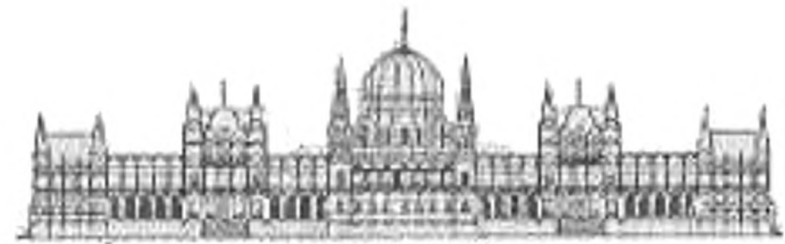
DOMOKOS LÁSZLÓ ORSZÁGGYŰLÉSI KÉPVISELŐ