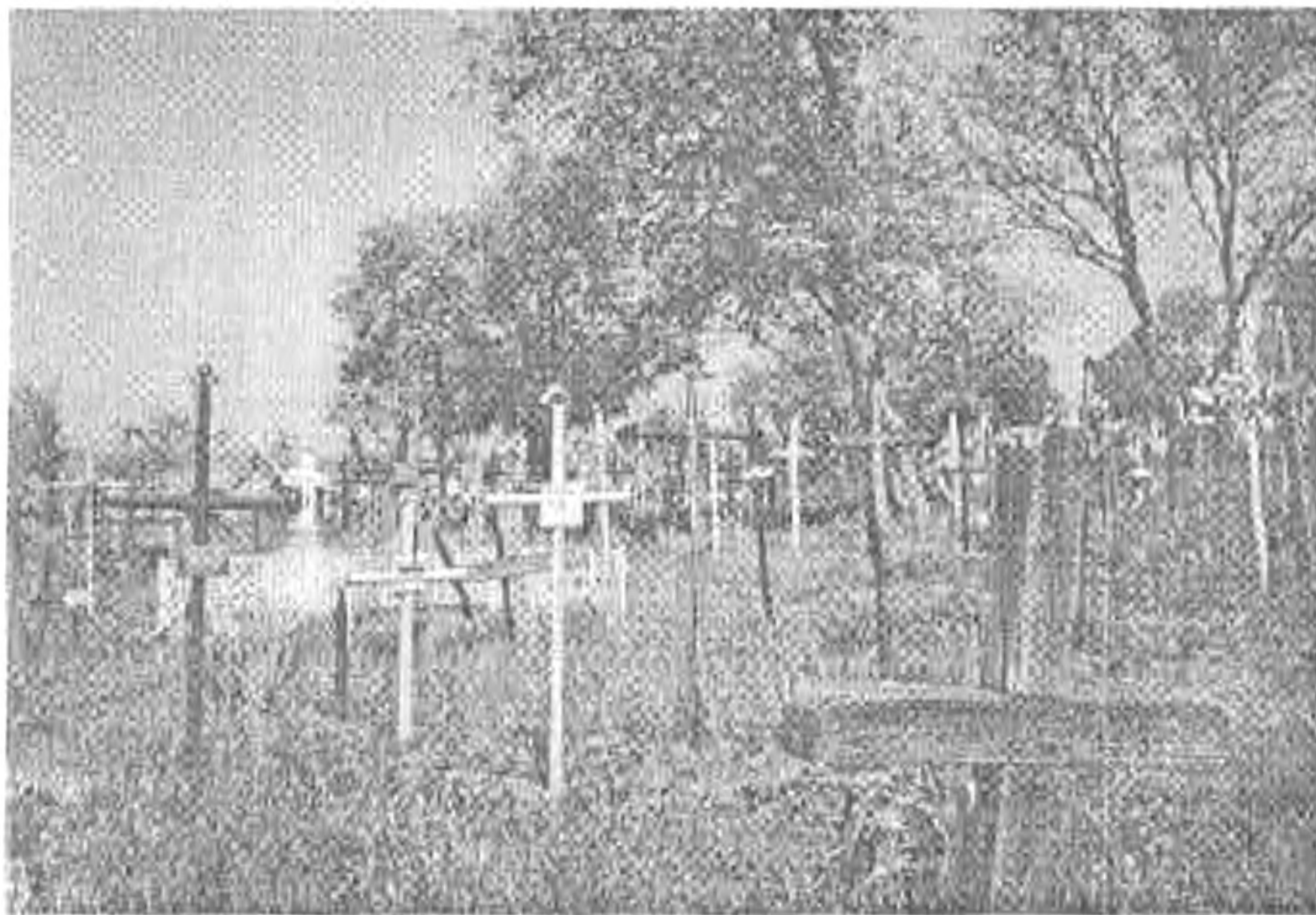
Szocreál fejfák a forrófalvai temetőben

meke, a temető fakápolnája, amelynek alapjait évszázadok óta tartja az ún. bálványkő. Rövid nézelődés után utunk Bogdánfalvára vezetett. Ezen a csángó településen először a nemrég elhunyt utolsó csángó kántor házában ismerkedtünk az ottani emberek életmódját-és vallásosságát is jól bemutató környezettel. Az