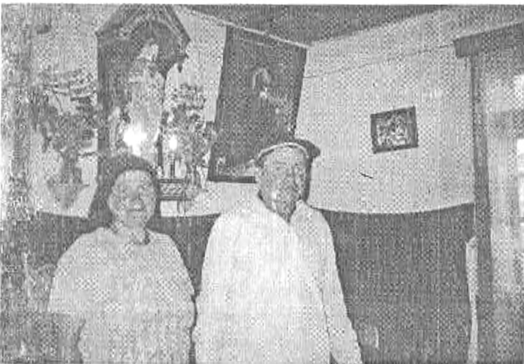
A bogdánfalvi csángó kántor szobabelsője

új tulajdonosokkal folytatott ízes párbeszéd során meggyőződhetünk arról, hogy valóban mennyire fontos feladata a magyarságnak a csángók „megmentése”. Amit már ekkor bizonyosan láthatunk az röviden így összegezhető: a csángó ember