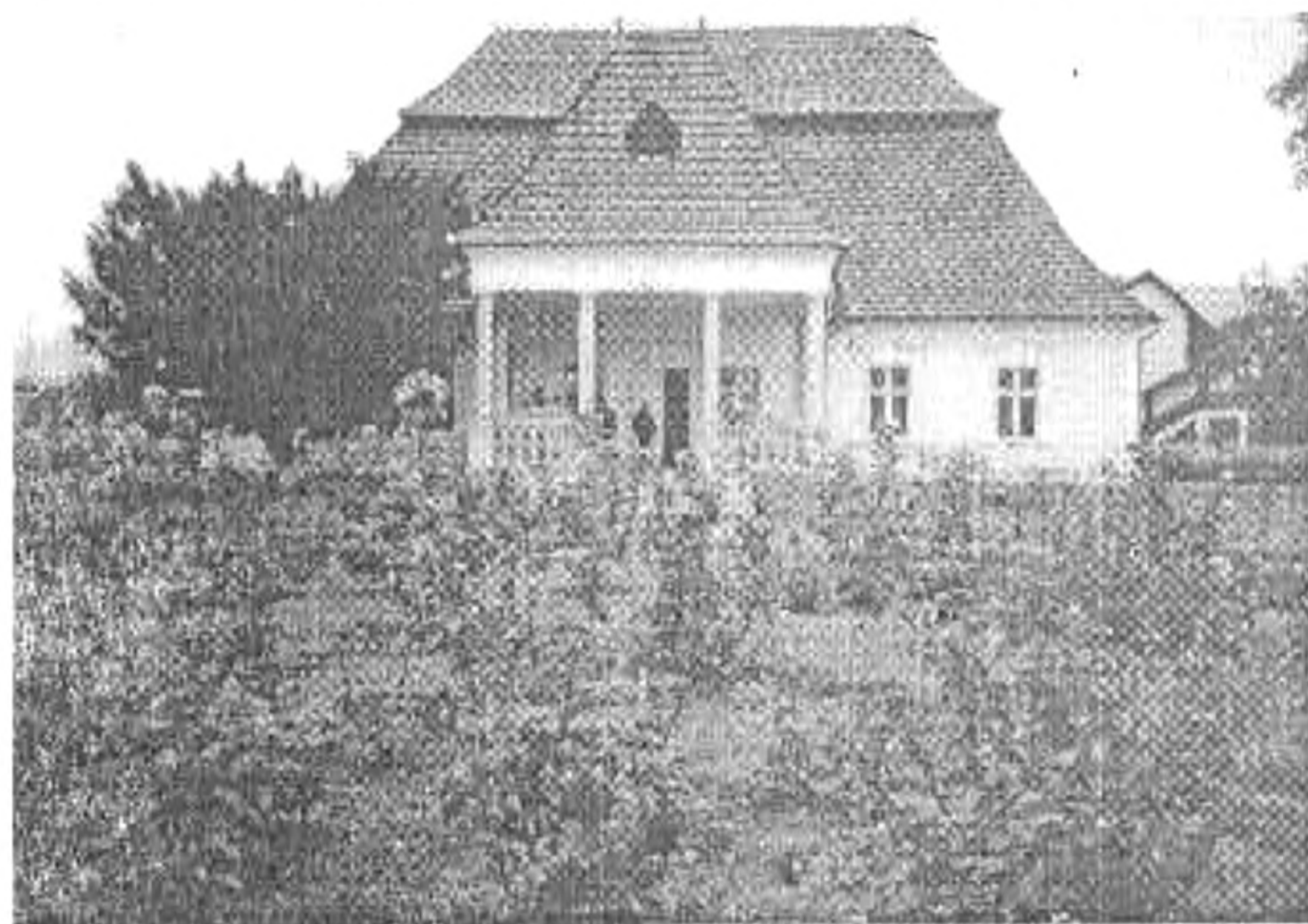
A kúria a rózsakerttel

hogy elérkezzünk Mikes Kelemen szülőfalujába. Az út minősége... mondjuk úgy, hogy „történelmi”. Ebből adódóan aki nem vezet, az nyugodtan nézelődhet. A tájat, a Háromszéki-medencét a Kárpátok összefüggő vonulata szelíden megölel: A főútról Rétynél térünk le úticélunk felé. Erdemes megállni egy kicsit, itt született Györgyjakab Endre bácsi, a kanyargó Feketelgy partján. A közeli Nyíres botanikai értékeket őrző védett terület. A szebb napokat látott Nagyborosnyó után elérkezzünk Zágonba. A 4000 lakosú nagyközség jó fele magyar. Szerényen - szegényen élnek, mezőgazdasággal, erdőműveléssel foglalkoznak, igen csekély az ingázók száma, egyre