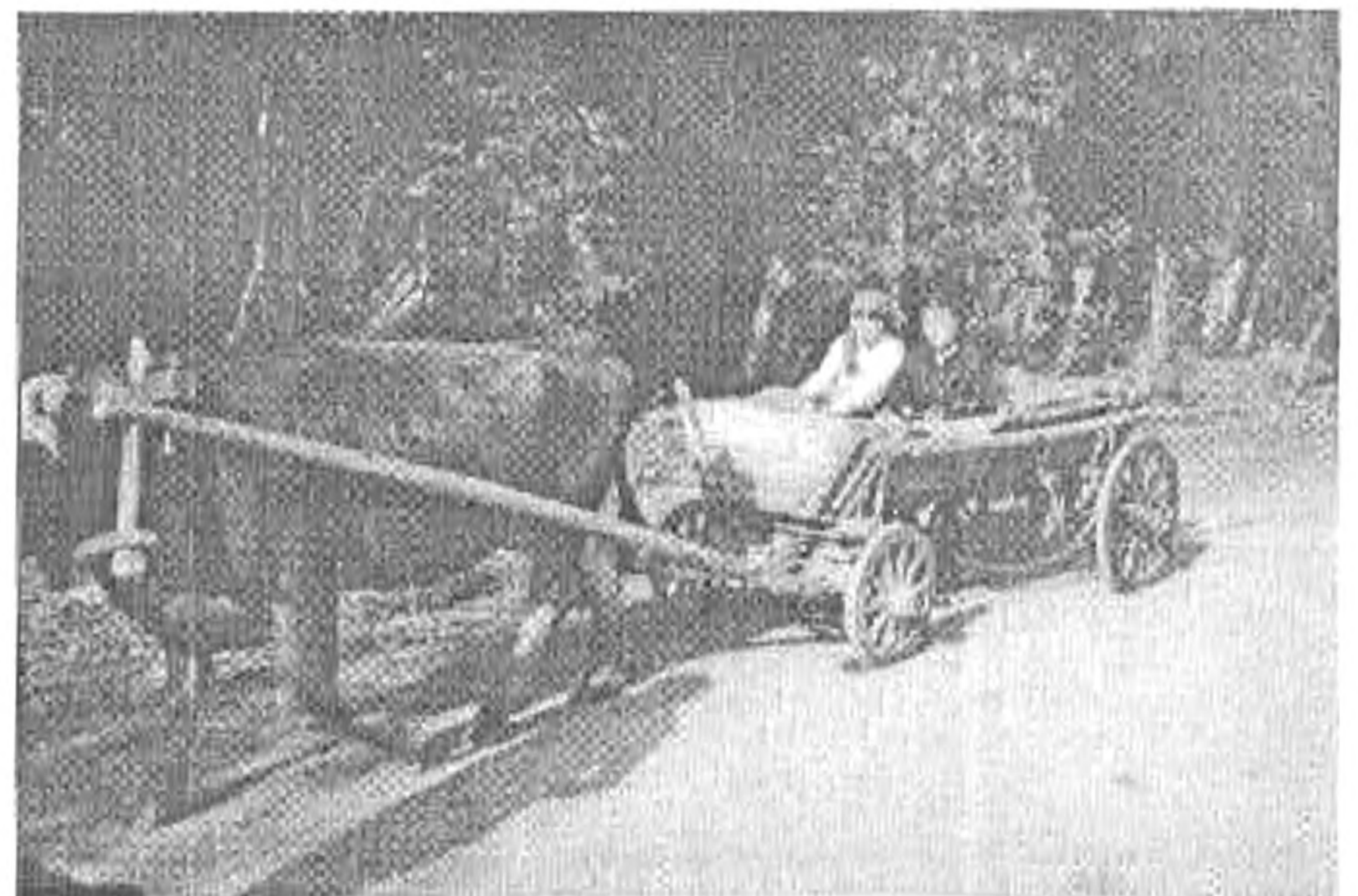
A klézsei tömegközlekedés