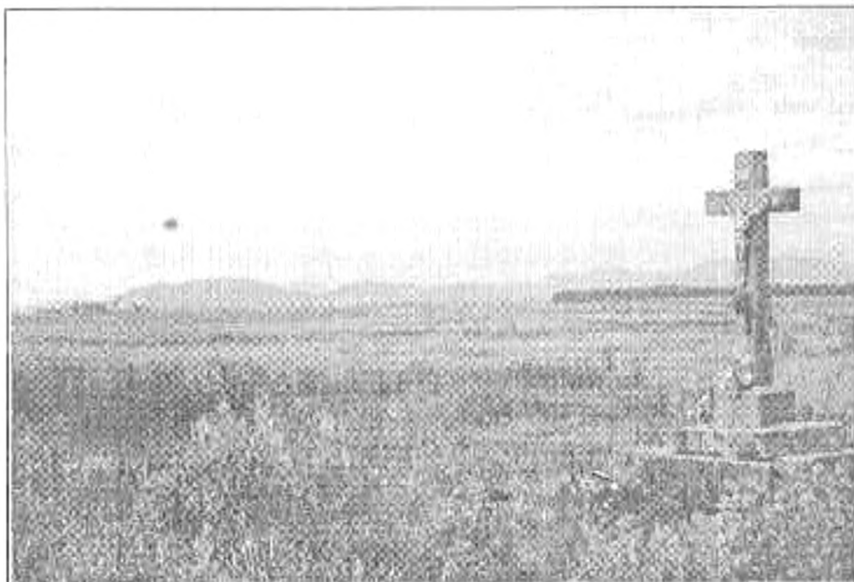
A globális végtelen

Két hatalmas akác árnyékában Színes virágcsokor. Állunk Előtted: hatalmas kőkereszt. Mögöttünk végelláthatatlan Parlagfűtenger a jelen. Globális végtelen.