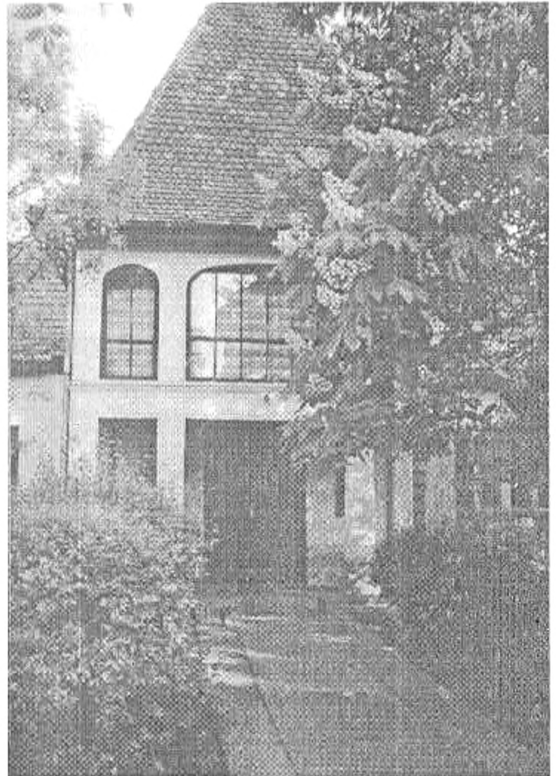
„Iskola, iskola ki a csuda jár oda”

Vigyázz Magadra! Vigyázz Gondolataidra, mert ezekből lesznek szavaid! Vigyázz Szavaidra, mert ezekből lesznek tetteid! Vigyázz Tetteidre, mert ezekből lesznek szokásaid! Vigyázz Szokásaidra, mert ezekből alakul ki jellemed! Vigyázz Jellemedre, mert ez lesz a Sorsod.