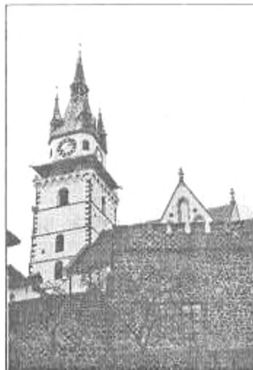
A Szent Katalin-templom

liliomos címere látható. Áthaladva a boltívek alatt, balról a sarokban találjuk az Információs Irodát, ahol készségesen eligazítanak bennünket, még magyar nyelven is. Csak néhány lépés a sikátorban és feltáruul előttünk a Főtér teljes pompájában. A látvány lenyűgöző a koradélutáni napfényben! Az az érzése támad az embernek, mintha a házak fölött lebegne a Szent Katalin templom az apró tornyocskáival. A környező épületek évszázadok emlékeit őrzik. A legnevezetesebb közülük az, amelyben II. Lajos királyunk özvegye, Mária királyné lakott. A díszes Városháza mellett szinte tündököl a Gyémánt-ház, amely nevét hálólő kőboltozatáról kapta. A 250 éves hatalmas Szentháromság-