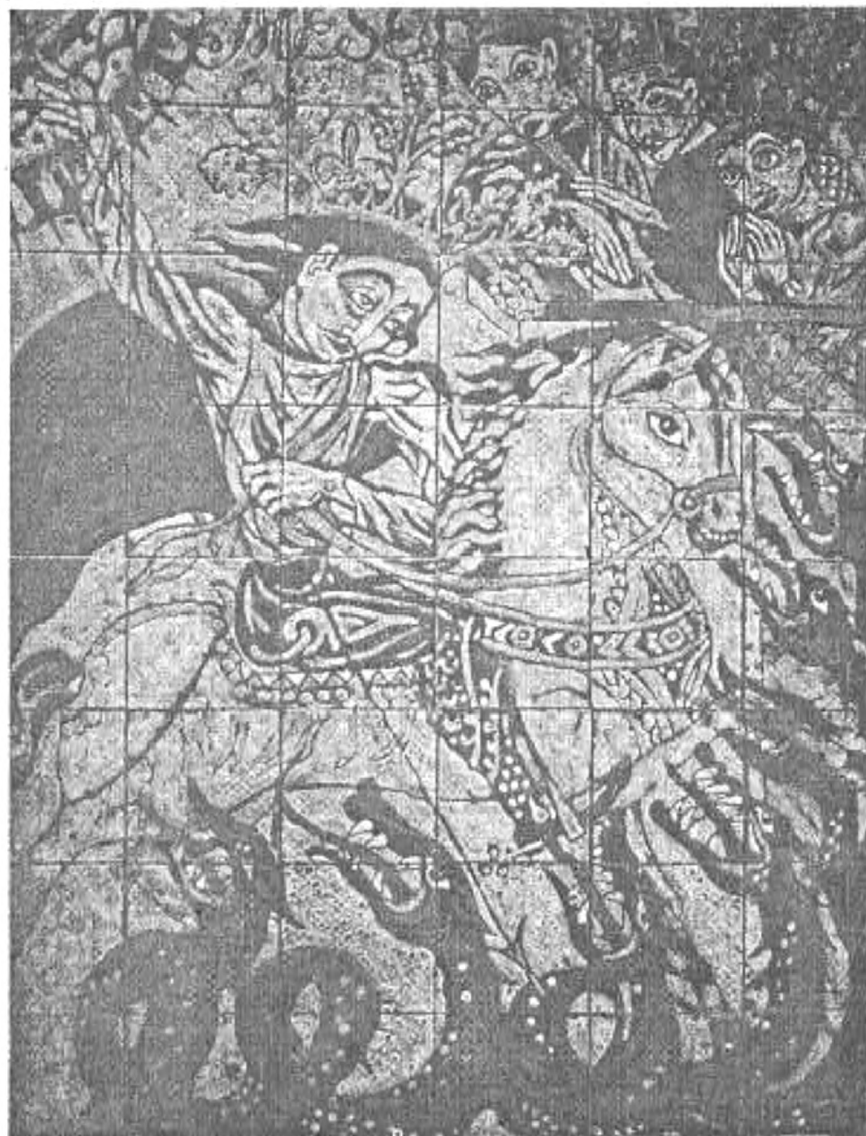
Kovács Margit: Mese (tűzzománc)