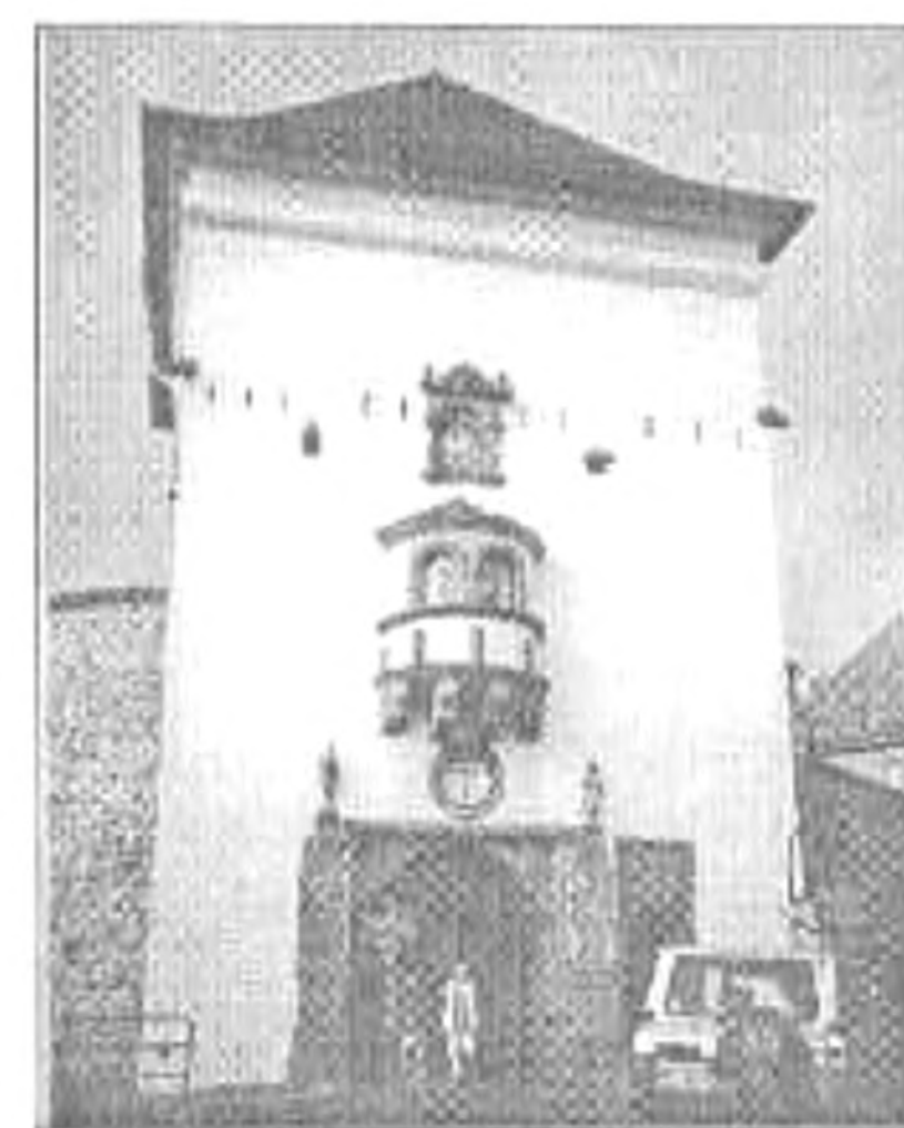
Az Alsó-kapu

védőfalakat húzták föl az óváros legmagasabb pontján, s csak ezután kezdték alapozni a Szent Katalin templomot 1465-ben. A Főtérről fedett lépcsősoron juthatunk fel az