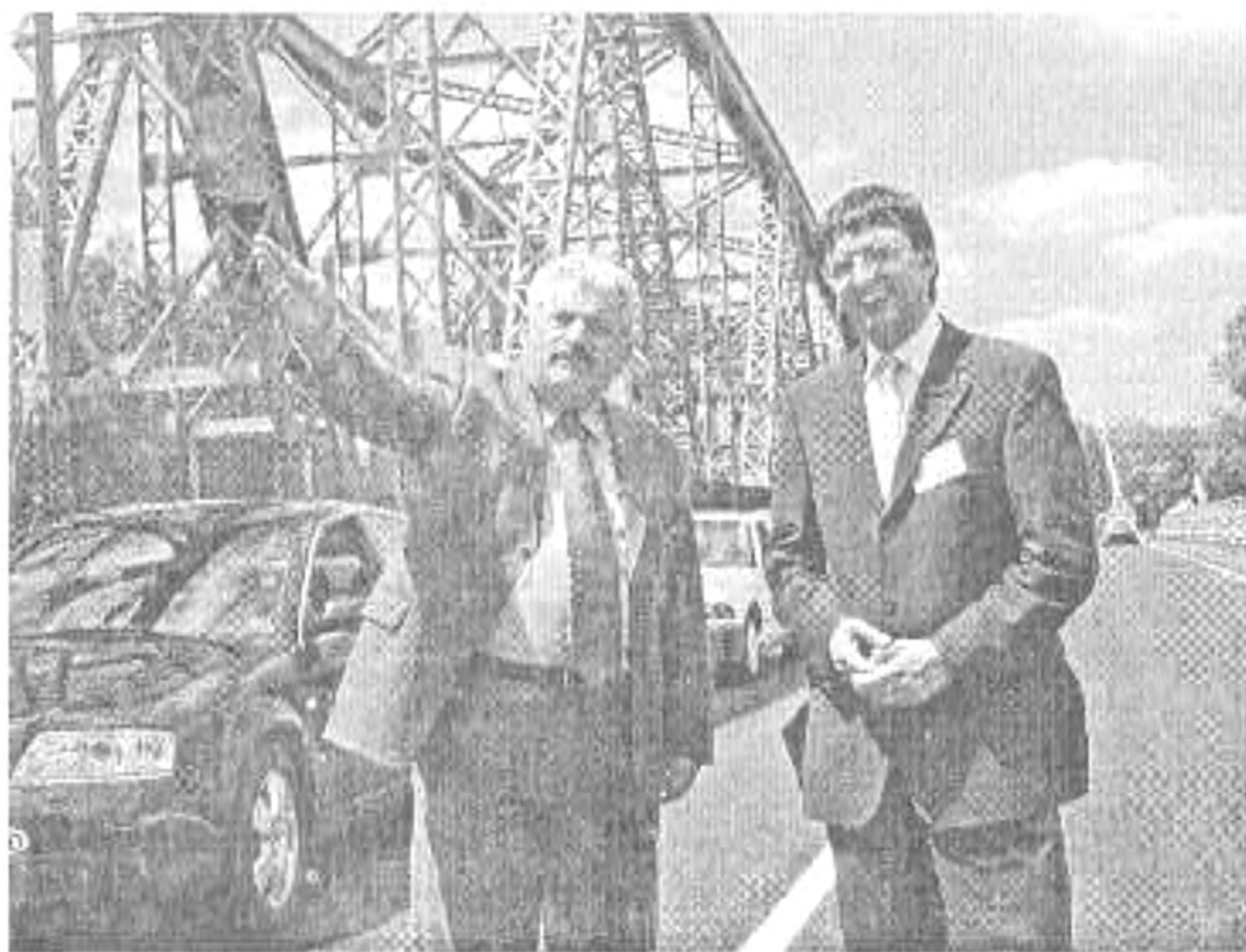
Fónagy János miniszterrel az új Tiszaugi hídon

A megye közúton való megközelíthetősége szempontjából kiemelt szereppel bír a 44-es főút gyorsforgalmi úttá való kialakítása. Örömmel nyugtázzhatjuk, hogy az új Tiszaugi híd megépítése és a 44-es út felújítása után elérhető közelségbe került a Szarvast és Békésszentandrás elkerülő út megépítése, a Széchenyi terv plusz keretében.