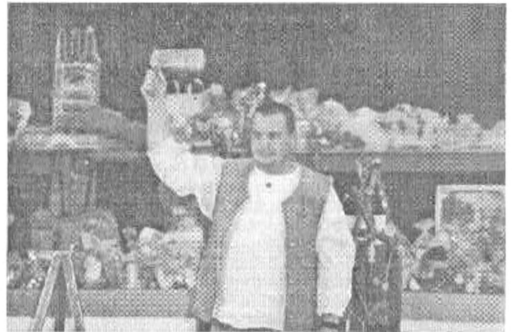
„Ihók, a bolondos”