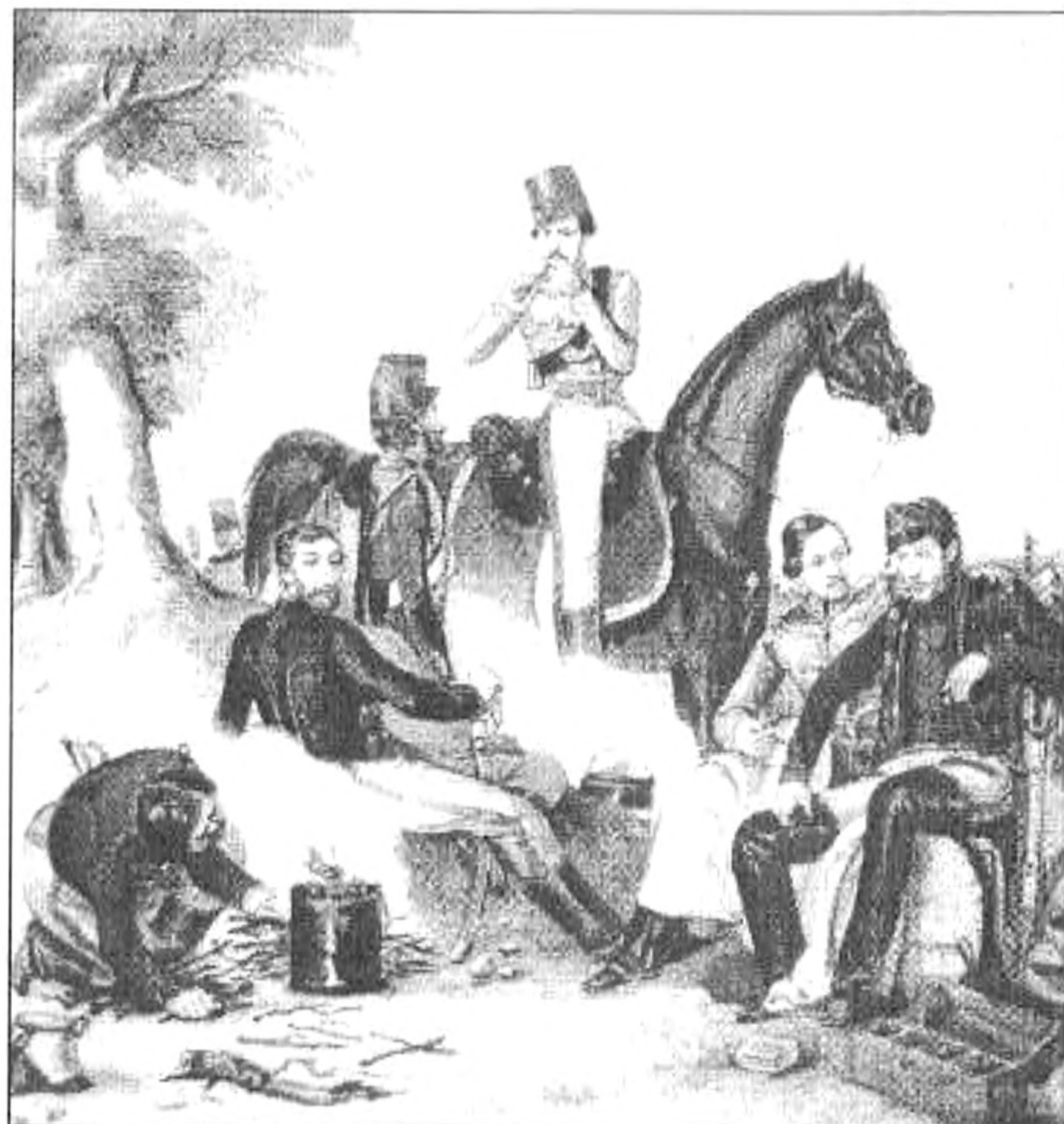
Thán-Mór: Honvédtisztek tábortűznél