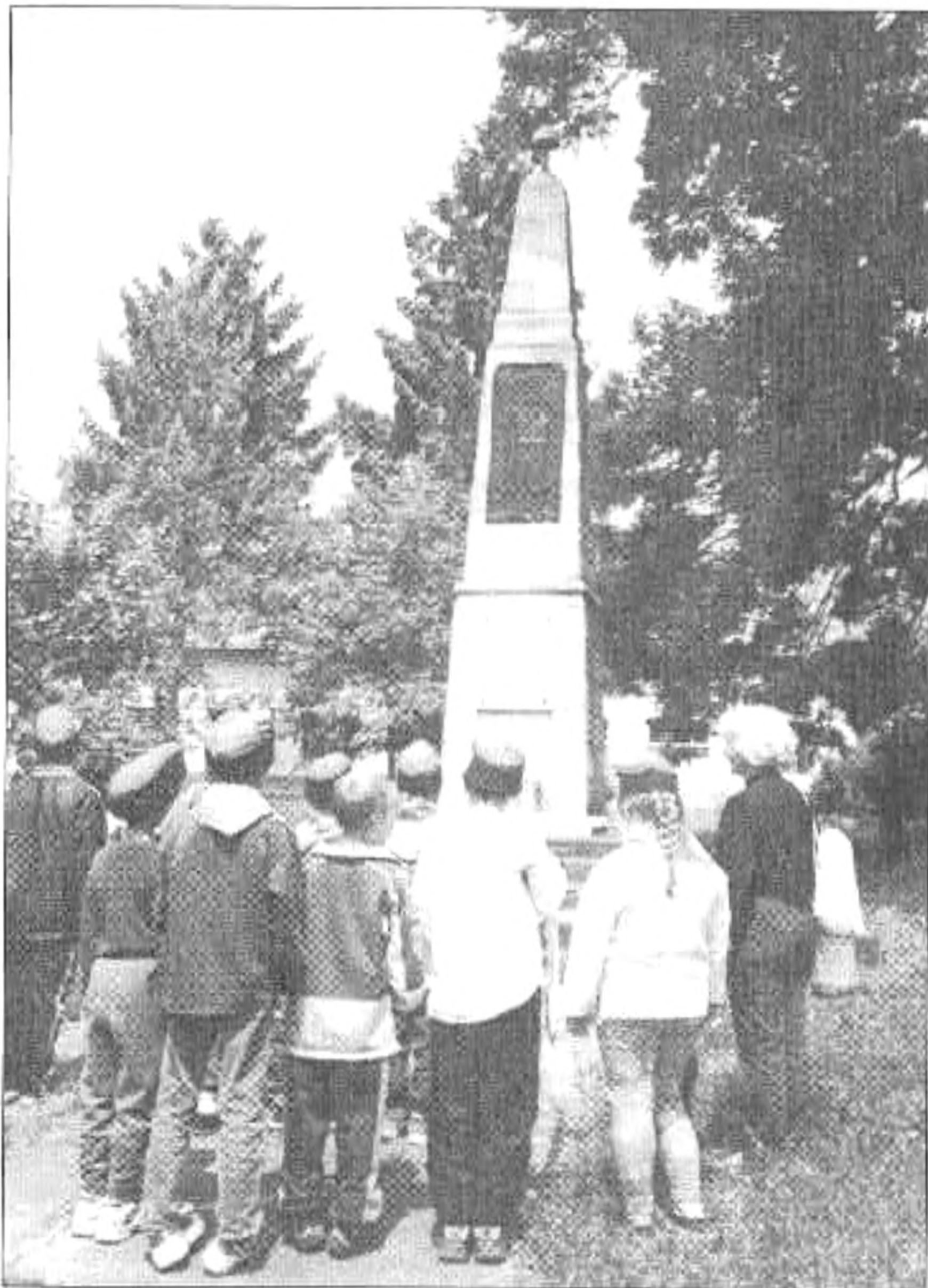
Koszorúzás az emlékműnél