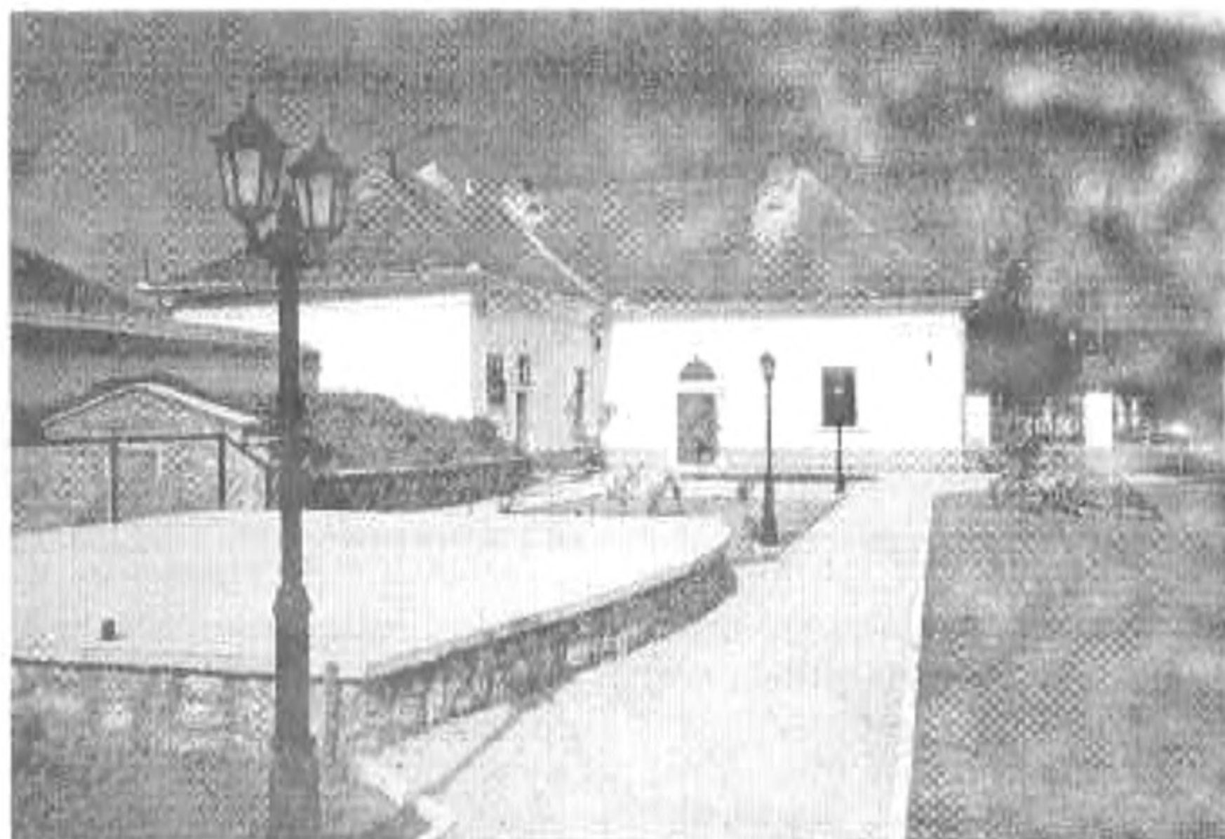
Hídvégárdó: A Gedeon-kúria udvara a szabadtéri színpaddal

szinte hívogat. Mennyi mindentől elbeszélgethetnék oda kiülve, ahonnan már látszik a Szádelői-völgy pereme, Torna várának körvonala és az alattunk elhúzó kanyargós út