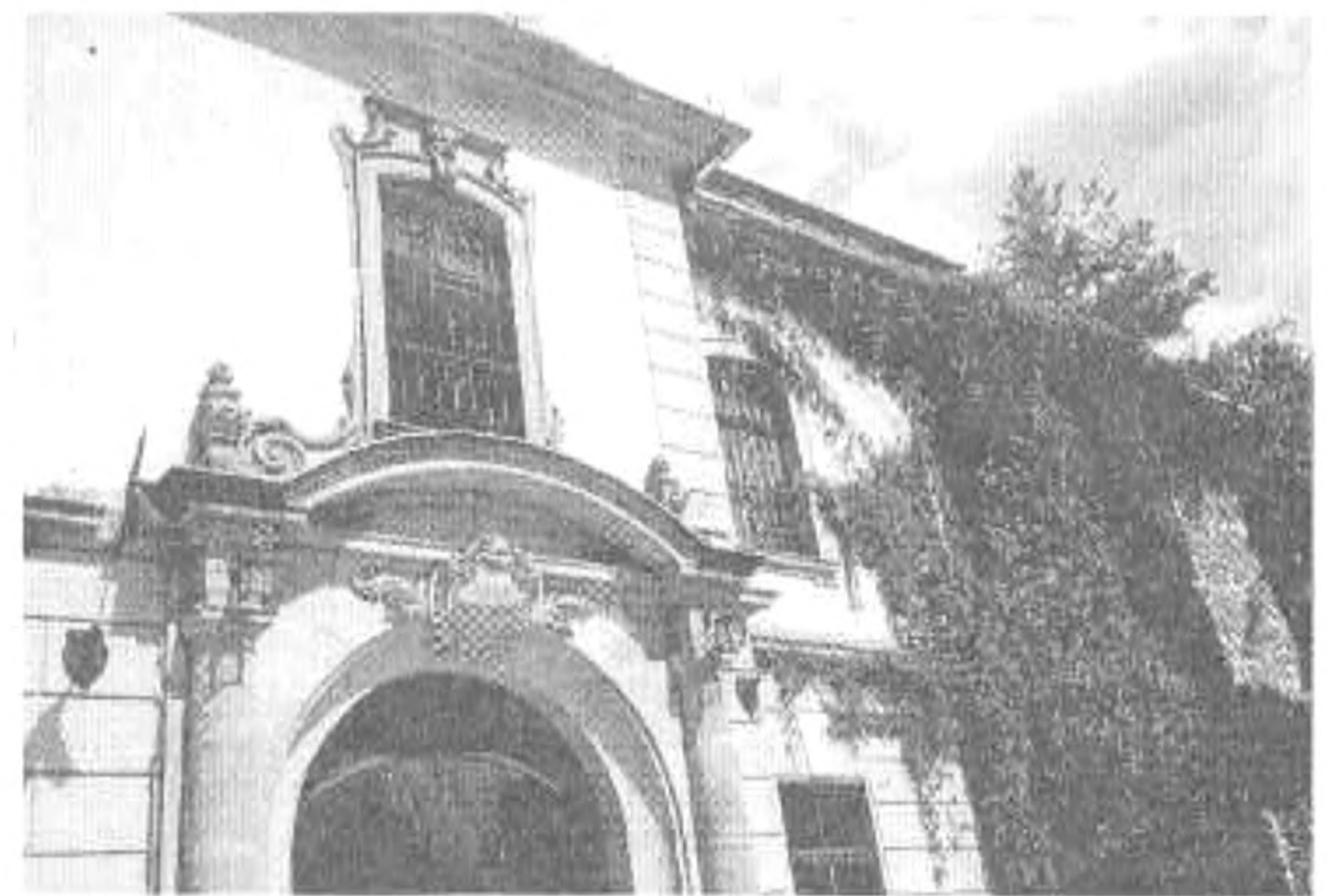
Tornanádaska: A Hadik-kastély főbejárata

Tornaszentendrén páratlan műemlékekkel rendelkezik. A temető dombján hársak, juharok, kőrisek között megbújva található az ikerszentélyes Árpád-kori templom. A hazánkban egyedülálló építményt a XIII. század elején egy korábbi templomocskára kibővítésével a merániai Gertrudis-szal érkezett mesterek alkották. A diadalívról ószövetségi próféták és két szent királyunk István és László néz le ránk. A 10 évig tartó restaurálás nyomán csodálatosan szép freskók kerültek elő. A tiszteletünkre rendezett ünnepi mise után érdekes helytörténeti előadást tartott a plébános úr az ódon falak között. A falu központjában harangláb áll, melyet ká-