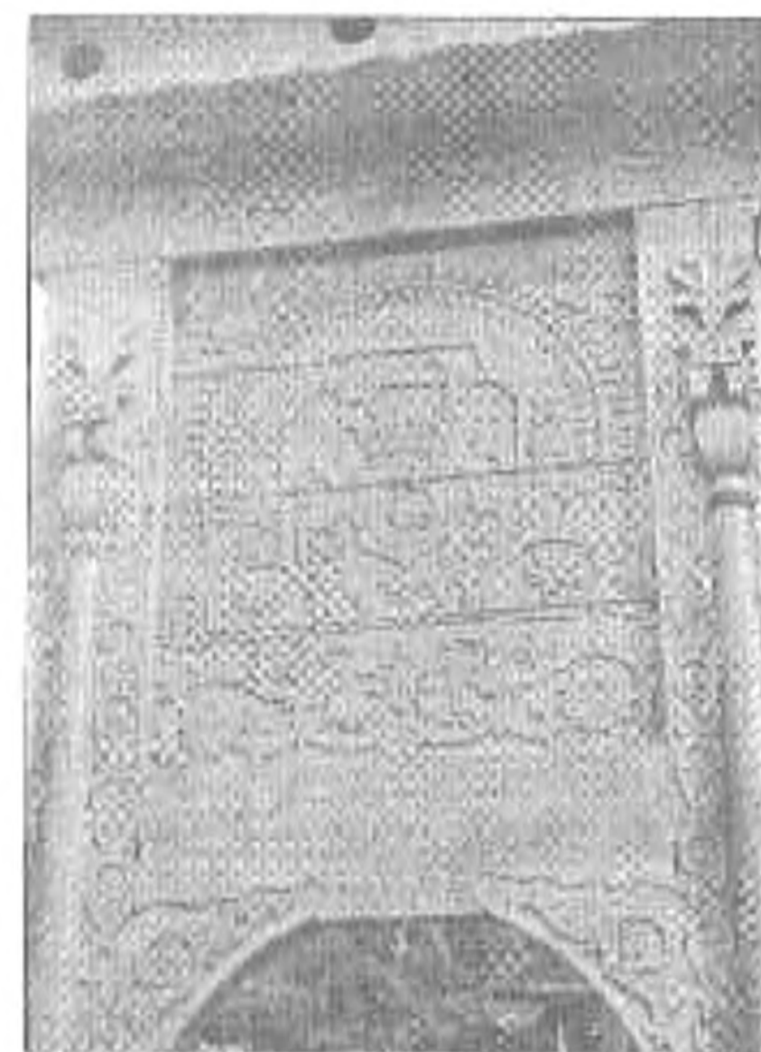
A legújabb székelykapu tükre

Gizi néni csárdája mindig nyitva áll (66/215-902). Érdemes megkóstolni a főtt krumpli reszeléssel dagasztott kemencében sült kenyeret. A vendéget Gizi saláta várja. Paradicsom, káposzta és uborka, no nem összekeverve, hanem szépen szeletelve egymás mellett. A piros paradicsom, a fehér káposzta és a zöld uborka ugye tesznek érteni, sőt el is tudunk képzelni egy ilyen asztalt. A számlát itt is forintban fizethetjük. A „legnagyobb székely” mondta, hogy „Családdal nem lévén megáldva, a magyar népet tekintem családomnak s azt is kívánom fő örökösömmé tenni...” Udvar-