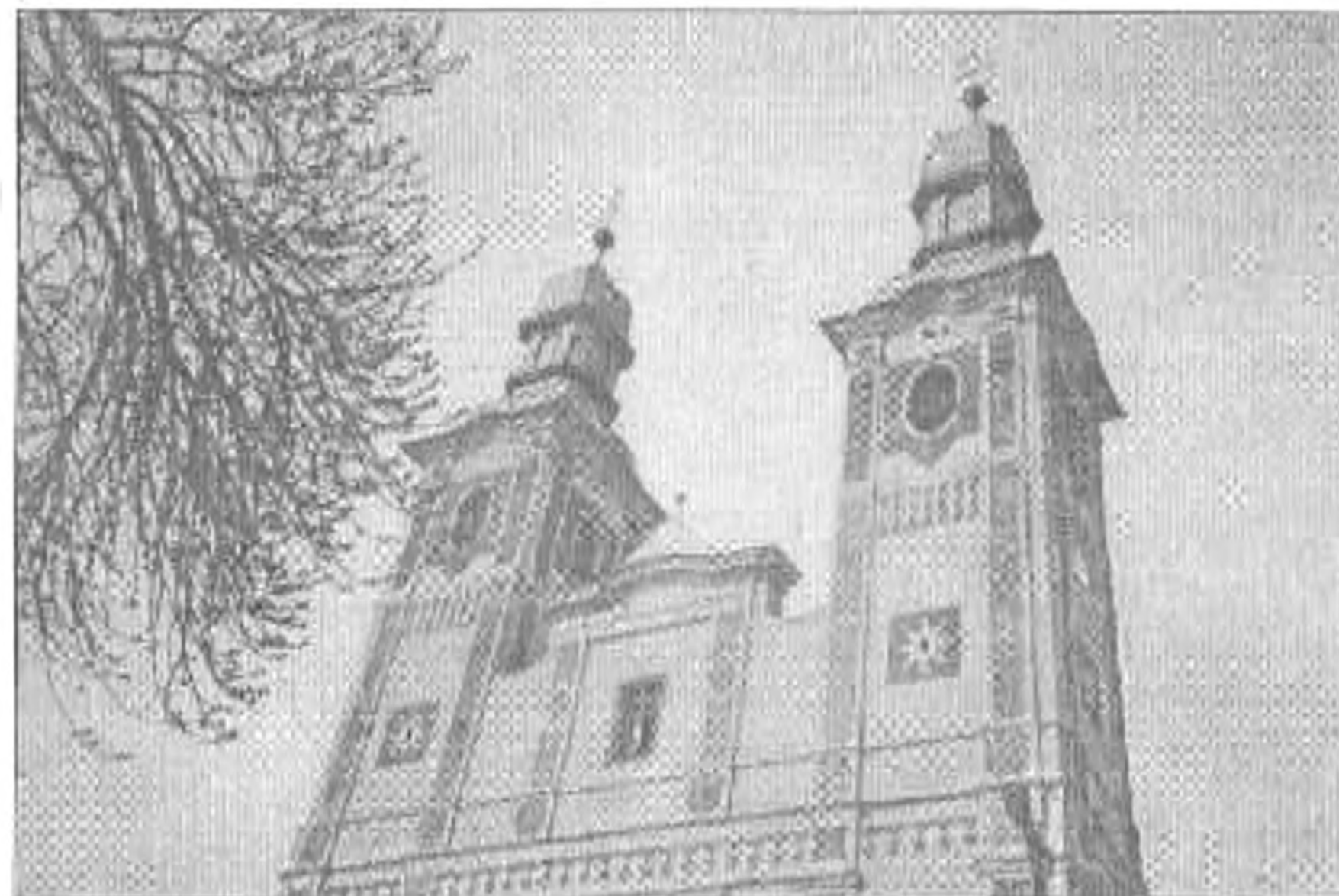
A Ferences templom

letéről, a XIII. században emelt Jézus-kápolnáról is. A Főtér végéből a Vár utcán haladva a Varga-patak hídján túl már jól látható a Székely Támad vár, mely szinte tenyérén hordozza a 110 éves Állami Főreáliskola mai utódját, a Mezőgazdasági Liceumot. A neoklasszicista épületet Meixner Károly, budapesti építész álmodta a történelmi bástyák