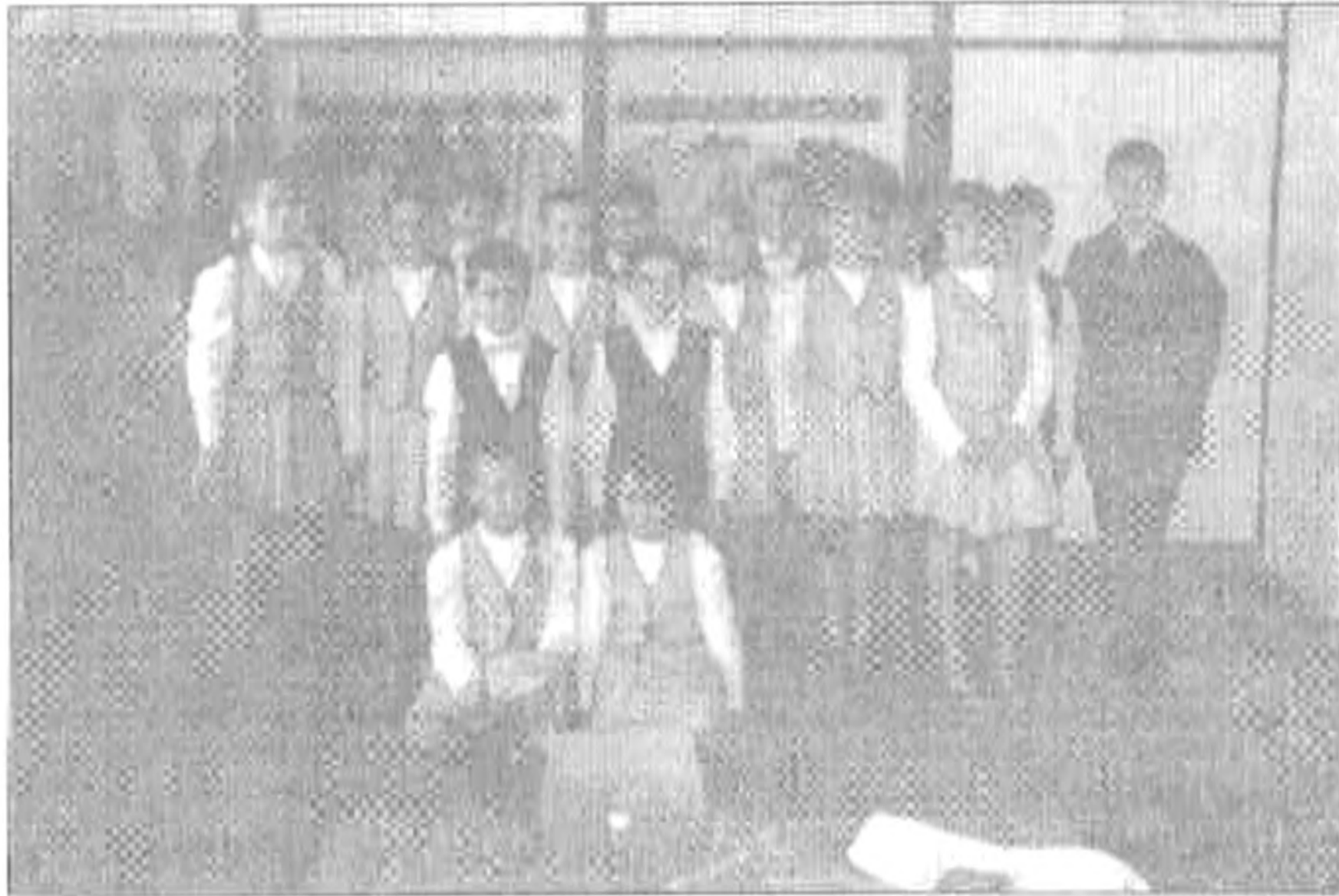
A Somvirág együttes

tot tette felejthetlenné a szarvasi Somvirág Együttes műsora, amelyet a gyerekeken kívül több szülővel együtt élvezhetünk.