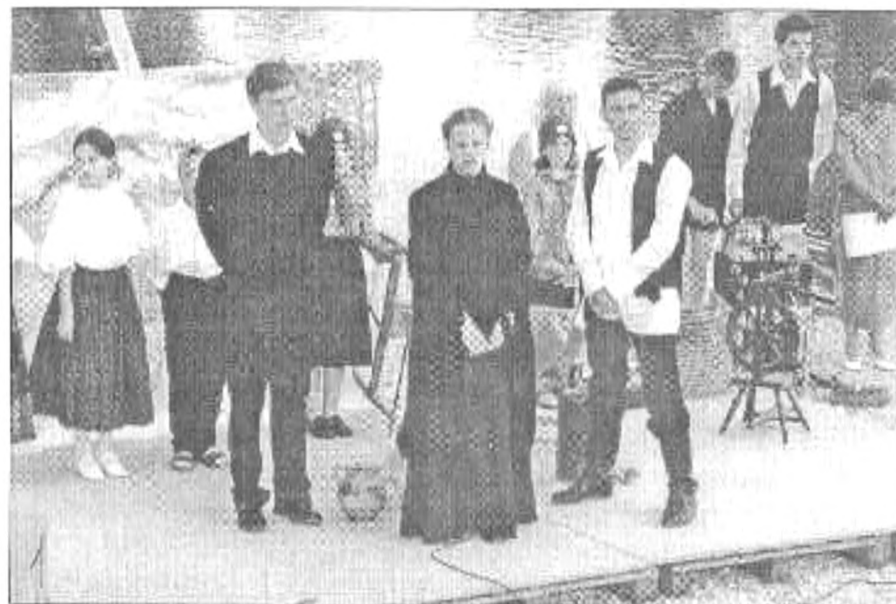
Részlet a jelenetből