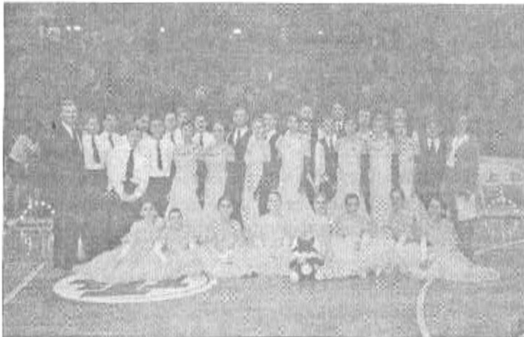
Csoportkép a résztvevőkről