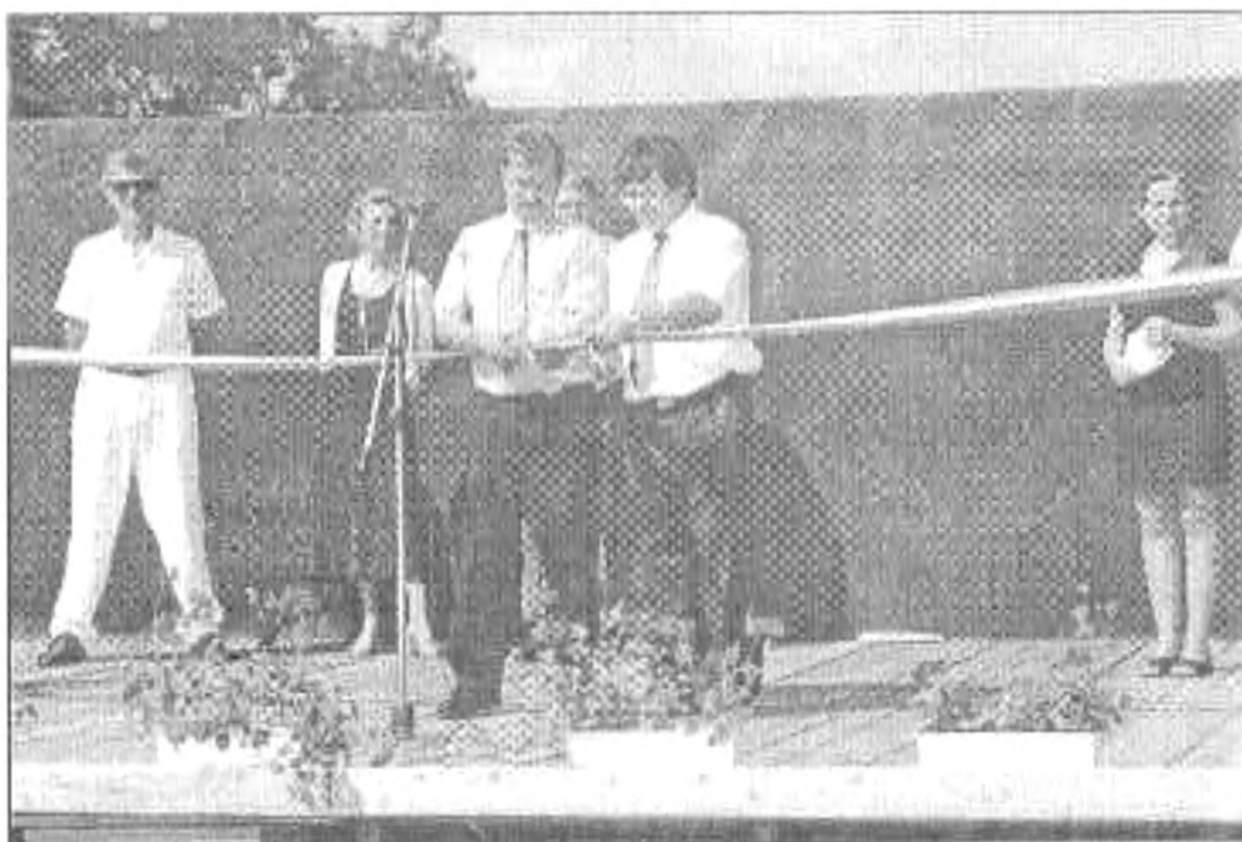
A szalagátvágás pillanatai

Másnap, vasárnap reggel, cifra dolmányos nyalka huszárok és betyárok kíséretében járta zeneszóval és dobszóval a község utcáit egy hintó és egy