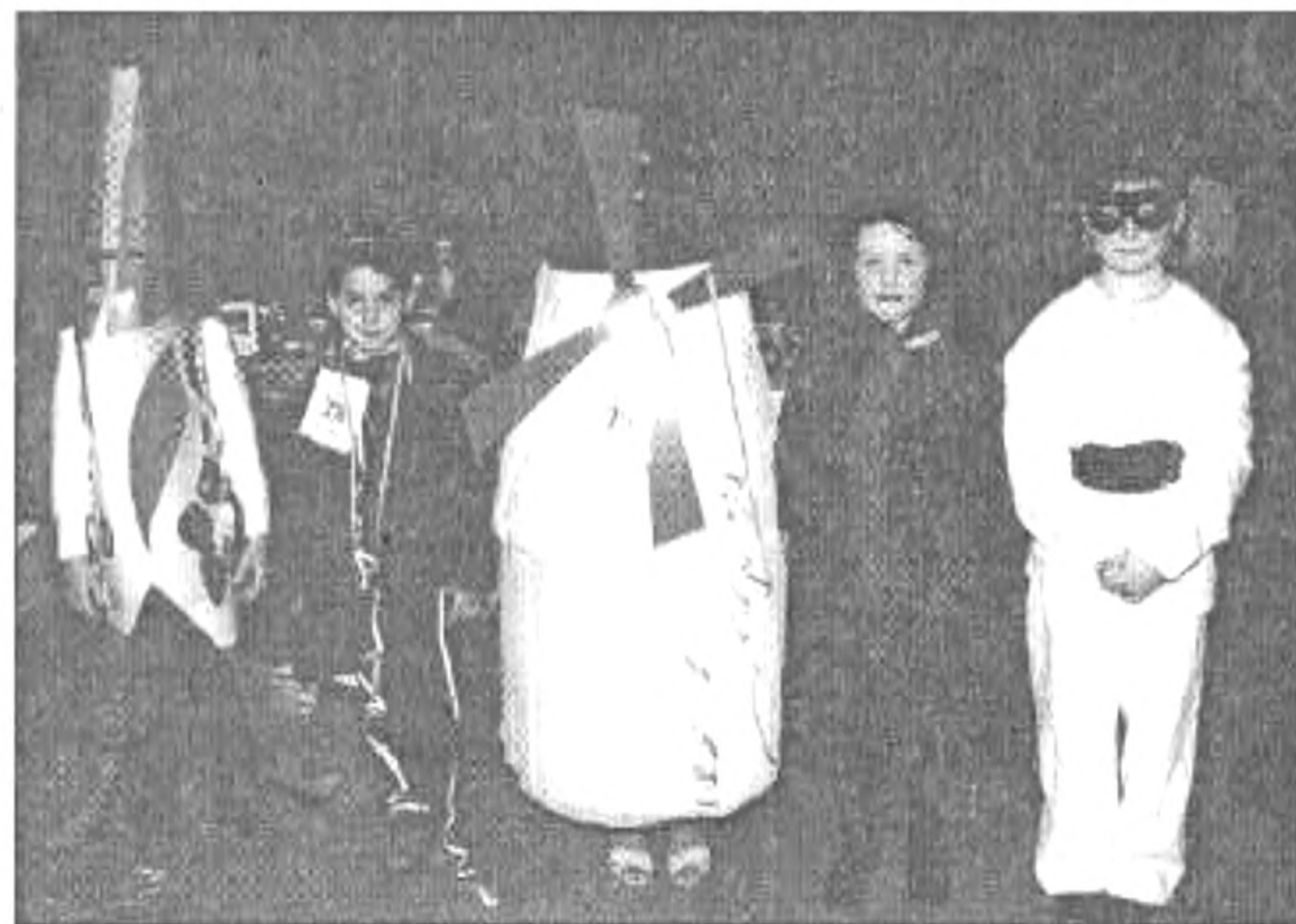
Balra az első a ponty, középen a szélmalom.