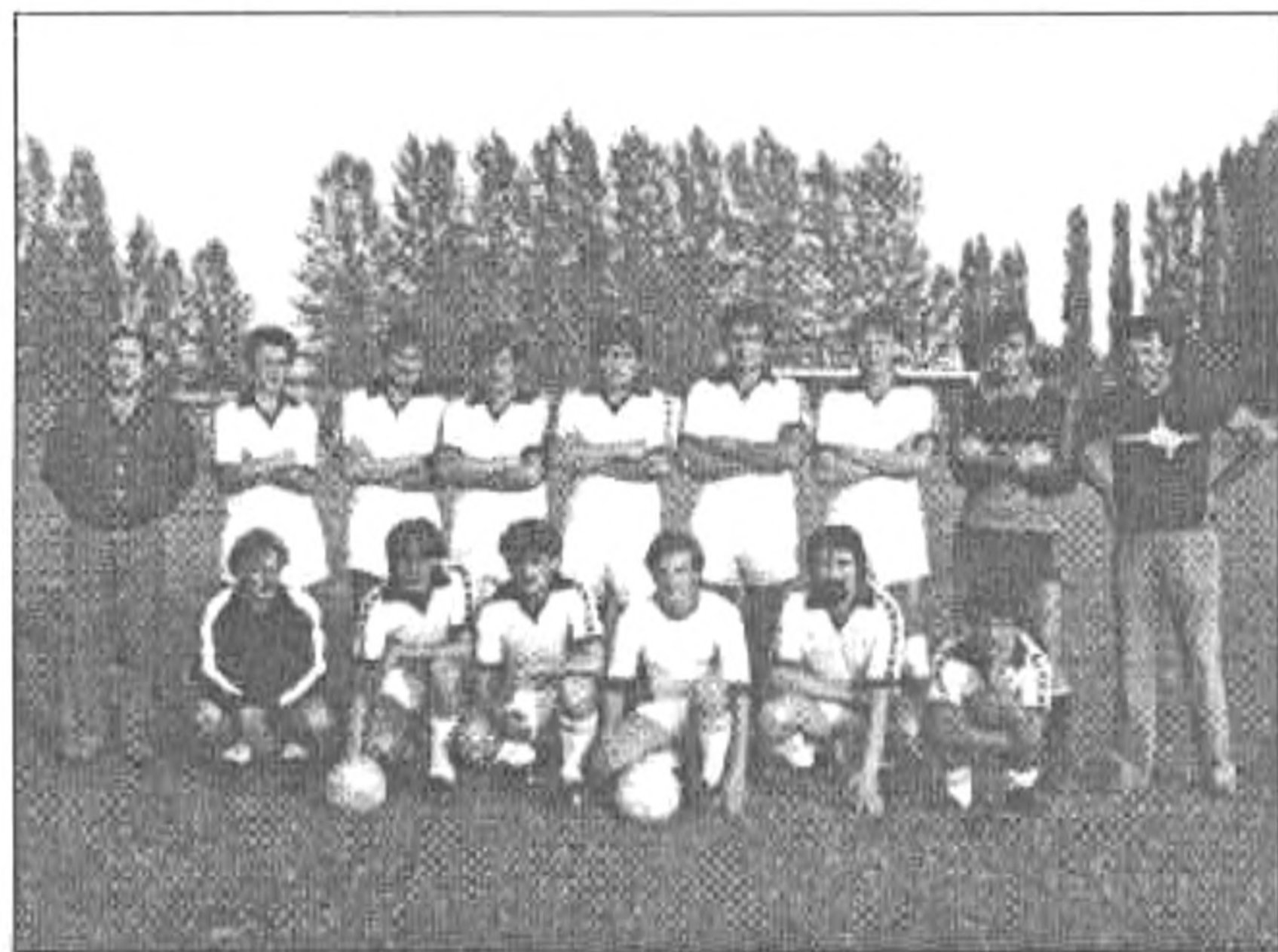
A Szegedi VSE elleni győztes meccs után.