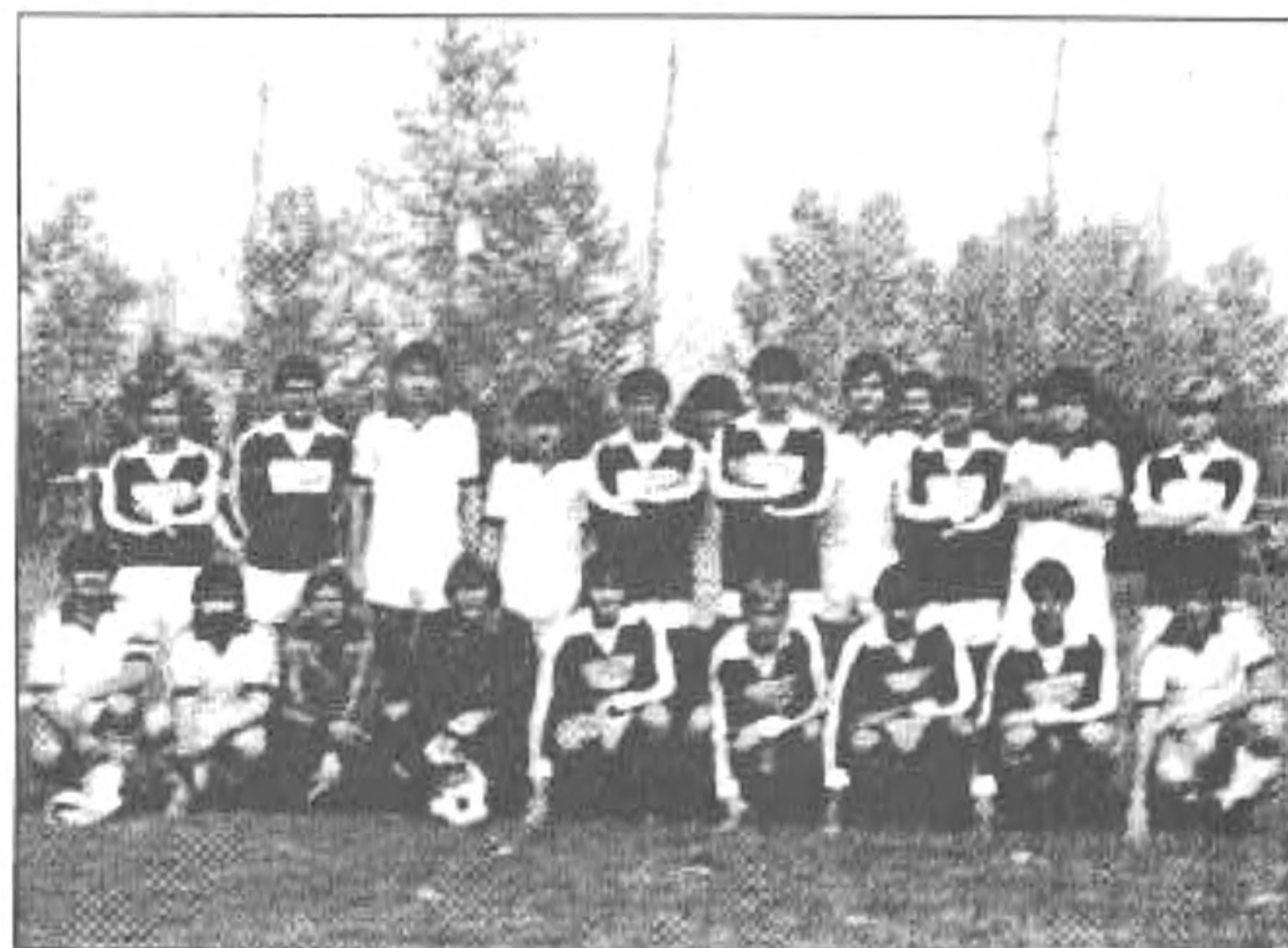
Közös felvétel a szolnoki csapattal a mérkőzés előtt. Fehérben a hazaiak.

A legjobb 32 közé jutásért Szolnoki MÁV-MTE - Békésszentandrás Hunyadi 5:0 (2:0)