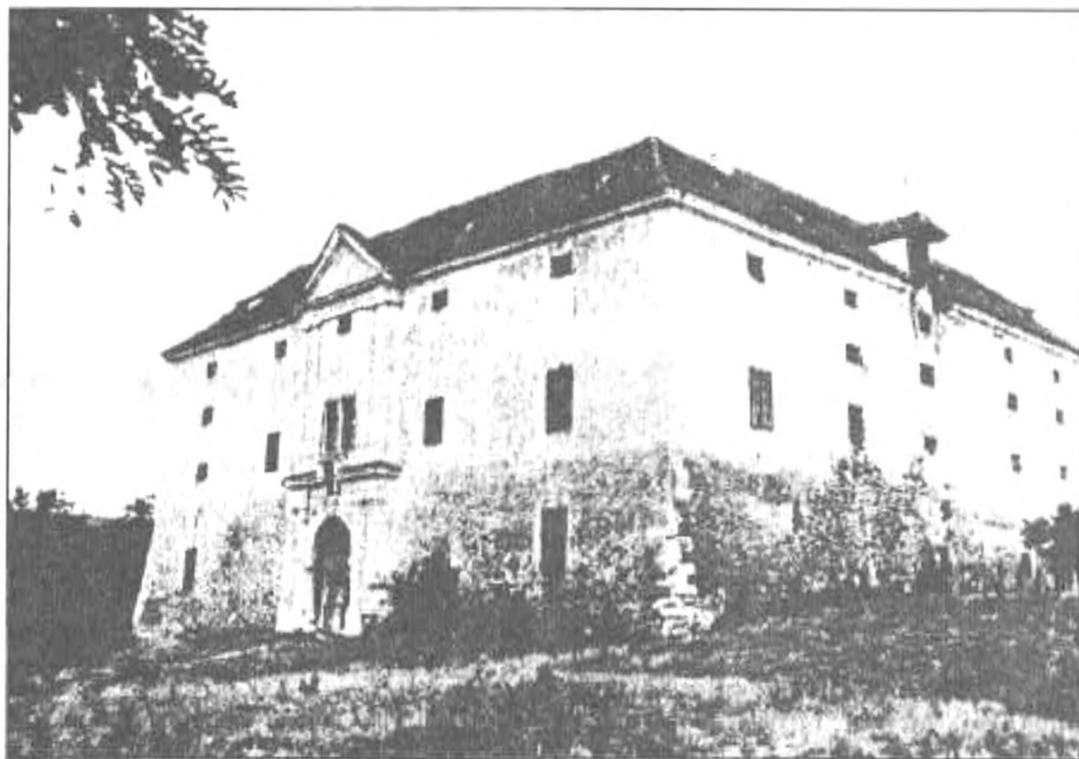
Ozora: A vár

közepette. A XVIII. században az Esterházyak magtárnak alakították át. 1968-tól feltárási munkákat végeztek a régészek, a 70-es években helyreállították jelentős részét. A műemléki felújítás minden fontosabb korszak jegyeit megőrizte. Okle-