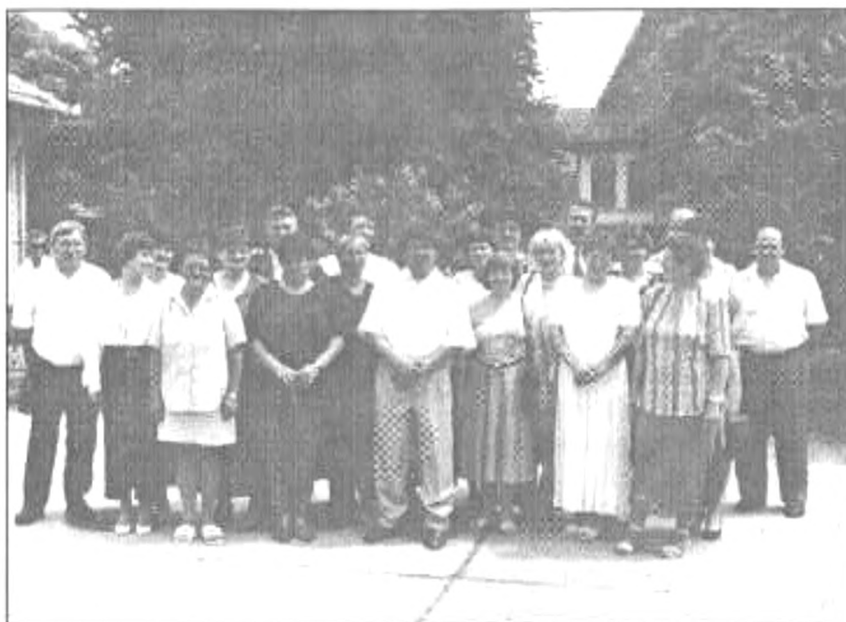
Az iskola udvarán

A következő állomásunk a Római Katolikus temető volt, ahol a két osztályfőnök és négy diáktársunk nyugszik. A ke-