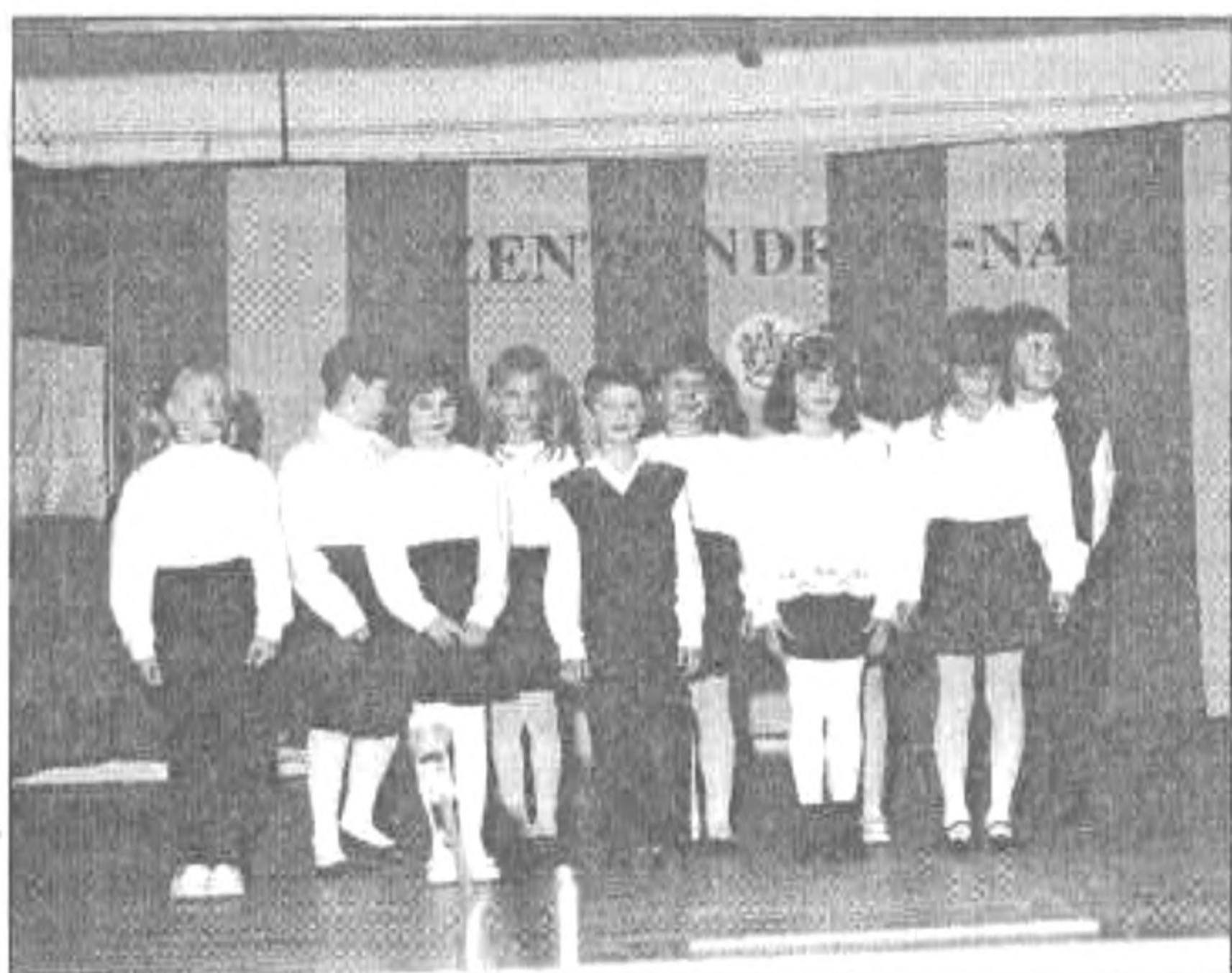
A 2.b osztály kórusa