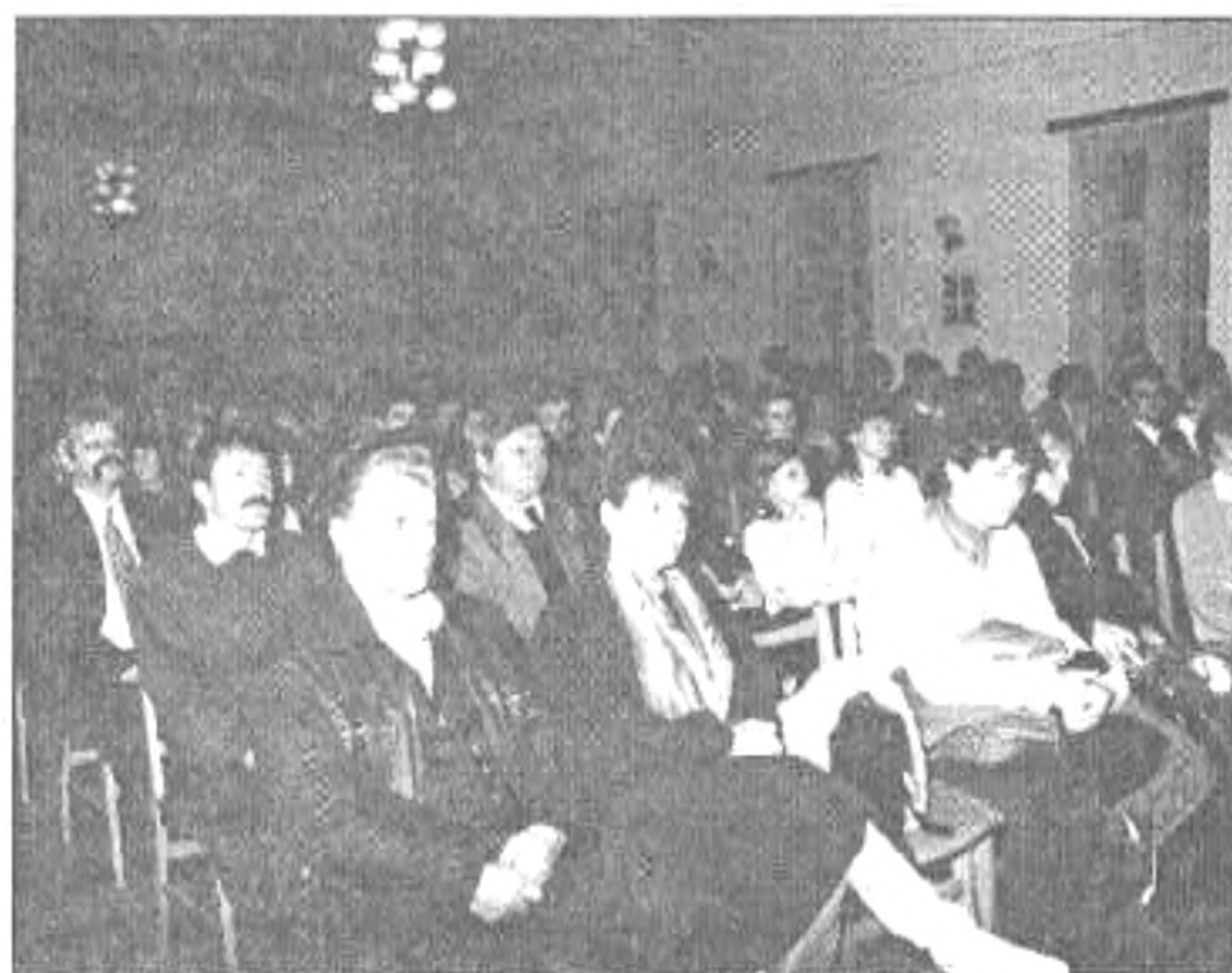
Az ünneplő közönség