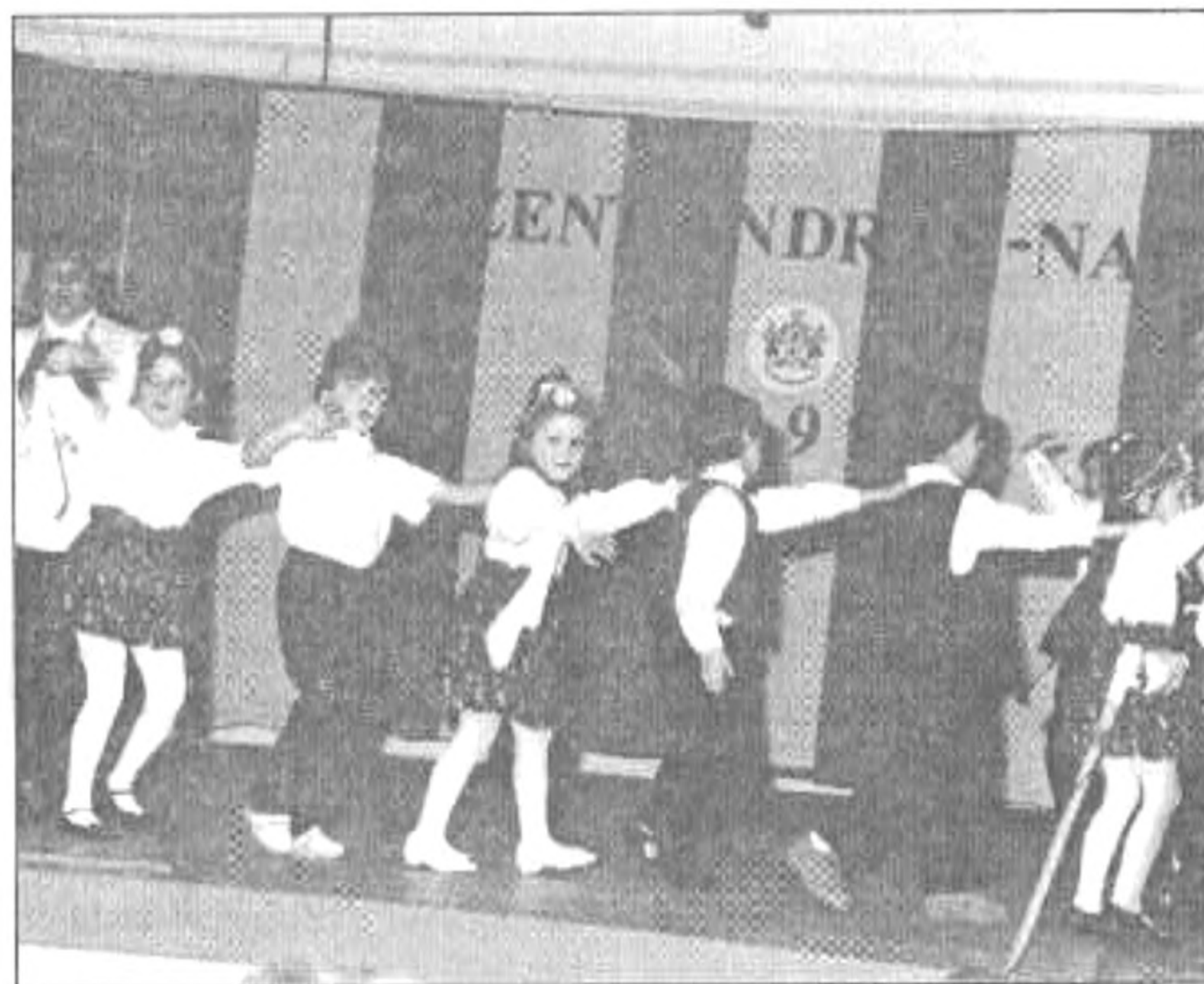
A Szt. László utcai óvodások