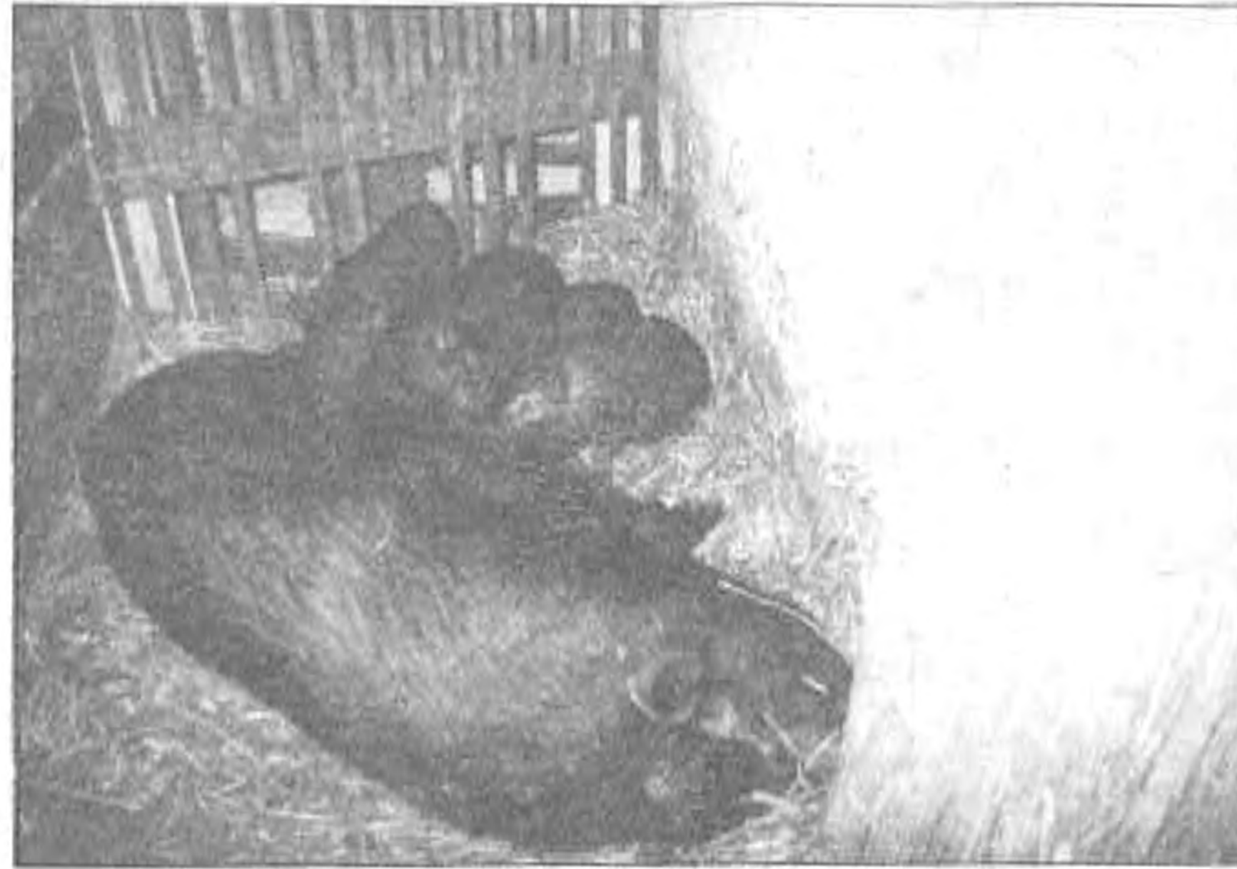
Az első fialás után 2 héttel (december 7.)

vű kanjának „kértük meg a kezét”, s az ő közreműködésével Giza és 3 leánya 31 aprósággal lepott meg bennünket. Viselkedésük, falkaszellemük, testvérkapcsolatuk, kommunikáció igényük, anyai gondoskodásuk leírása kész etológiai tanulmány lenne, de nem ezzel aka-