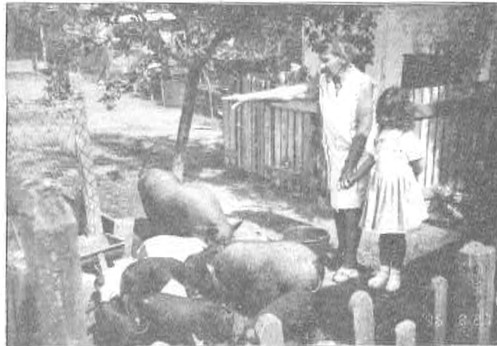
A falka egy része

A második vágás 2 tízhetes malacka. Eredmény: az egyik feldarabolva, fűszerezve sütőbe került. Ehhez olaj vagy zsír szükségeltetett, hiszen zsírpájuk alig volt. A másik nyársra került, s fóliába burkolva, fű-