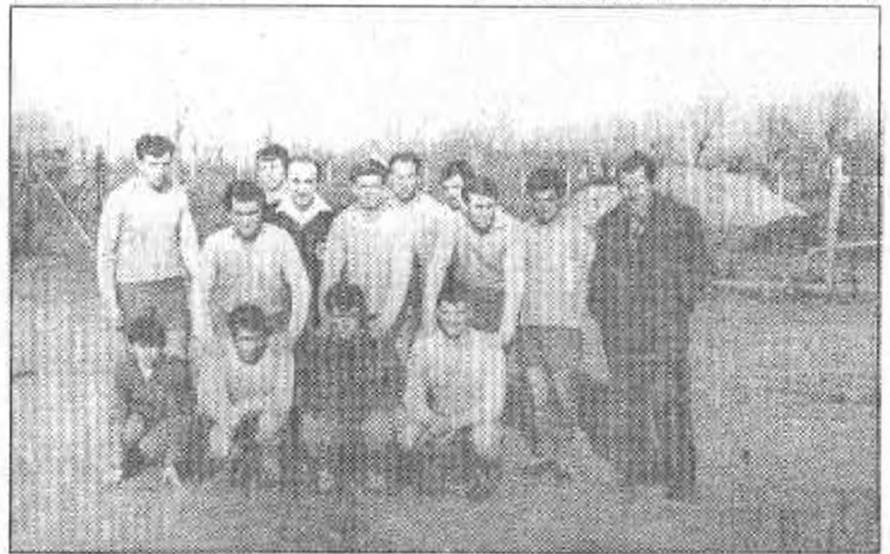
Képünk 1967. tavaszán készült Tiszasason, az előkészületi mérkőzésen