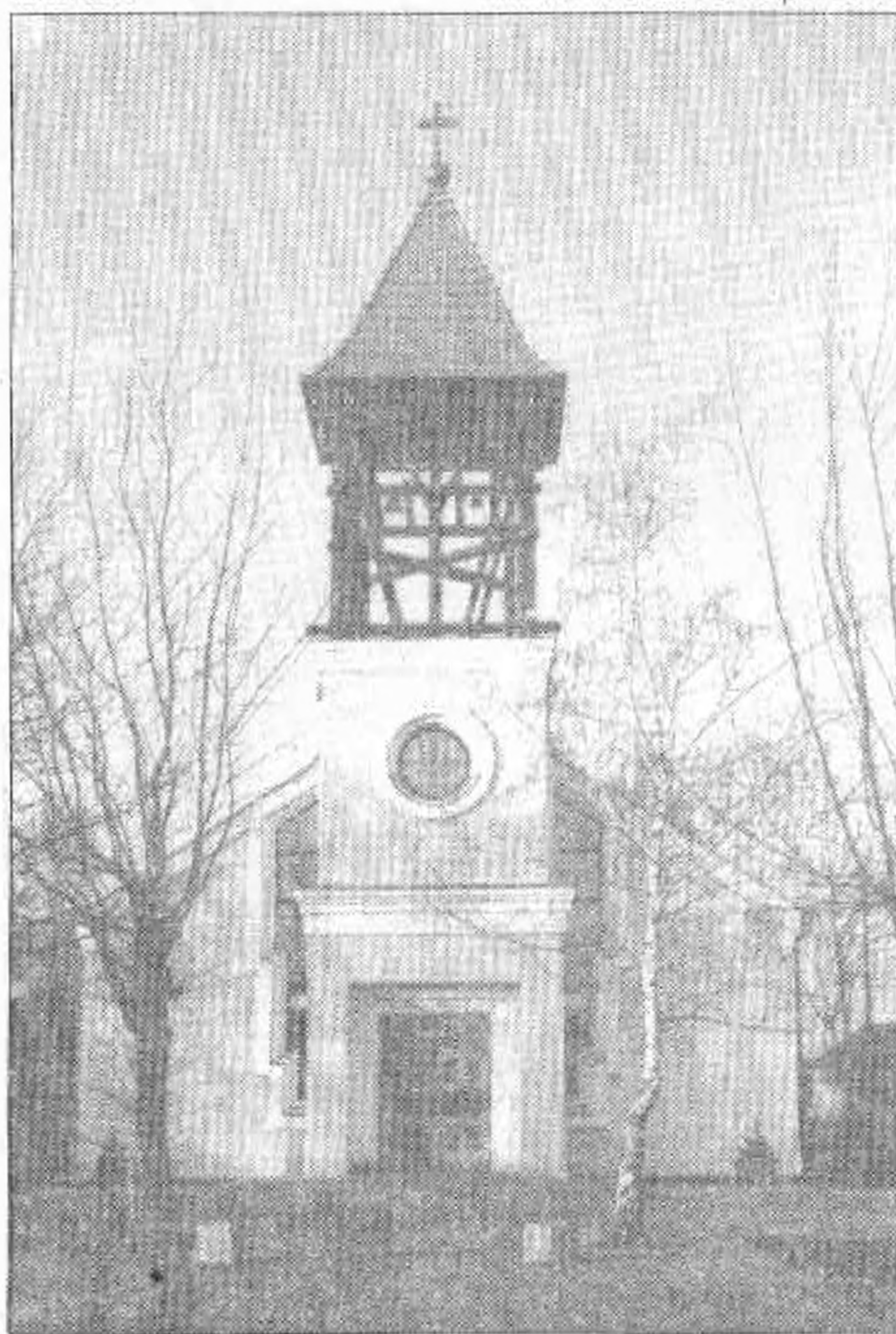
A jaminai templom

A motorkerékpárok között ugyan még sokáig elidőztünk volna, de az otthon maradtakra gondolva hazaindultunk.