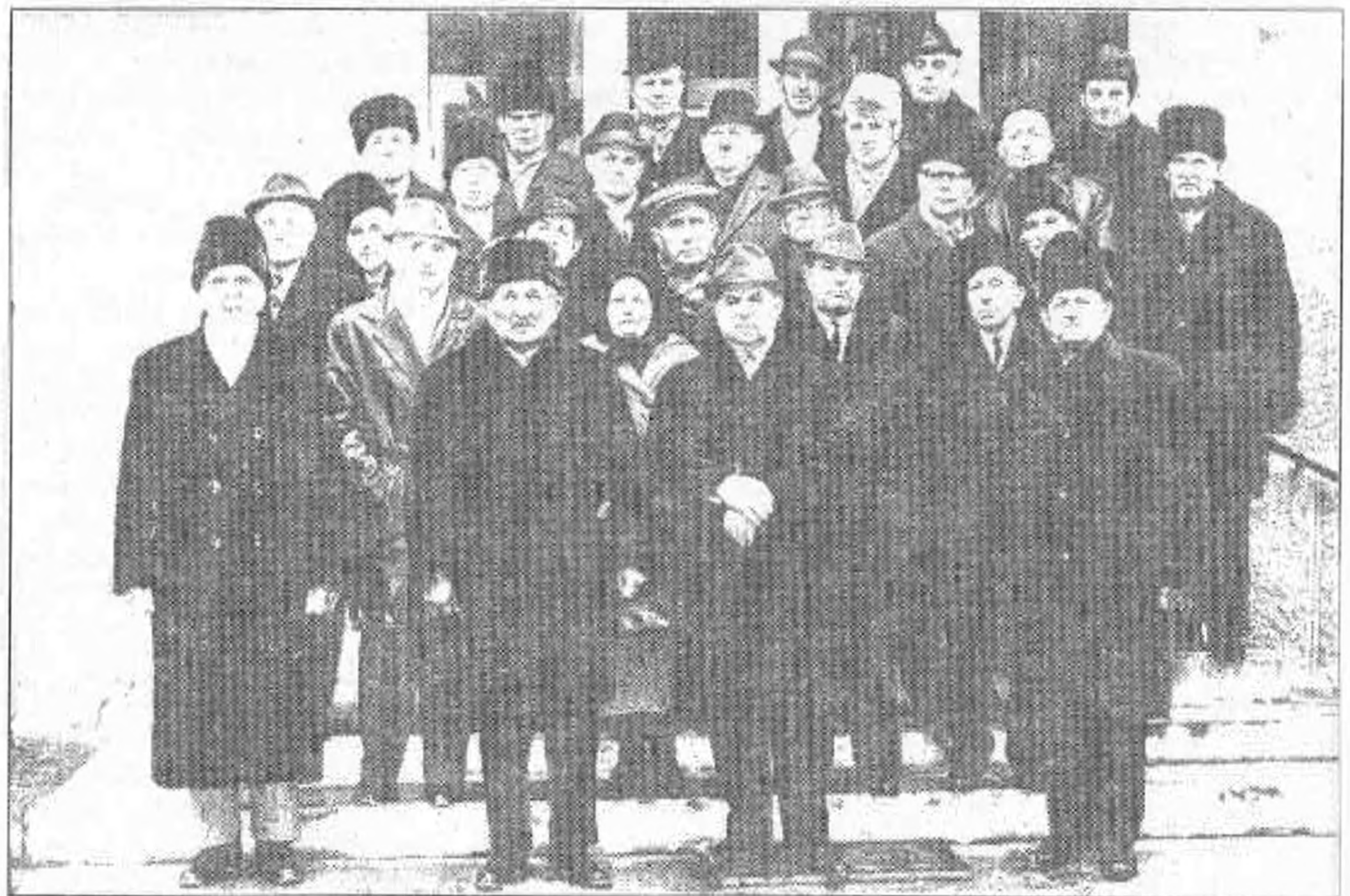
Balról jobbra, soronként:

Alakult: 1927. (egyesülés) Feloszlott: 1949. április 3. Tagok száma: 149 fő Ekkor az Iparoskör tulajdonában lévő székházat a község vette át, majd a szociáldemokrata párt kapta meg székháznak. Végül egy 1974. december 26-án tartott szentmise után készült csoportképet mutatunk be az olvasóknak, amelyen 27 iparos látható, ebből már 17 fő eltávozott az élők sorából. Szabó Imre