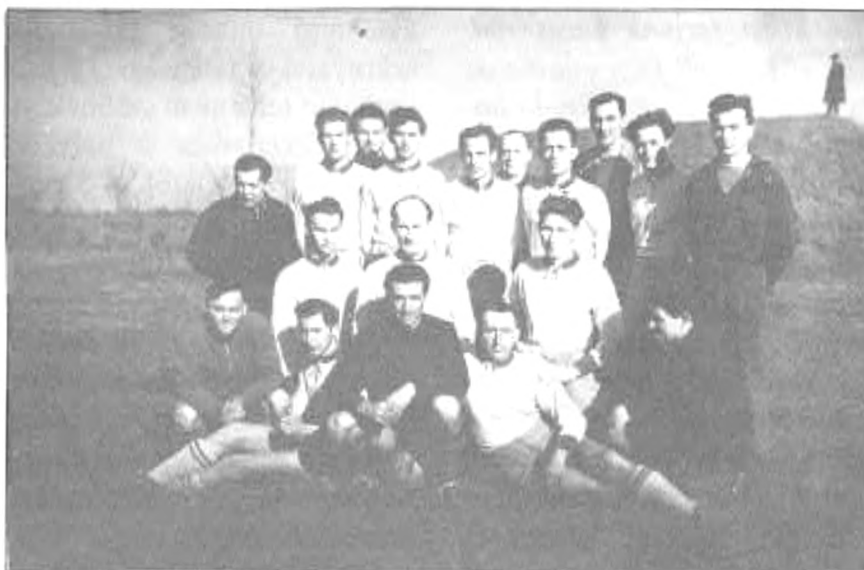
1952. őszi BSK - Csorvás 1:1 (háttérben a lödomb)

Az új névhez persze új elnökség is társult. Az elnök Komáro-