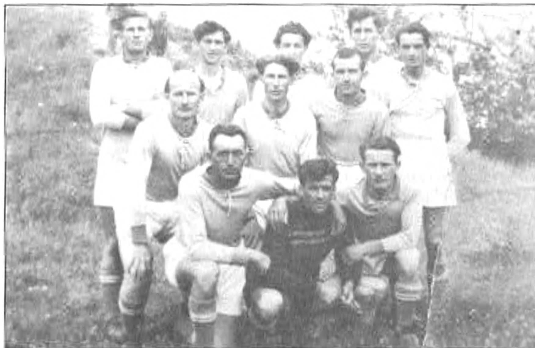
1955. május 29. BSK - Békéscsabai Vasas 5-1

szerezett a csapat. Ezzel a pontmennyiséggel pedig a tabellán igen előkelő helyen végzett. Most pedig következnek néhány érdekes eredmény az év párharcjai közül. (Egymást követő három mérkőzésről van szó!)