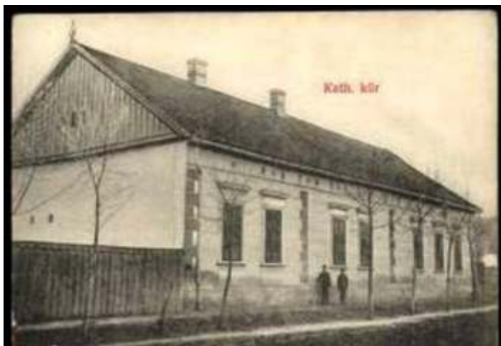
Az egykori katolikus kör a két világháború között