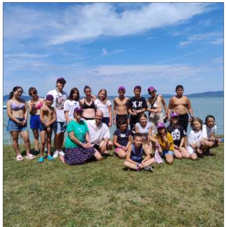
Békésszentandrás csoport a Balaton partján