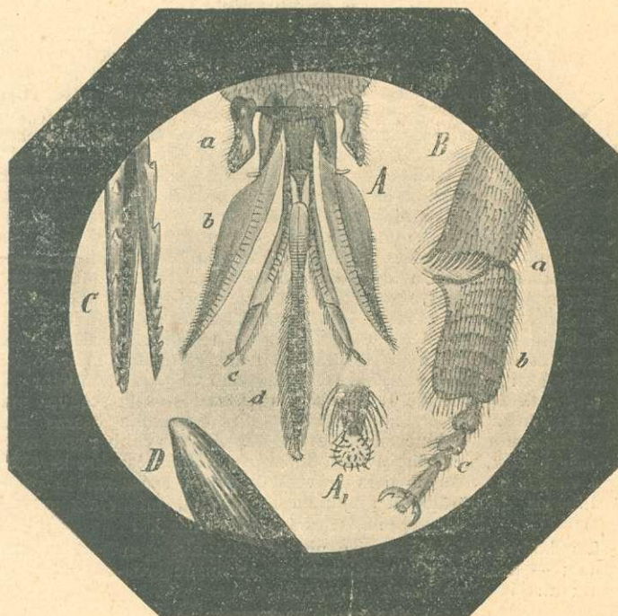
A) A dolgozó méh szájrészei 25-szörös nagyításnál, még pedig: a) rágó; b) alsó állkapocs; c) az alsó ajak tapogatói; d) nyelv. A.) A nyelv vége 220-szoros nagyításnál. B) A dolgozó méh hátsó lábának vége, 25-szörös nagyításnál: a) a lábszár alsó vége; b) a kefécske; c) a lábvég többi négy íze. C) A fulánk 220-szoros nagyításnál. D) Angol varrótü hegye, ugyan ilyen nagyításnál.

A rágók mellett — a középvonal felé — találjuk az alsó állkapcsokat . Tövük sötétebb, félhenger alakú és kivájt, úgy, hogy avval a közöttük fekvő nyelv tövét körülfoghatják. Alsó részük szakasztott olyan, mint valami orvosi műtökés pengéje. Ezen pengék külső része sárga színű, belső része majdnem víztiszta átlátszó; külső szélükön, valamint középső vonaluk szőröcskékkel vannak berakva. A pengék felső végükön apró kis nyulványt — tapogatót viselnek. Az alsó állkapcsok között találjuk az alsó ajkat vagy nyelvet tapogatóival , vagyis falámaival . A tapogatók négyizűek, az első íz leghosszabb, a második körülbelül csak fél akkora, a harmadik és negyedik nagyon rövid. Ezen tapogatók belső oldalukon kivájtak, úgy hogy a nyelvet körülfoghatják. Közöttük fekszik maga a nyelv , mely valamennyi szájrész között leghosszabb. Könnyen láthatjuk, hogy a nyelv haránt-rovátkás és különösen alsó felében erősen szőrös. Vége kiszélesedett, tüskés kanálkát képez, melynek pontosabb megfigyelésére erősebb (200-szoros) nagyítást kell használnunk. A nyelv segítségével veszi fel a méh a mézet és az egyéb, folyékony táplálóanyagokat. Működése részint nyalásra szorítkozik, részint pedig — s ilyenkor a tapogatók és többi szájrészek szorosan körülfogják — olyan, mint valami szívó