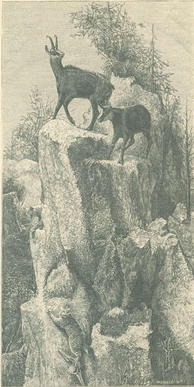
ZERGÉK. Részlet a párisi vadászati kiállításunkból.

Az azonban minden túlhajtás veszedelmes. Nemcsak az emberi nemnek átka az idegesség; hozzá tapad az a nemesen tenyésztett állatokhoz is. Minél nemesebben van az állat tenyésztve, rendszerint annál idegesebb az. Valamint az embernél az egyedüli meglekvés: a czélszerű táplálkozás, a szabadság, a mozgás és a sport, ép úgy áll az állatoknál is. Hivatásától elvonni az állatot: mindig megboszulja magát. S mi válik most divattá? Leghíresebb tenyésztők csak a kiállításoknak tenyésztnek s állataikat czipelik egyik kiállításról a másikra. Közben a tetszetős külsőért s nehogy valamiképen a szörzetben hiba essék, folyton mozgás nélkül zárva tartják s koncentrált táplálékkal etetik. A mozgás annyi, hogy egyik kiállításról a másikra viszik, zakatoló vonaton, zárt ketrecben. Azután a kiállításon a szegény állatot izgatja szánandó társainak a vonítása s a t. bámuló publikum. S ez így megy egész életén át a championjelöltnek; elvonatván tőle éltető eleme: a szabad légen való erős izom-