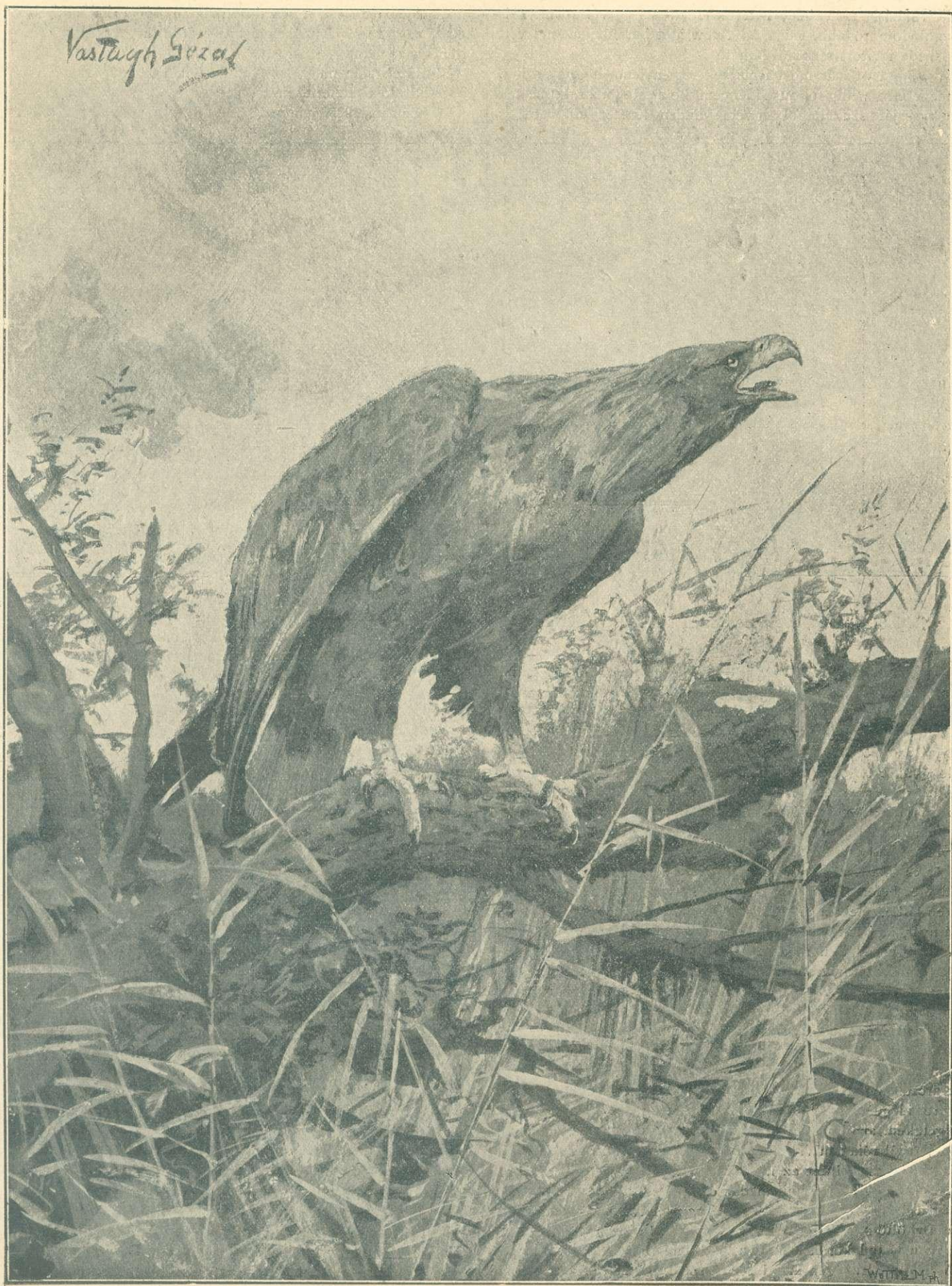
RÉTI SAS. »A TERMÉSZET« számára festette VASTAGH GÉZA.