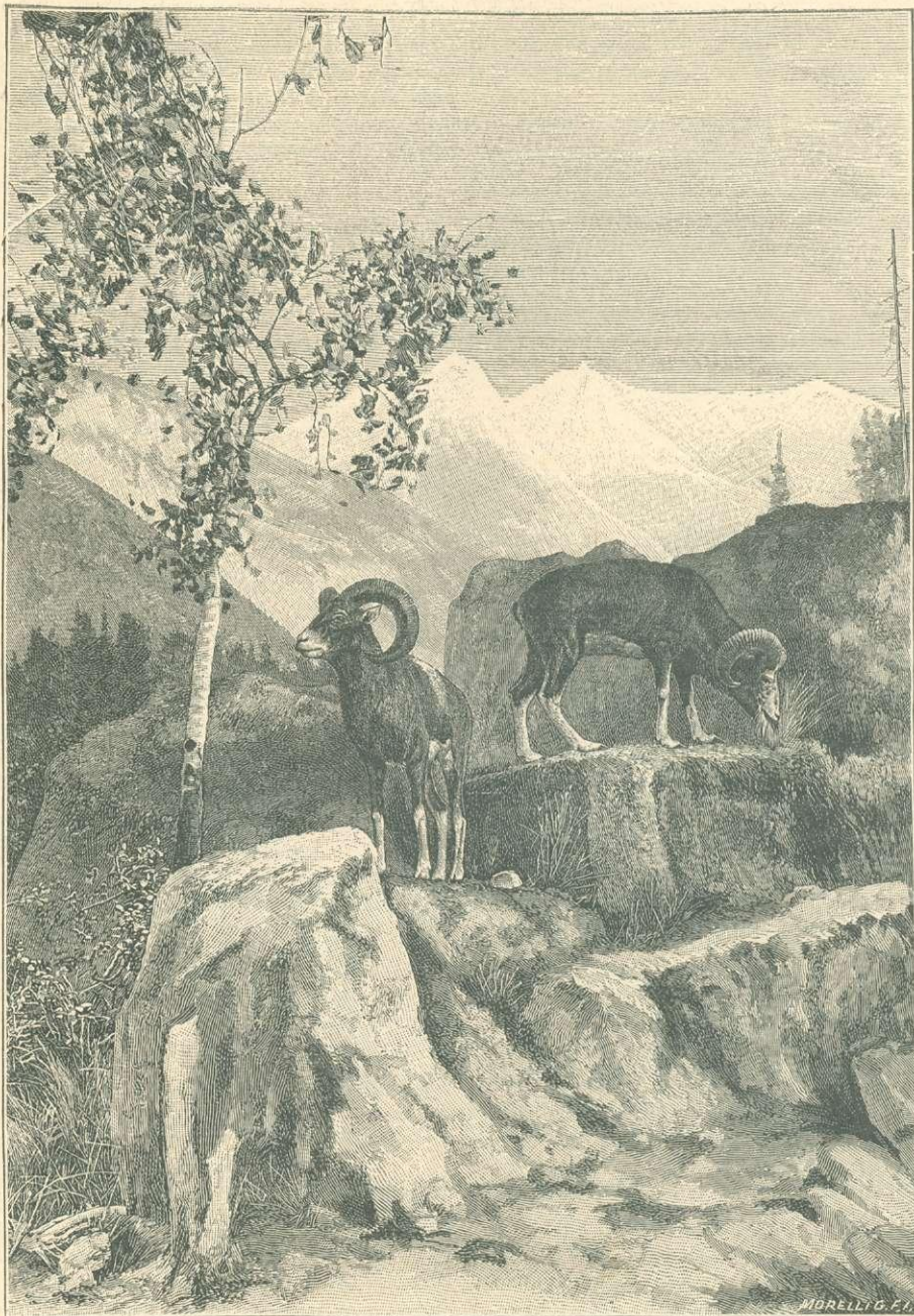
MUFLONOK. Részlet a párisi vadászati kiállításunkból.

„Nem értem e bírálatot, — „Pajtás“-nak sok nagyon kifogástalan pointje van — eleje Angliában is champion lenne. De nem hibanélküli; ott van a bel-beltenyésztés folytán két gerincsigolyájának a hibája. „Pajtás“ nem „Showdog“ — nem is annak van ő tenyésztve — ő „workingdog“ s mint ilyen mindig agyonveri magában a kiállítási ebet. Nekem úgy látszik, hogy a magyar levegő hirtelen átgyúrja az idegen bírákat is s hogy ezek azonnal more hungarico bíráltak. Nem az